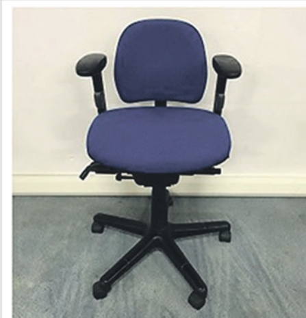
LUXE BLAUWE BUREAUSTOEL