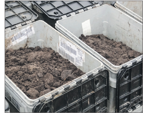
Het bruto resultaat van proefboringen

40.000 stuks vuursteen, een paar honderd natuursteen-tjes, veel houtskoolresten uit haardkuilen, karrensporen, tientallen grondmonsters met onder meer pollen. Het zijn de stille getuigen uit de prehistorie die veel zullen vertellen aan dolenthousiaste archeologen en aan iedereen die het daarna horen wil. In deze bonte, rijke bron drijft een schat aan informatie. De laatste negenduizend jaar intact gebleven bodemstructuur stelt de archeologen ook nog eens in de gelegenheid een landschappelijke reconstructie te maken.