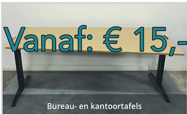
Bureau- en kantoortafels