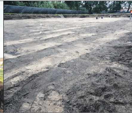
Graafmachines verwijderen de bovenste laag grond (0,5 tot 1,5 meter).