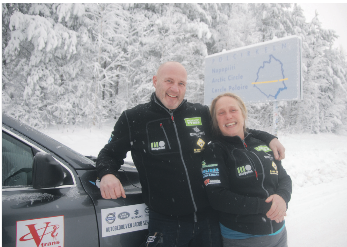
• Bij -18 graden en strakblauwe lucht schiet je de prachtigste platen.

De derde etappe ging via de Poolcirkel en Finland hogerop en eindigde in Tromsø, Noorwegen. 'De volgende etappe voerde ons