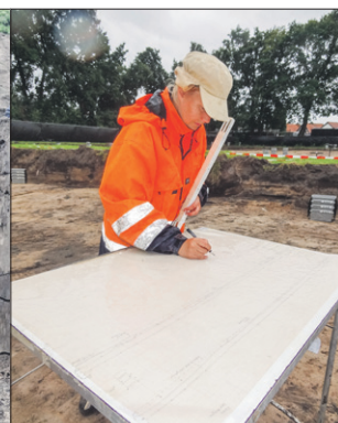
Foto's: Soester Courant, Milo Verhamme; illustratie: Bianca Snip; artist impression: Heijlijgers Projectontwikkeling BV

De schatgravers stuitten zowel kwalitatief als kwantitatief op een rijke buit, waaronder bijzondere vuursteentjes in de vorm van de maretak. Minstens zo belangrijk voor de archeologen en de geschiedschrijving is de intact gebleven bodemstructuur. Die zal - na grondig onderzoek - veel prijsgeven over het leven in dit gebied, zo'n negenduizend jaar geleden.