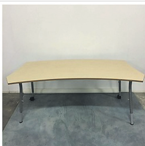
VERSTELBAAR BUREAU MET BEUKEN BLAD