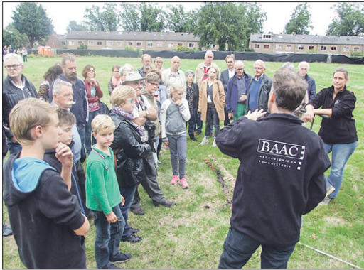
Feestelijke, informatieve startbijeenkomst begin september 2015.

Millennialang lag de middensteentijd verborgen onder een maaiveld dat zich verder ophoogde. Boeren uit de ijzertijd ploegden er niet. Romeinen noch Vikingen konden het onderaardse van de latere Staringlaan veroveren. De gouden eeuw, de eerste industriële revolutie, zelfs de accelerende ontwikkelingen van de laatste honderd jaar kregen geen vat op de bodem, ook niet toen daar een woonwijk uit de grond werd gestampt. Van de korfballers met hun sportieve totempalen evenmin serieuze aanvallen op de geconserveerde geschiedenis die Moeder Aarde met stuifzand zorgvuldig onder haar hoede had genomen. 'Klein-Gallië' binnen de bebouwde kom viel pas toen archeologen groen licht kregen van raadsleden uit de 21e eeuw. Zij hadden er bijna 700.000 euro voor over om het 'stortgat' van nomaden uit te graven.