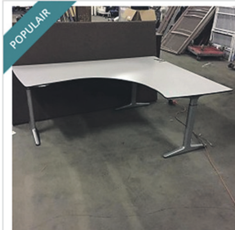
AHREND ELEKTRISCH VERSTELBAAR BUREAU