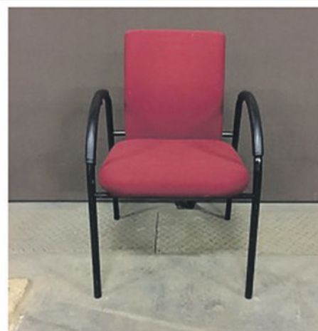
CONFERENTISTOEL LUXE ROOD