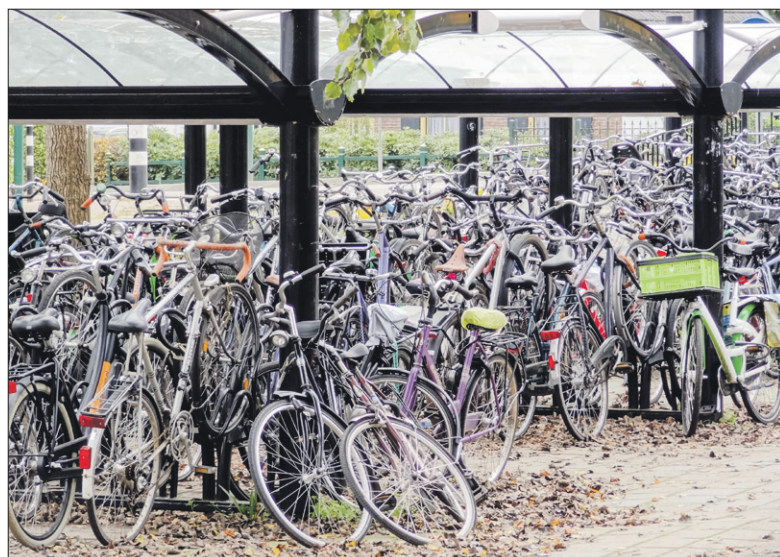
● Tip: ‘Bevestig fietsen met een kabelslot aan een vast voorwerp.’

Websites waarop burgers zich kunnen laten informeren over zinvolle preventieve maatregelen: geefinbrekersgeenkans.nl maakhetzeniettemakkelijk.nl