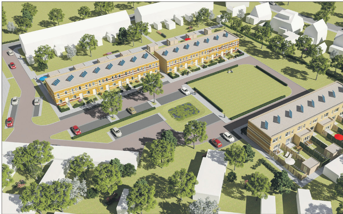
• Het toekomstige Jan Wolkershof in 'vogelvlucht'.

Meer informatie over de woningen is te vinden op de website www.wolkerserf.nl . Wolkerserf is de projectnaam. Makelaar Deelen die de