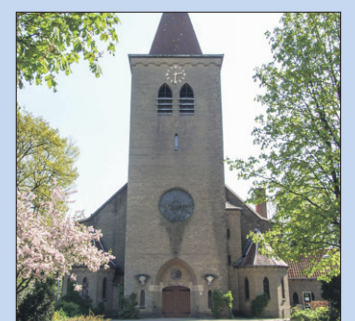
● Zaterdag: Heilige Familiekerk.

15:00 (tot 17:00 uur) High tea, spelletjes en ontmoeten in De Open Hof, Veenbeestraat 2.