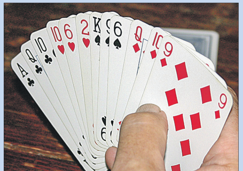
● Maandag: Vrijblijvend bridgen voor senioren.