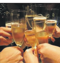
Happy Hour 21.00 uur