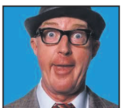
André van Duin 10.00 uur