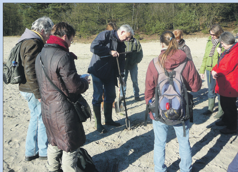
● Zondag: Wandeling IVN Eemland.

14:00 Torenbeklimming Oude Kerk (bij helder weer), Torenstraat 1. Aanmelden via frhoogeweg@tel-fortglasvezel.nl .