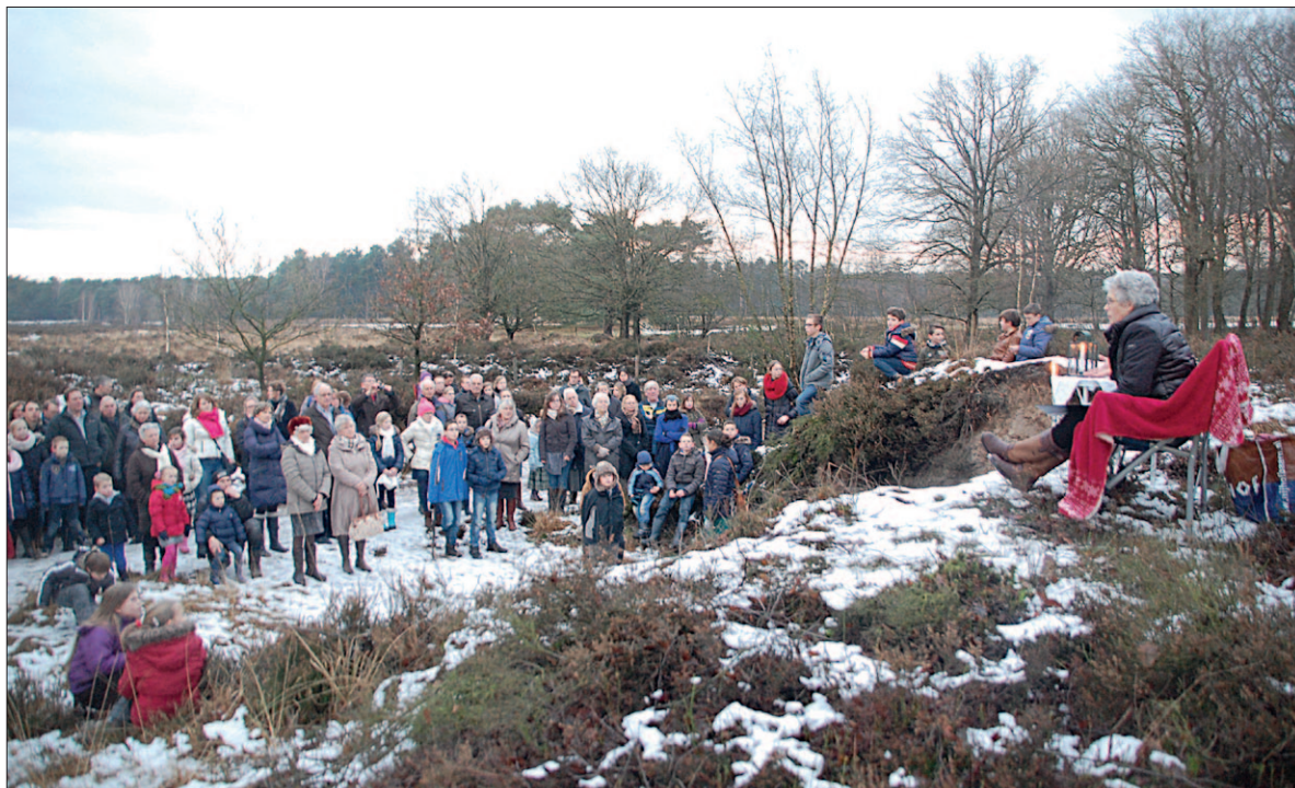
● De tiende editie van de winterwandeling van Woord en Daad Soest kende een recordaantal deelnemers. 257 mensen namen deel aan de activiteit. Daarmee werd een bedrag van 1.600 euro voor het goede doel opgehaald.

De landelijke stichting Woord en Daad wil vanuit christelijk perspectief armoede bestrijden in Afrika, Azië en Midden-Amerika.