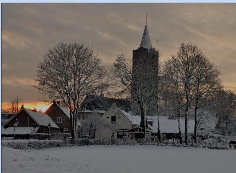
● Zaterdag: Oriëns in de Oude Kerk.