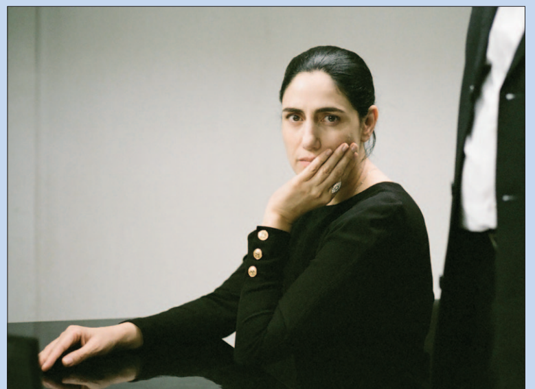
● Woensdag: Film in Artishock.