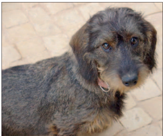
In de Lange Duinen is vrijdag de ruwharige teckel Jet doodgebeten door een andere hond.