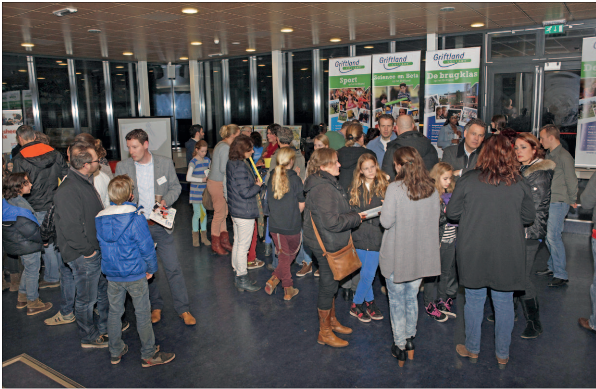
● De scholenmarkt trekt ieder jaar veel belangstelling van ouders en hun kinderen, die momenteel in groep 8 zitten en dit jaar voor een keuze staan. Vorig jaar was er veel animo.

Naast Het Baarnsch Lyceum, de Waldheim-mavo en gastheer van de scholenmarkt het Griffland College is uit Baarn/Soest ook de Democratische school De Ruimte aanwezig. Vanuit Amersfoort komen er van vijftien scholen vertegenwoordigers. Alle stromingen zoals vmbo, havo, en vwo zijn aanwezig. De scholen uit Amersfoort zijn: Accent (praktijkonderwijs), Corderius College, De Amersfoortse Berg, De Baander (praktijkonderwijs), Farel College, Guido