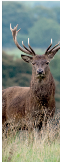
In Ommetje natuur aandacht voor ecoducten. Helpt dat de natuur wel, al die bouwwerken? Zondag 11:00 uur

08.00 De Verrekijker 08.30 Zingenderwijs 09.00 Religie en poezie 10.00 Religieus program 11.00 Ommetje Natuur 12.00 Rejoice 13.00 De week in Soest 14.00 Viva la Musica 16.00 Operetteland 17.00 Samen bijbellezen 18.00 De week in Soest 19.00 Viva la musica 21.00 Non Stop Muziek tot 09.00 uur