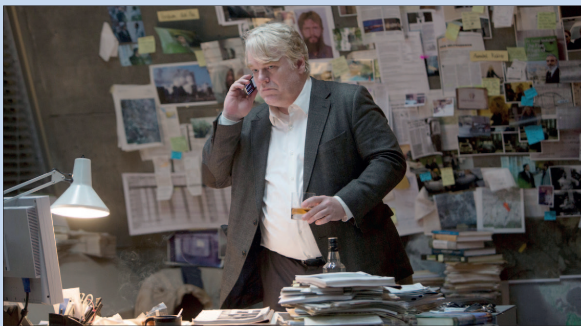
● Woensdag: Film 'A Most Wanted Man' in Artishock.

20:15 Film Gett: The Trial of Viviane Amsalem over een vrouw die wil scheiden van haar man en wat moeizaam verloopt, Filmhuis Artishock, Steenhoffstraat 46a, € 6,50/5,00 (leden Artishock).