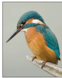
Jelle Harder komt in Ommetje Natuur vertellen over die bijzondere ijsvogels in Nederland.

09.00 Soest Actueel 10.00 N.O.R.S. 11.00 Ommetje Natuur 12.00 Country 13.00 Soest Actueel 14.00 N.O.R.S. 15.00 Ommetje Natuur