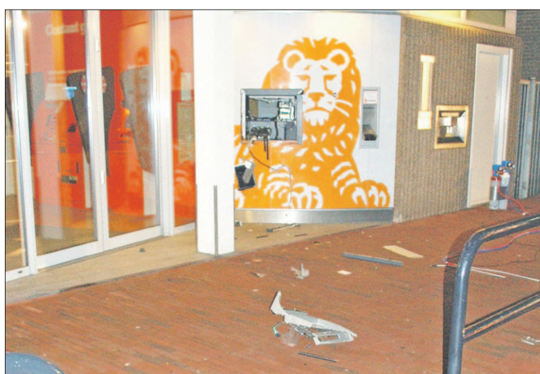
● Een plofkraak heeft de daders geen buit opgeleverd. Wel zorgde de knal ervoor dat het pinaapparaat volledig aan gort was. Onderdelen lagen her en der verspreid.

Omdat de daders twee gasflessen hadden gebruikt bij het opblazen van de automaat en niet duidelijk was of er nog ontploffingsgevaar was, schakelde de politie de brandweer in voor een controle van de gebruikte apparatuur. Nadat de brandweer de situatie veilig had verklaard, kon de politie beginnen met sporenonderzoek. Onderdelen van de pinautomat lagen over een flinke afstand verspreid. De daders hebben geen geld buit kunnen maken en waren verdwenen. De Van Weestraat werd tijdelijk afgezet. Het verkeer werd omgeleid.