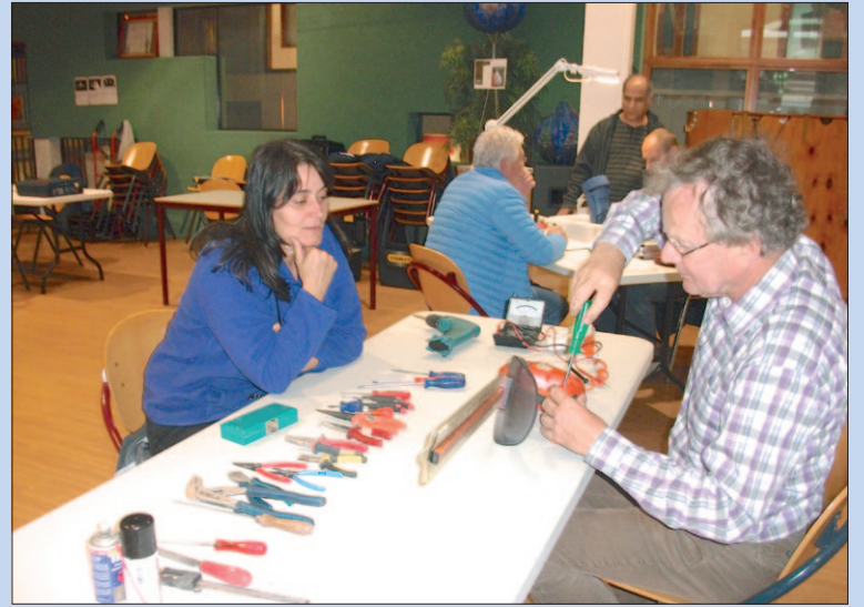
● Zaterdag: Reparaties in het Repair Café.