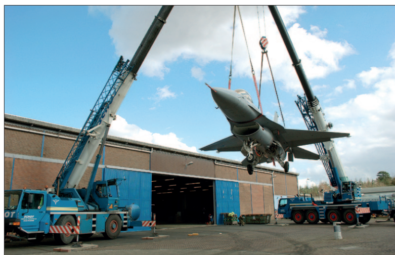
● Het hele jaar wordt er hard gewerkt om het Nationaal Militaire Museum in te richten. Vliegtuigen, tanks en veel meer worden naar binnen gesleept en getakeld.