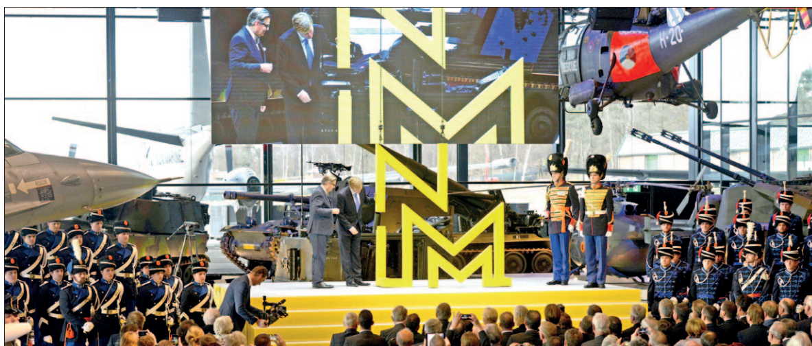
● December: Koning Willem Alexander opent het Nationaal Militaire Museum. Op 20 december gaat het open voor publiek. Het museum blijkt een publiekstrekker. Elke dag passeren duizenden bezoekers de kassa.