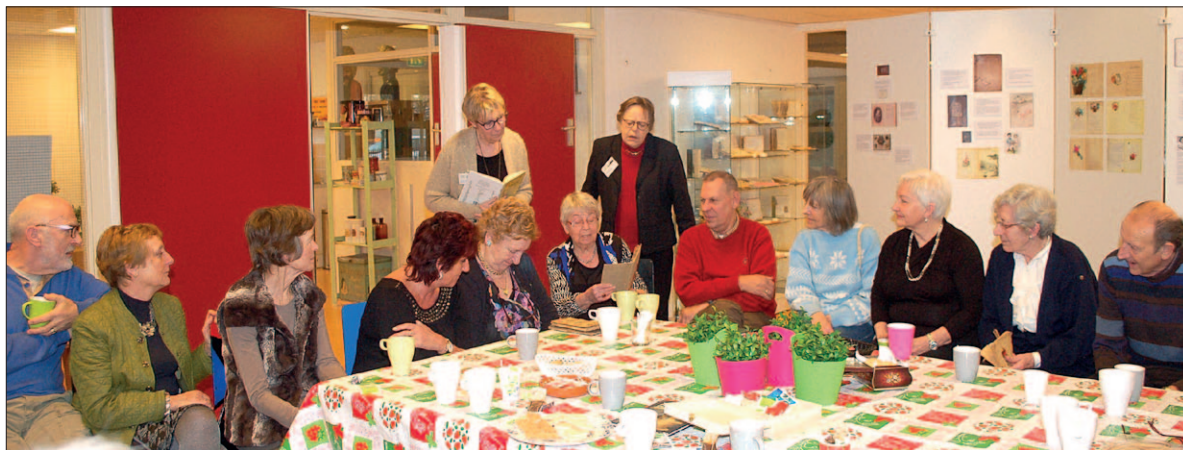
● Februari: Het thema 'Poëziealbums' blijkt een schot in de roos van de Historische Vereniging Soest/Soesterberg. Veertig belangstellenden leveren van tevoren al hun poëziealbums in. Tijdens het Erfgoedcafé in De Linde komen veel

Soesterbergers voorlezen en luisteren. Het is dringen bij de tentoongestelde boekjes, waarin de bezoekers op zoek gaan naar hun eigen naam en de versjes van klas- en leeftijdgenoten.