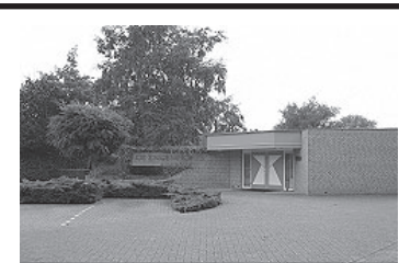
De Engenhof Alb. Cuyplaan