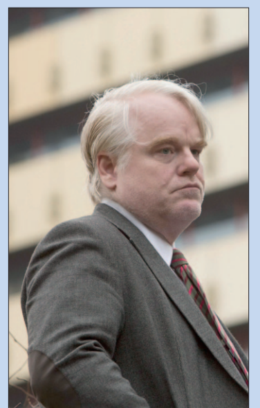
● Maandag: A most wanted man