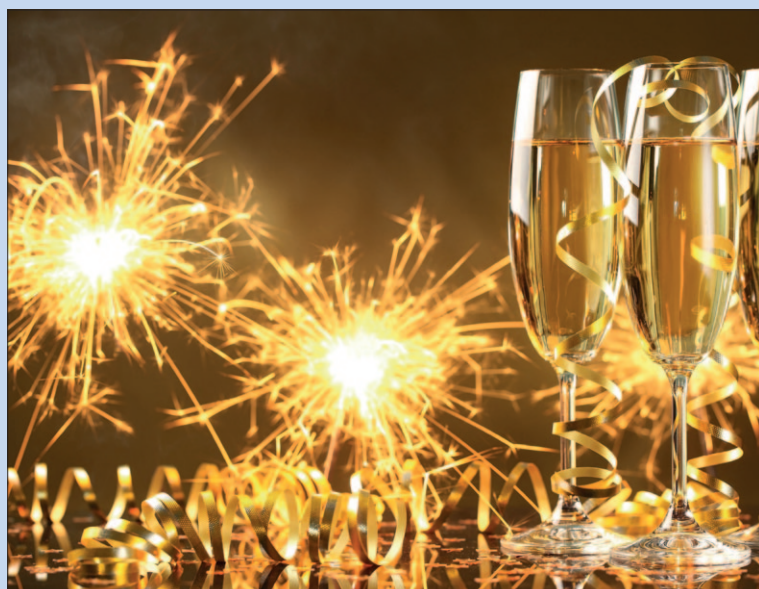
● Diverse nieuwjaarsrecepties.