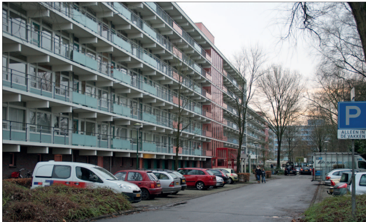
● De Akkeren is één van de straten die meedoet aan het Klimaatstraatfeest. Is dit de meest duurzame straat van Nederland?

Het HIER Klimaatstraatfeest is al zes jaar de grootste energiebesparingswedstrijd van Nederland. Sinds 2008 komen duizenden deelnemers ieder stookseizoen samen met de bureaus in actie tegen het klimaatprobleem. Meer info op klimaatstraatfeest.nl .