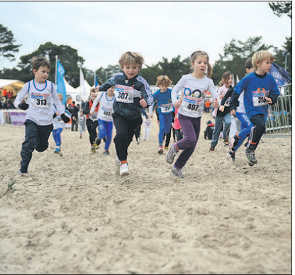
Sport de Aanloop besteedt zaterdag om 09:00 uur aandacht aan de Sylvestercross.

16:00 Uurtje Frans 17:00 Country today 18:00 Soest Actueel 19:00 Verrekijker 19:30 Zingenderwijs 20:00 Samen bijbel lezen 21:00 Rejoice 22:00 Religie en poezie 23:00 Soest Actueel 24:00 Non-stop muziek tot 09:00 uur