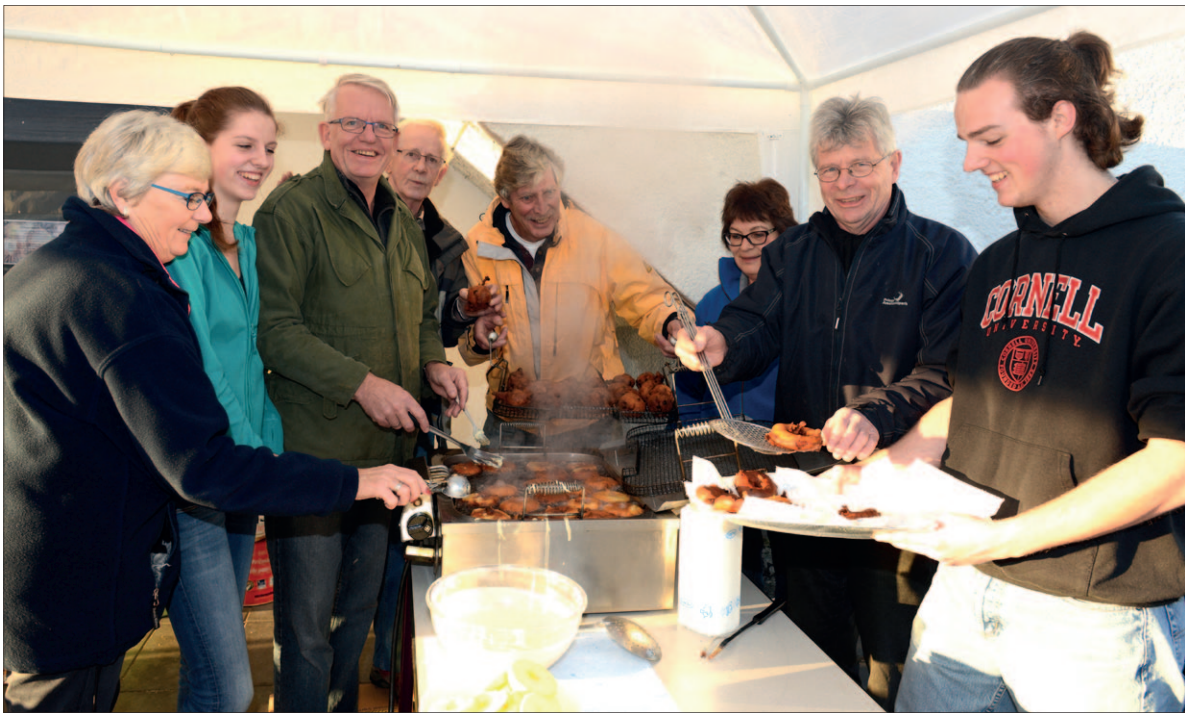
• Het eten van oliebollen en appelbeignets op oudjaarsavond en op nieuwjaarsdag wordt al eeuwen gedaan in ons land. De lekkernij maakt deel uit van ons cultureel erfgoed. Al jaren verkopen vrijwilligers van De Open Hof en mannen van het Soester Mannenkoor Apollo de laatste twee dagen van het jaar de twee deegproducten. Eet smakelijk.