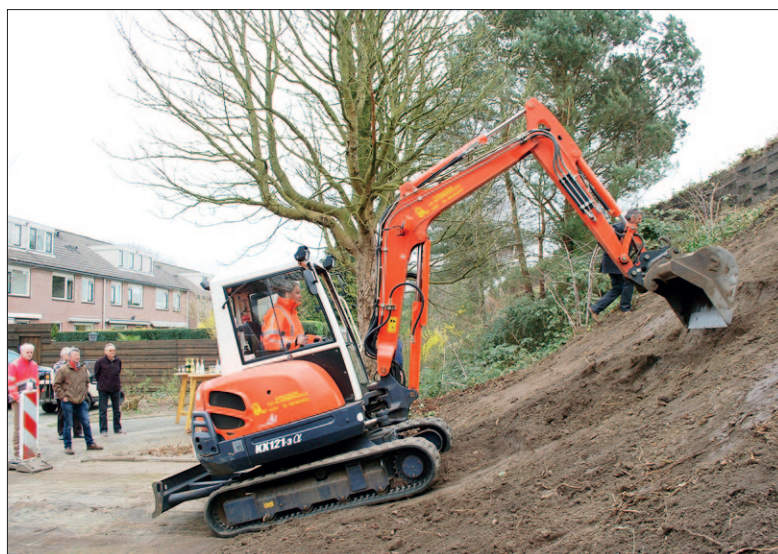
● Maart: De geluidswal achter Gemini langs de A28 is geen gatenkaas meer. Die conclusie is te trekken na herstelwerkzaamheden die zijn afgerond. Over een lengte van 1,3 kilometer vult Van Dorresteijn Cultuurtechniek achtduizend gaten in de keermuur. Obstacles moeten mensen tegenhouden. Er is klimop aangeplant om de wal een groen karakter te geven.