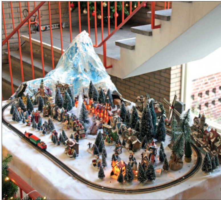
● Sinds twee jaar prijkt er jaarlijks een heus kerstdorp in de hal van een flat aan de Albert Cuyplaan.

helpen mee met het opzetten en stellen spullen beschikbaar.' Dat iedereen er mee bezig is bewijst één van de bewoners die de berg wat beschilderde. 'Daardoor is het meer een gletsjer geworden.' De bewoners zijn enthousiast over het kunstwerk, laat Harry weten. Voorlopig kunnen ze er nog van genieten. Het kunstwerk staat er al een tijdje, maar blijft voorlopig ook nog staan. Halverwege januari wordt alles opgeborgen voor volgend jaar.