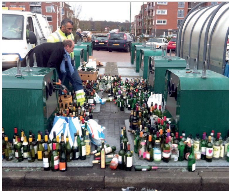
● Proost op het nieuwe jaar. Voor veel mensen zijn het gezellige feestdagen geweest. De containers op de milieu-eilanden, die vanwege vuurwerk uit voorzorg een poosje op slot zaten, kunnen de stroom lege flessen niet aan.