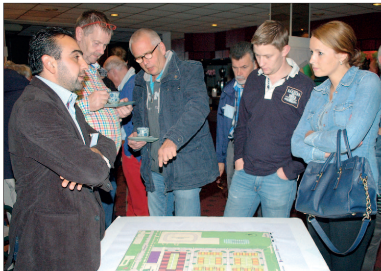
● Misschien wel het meest besproken in Soesterberg dit jaar: het evenemententerrein met als meest bediscussieerde onderdeel de locatie van het sociaal-cultureel centrum. Te veel om samen te vatten, en bovendien: wordt vervolgd.

...voor het wild. Na jaren van plannen, procedures en het uitkopen van onder meer de Sauna Soesterberg begint eindelijk de aanleg van het Boele Staal ecoduct over de Amersfoortsestraat. Het ecoduct is de laatste in een schakel van vijf en gaat ongeveer 25 miljoen euro kosten.