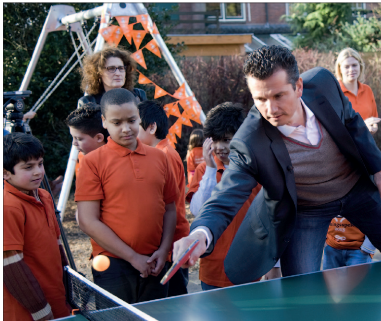
● 'King' Richard Krajicek geeft het landelijke startsein voor de inschrijving voor Koningsdag 2015. Hij doet dat op de Prins Willem Alexanderschool waar hij niet een tennisracket maar een tafeltennisbatje ter hand neemt.