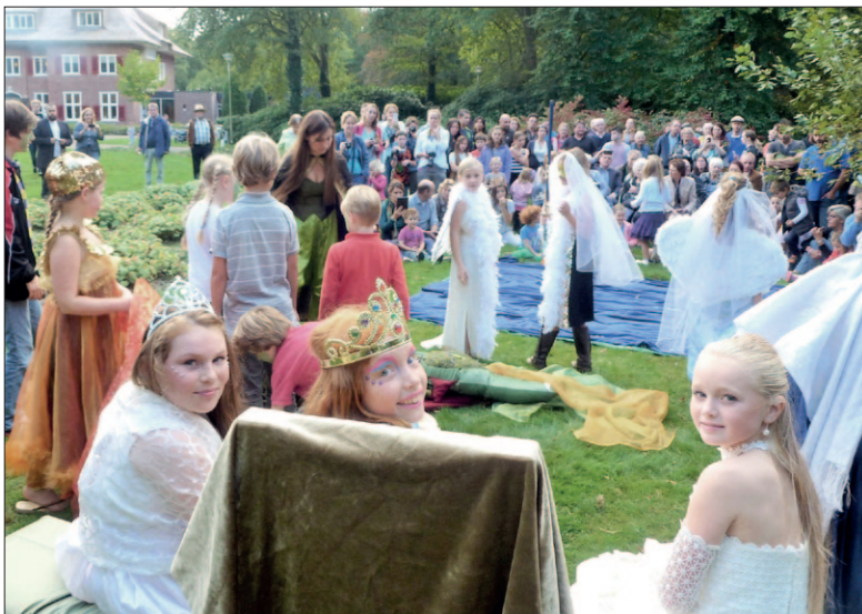
● September: Indian Summer in Soesterberg, waar kunst de zomer verlengde en daarbij alle medewerking kreeg van de weergoden. Een geslaagd festival met zang, instrumenten, expressie, toneel, humor en ontmoetingen.