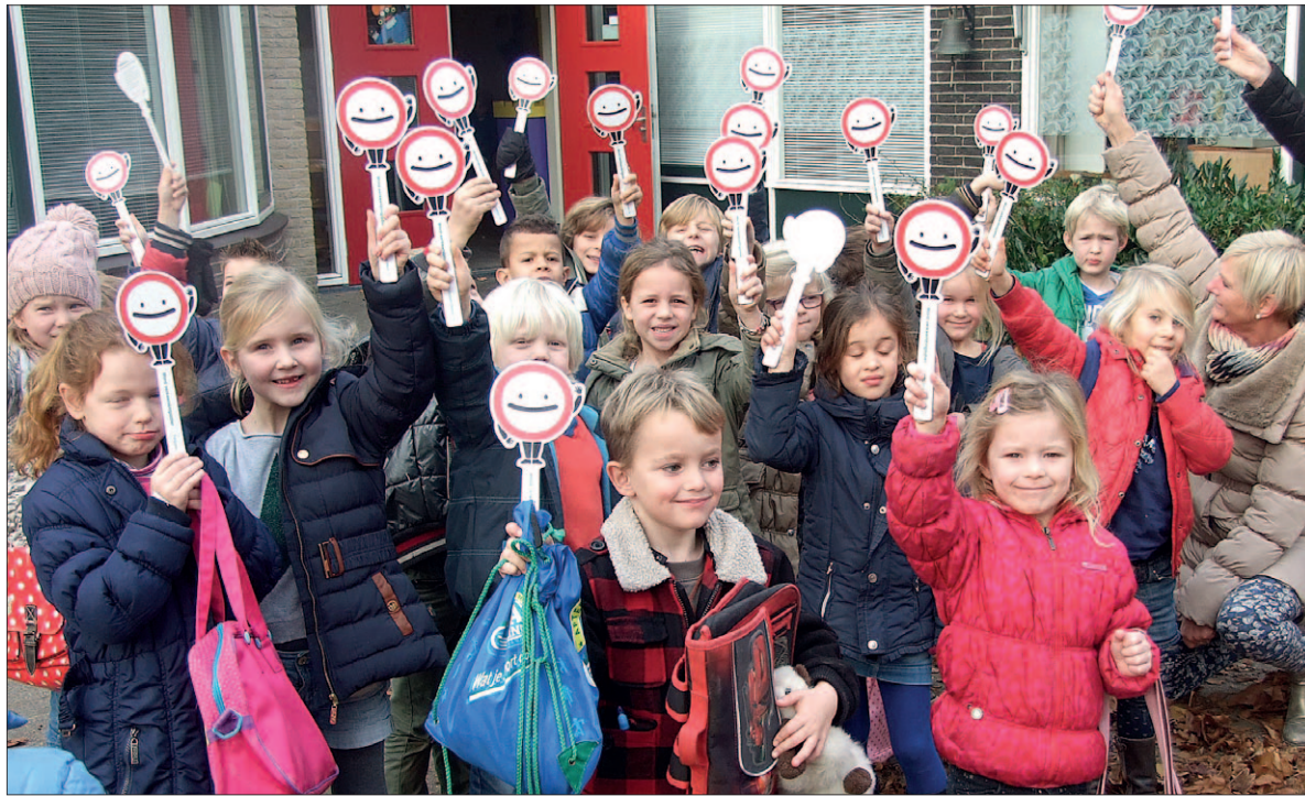
• Help ze oversteken. Zo luidt de slogan én noodoproep van Veilig Verkeer Nederland. Er zijn te weinig verkeersbrigadiers. De landelijke kick-off voor de wervingsactie was in Soest. Lees verder op pagina 3