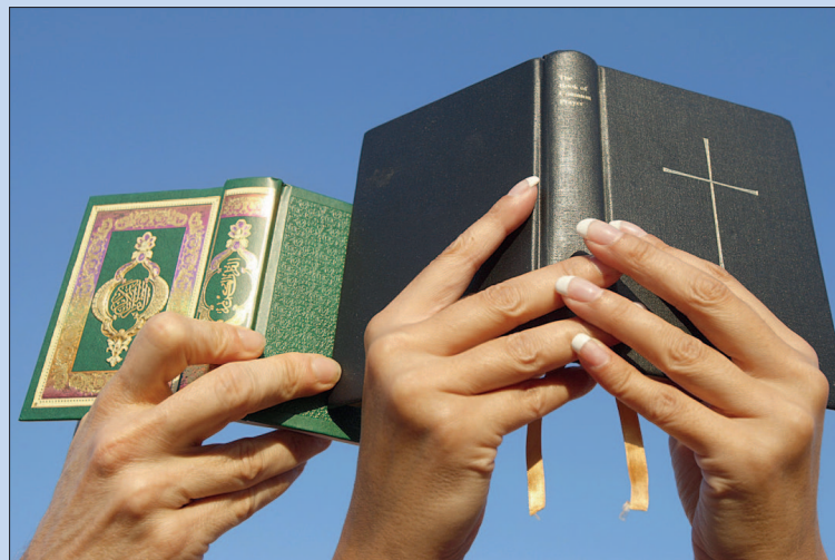
• Dinsdag: lezing over o.m. overeenkomsten tussen Bijbel en Koran.