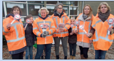
Het brigadierteam van De Werveling, op de foto incompleet, kan versterking gebruiken.

Bij sommige scholen zijn verkeersbrigadiers geen strikte noodzaak. De Van der Huchtschool aan de Libel bijvoorbeeld is gevestigd aan een woonerf en heeft geen drukke wegen in de buurt.