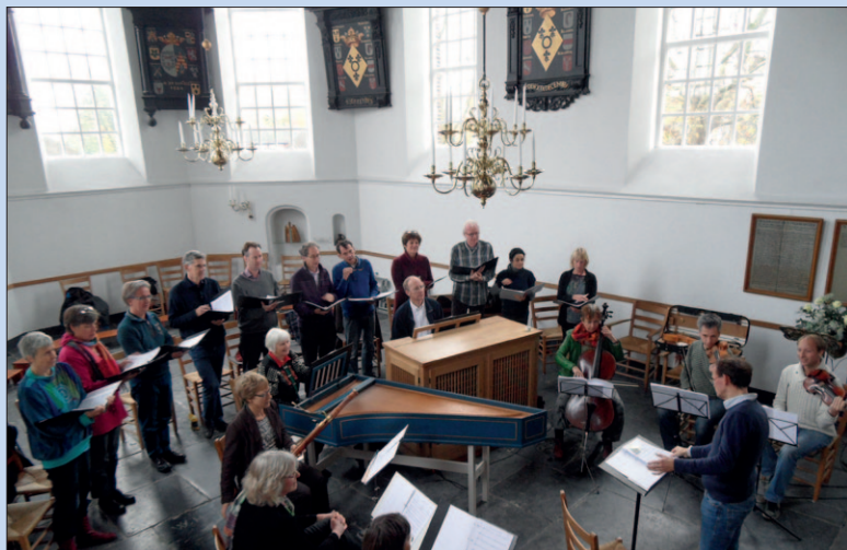
• Zondag: Concert Quintessens in De Oude Kerk.