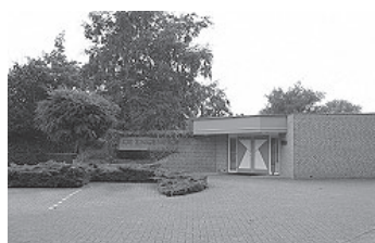
De Engenhof Alb. Cuyplaan