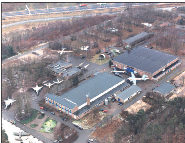
● Het voormalige Militaire Luchtvaart Museum is ontmanteld en heeft een nieuw onderkomen in het Nationaal Militair Museum dat nog dit jaar geopend wordt.

De focus ligt de komende jaren op het aantrekken van nieuwe inwoners, met name gezinnen en jongeren, voor de huizen die gebouwd gaan worden, en van ondernemers voor het bedrijventerrein Richelleweg en het nieuwe dorpshart. Daarbij behoort voor Soesterberg een nieuwe en herkenbare identiteit. De nota moet daar de aanzet toe geven.