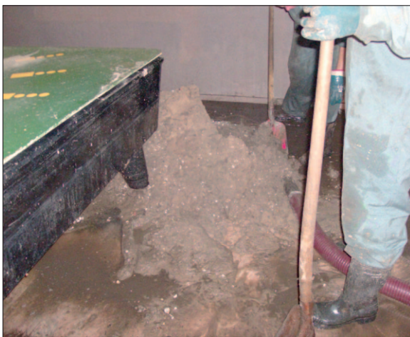
● Smurrie blijft over als het water is weggepompt.

Om alle modder en drek uit de kelder te verwijderen werd een bedrijf ingehuurd, dat beschikt over gespecialiseerde apparatuur en materieel. Nadat De Sleutel was 'drooggelegd' namen vrijwilligers het weer over. Een deel van het archief van de rooms-katholieke kerk is doorweekt. Verwacht wordt dat in elk geval een deel ervan zal moeten worden hersteld door een gespecialiseerd bedrijf.