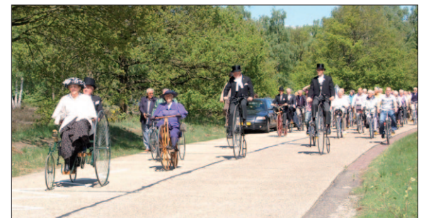
● Op 21 mei 2010 werd het voor het eerst sinds tientallen jaren weer mogelijk in rechte lijn over de vliegbasis te fietsen.

Dit staat in de met inbreng van partners in de regio gepresenteerde gemeentelijke nota 'Positionering Soesterberg' als leidraad voor de communicatie over en promotie van Soesterberg. De belofte van de gemeente moet voor de huidige inwoners en bedrijven uitstralen dat zij zich thuis blijven voelen in 'hun' Soesterberg. Nieuwe inwoners en bedrijven moeten zich aangetrokken voelen door de kwaliteiten van dorp en regio 'en de onbekende moet zich geprikkeld voelen om op onderzoek uit te gaan.'