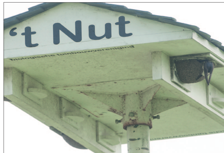
● Een huiszwaluwgezin heeft zijn intrek genomen in een van de vier nestkommen van de zwaluwtil aan de Jachthuislaan. Het is de eerste en enige bezette til in de provincie Utrecht.

De zwaluwtil aan de Jachthuislaan staat bij de biologische tuinbouwvereniging ‘t Nut. De til is hier twee jaar geleden geplaatst door IVN-