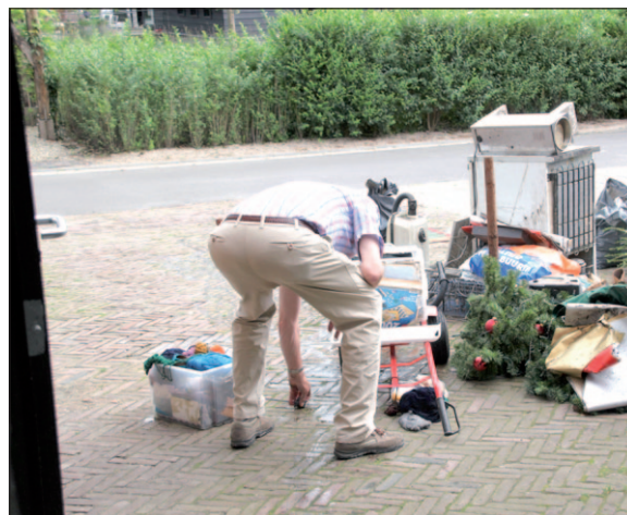
● Veel spullen afgevoerd.