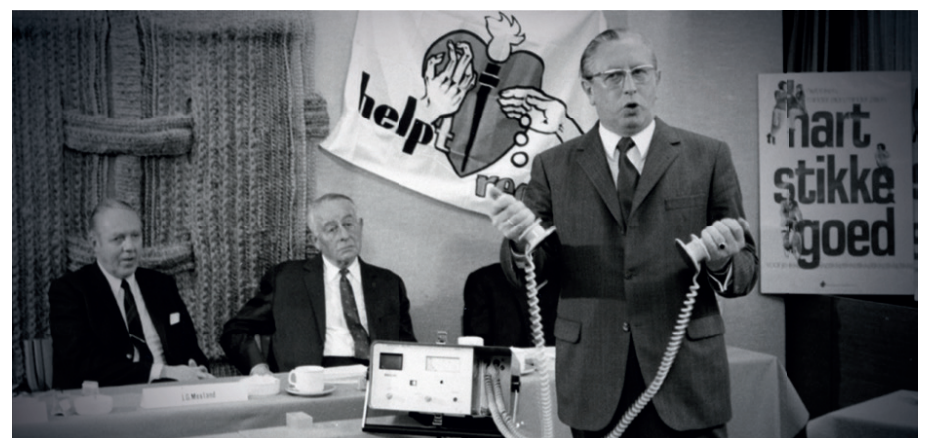
Voorjaar 1972, namens de Hartstichting worden elf defibrillators aangeboden aan de voetbalstadions met de grootste bezoekersaantallen.

De Hartstichting bestaat 50 jaar. Maar hoe succesvol we ook zijn geweest, we mogen niet op onze lauweren rusten. De urgentie van hart- en vaatziekten is namelijk onverminderd hoog: er zijn ruim één miljoen hart- en vaatpatiënten in Nederland. Elke dag overlijden er nog steeds 107 mensen aan. Bij vrouwen zijn hart- en vaatziekten doodsoorzaak nummer 1.