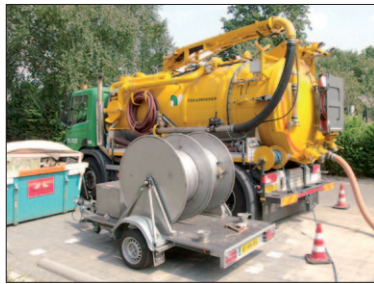
● Speciaal materieel moest worden ingehuurd om De Sleutel weer schoon te krijgen.

Bij Hulleman Optiek sijpelde het hemelwater, uitgerekend op de eerste vakantiedag, de vorig jaar vernieuwde en uitgebreide winkel in. Particulieren hadden er hun handen vol aan om ondergelopen kelders en ga-