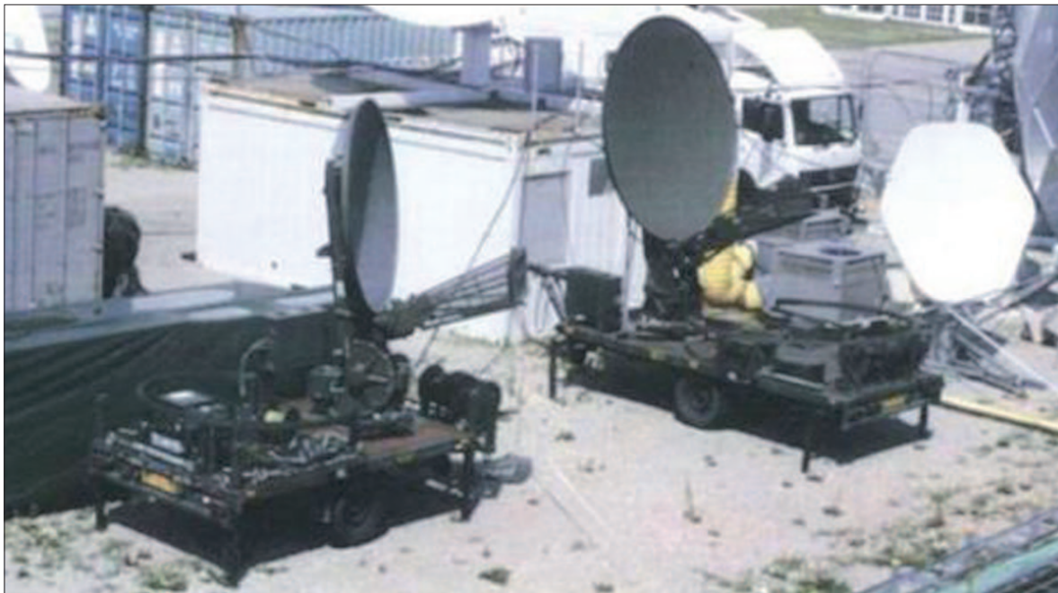
● De satellietantennes, vlak vóór de 'verdwijning' in juni: 3.000 kilo en 50.000 euro per stuk.

Een woordvoerder van het bedrijf dat eigenaar is van de schotels is verheugd dat ze terecht zijn. Hij laat in het midden wat er precies