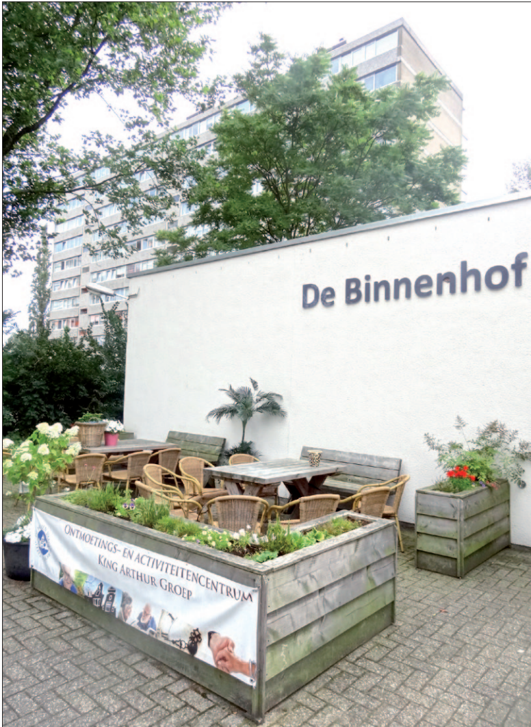
● Het terras van de King Arthur Groep is voor iedereen.

'Ik slaap met oordoppen in, zo ver dat gaat.' Een bewoner van de Veenbesstraat zegt al een jaar of twee vreselijke hinder te hebben van jongelui die 's avonds laat en 's nachts op en rond het terras bij De Open Hof hangen.