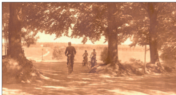
● Vroeger liepen er veel meer paadjes over het vliegveld waarvan men gebruik kon maken.

Het eigen karakter van Soesterberg wordt mede bepaald door het bijzondere en groene Park Vliegbasis Soesterberg en het Nationaal Militair Museum. De ligging van het dorp tegen dit gebied te midden van bijzondere natuur geeft een specifieke spanning en unieke sfeer die relaties oproept met vrede en veiligheid, maar ook met de spanning en geheimzinnigheid van de Koude Oorlog. Een karaktervol landschap dat beleefd moet worden.'