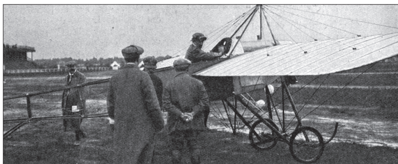
• Vertrek van Soesterberg van een deelnemer aan de Europese Rondvlucht in 1915.

In de militaire luchtvaartgeschiedenis neemt Soesterberg een bijzondere plaats in. Het is voor veel luchtvaartliefhebbers nog steeds onbegrijpelijk dat Soesterberg, nota bene de bakermat van de Nederlandse luchtvaart, als vliegbasis is opgeheven. Het toenmalige hoofd van de Sectie Luchtmacht-historie van de Koninklijke Luchtmacht, J. Jansen, liet er jaren geleden geen twijfel over bestaan: 'De vliegbasis Soesterberg moet gekoesterd worden. Ze heeft als bakermat van de Koninklijke Luchtmacht en in