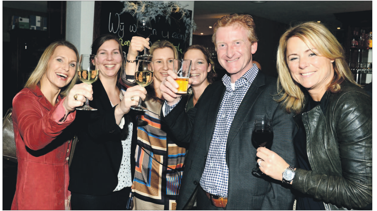
• Het glas heffen, elkaar het beste wensen, terugblikken op 2013 en vooruitkijken. Dat zijn doorgaans de ingrediënten van een nieuwjaarsreceptie zoals vorig jaar het geval was bij de Soester Zakenkring.

De VVD Soest organiseert een nieuwjaarsborrel voor leden en genodigden. Er zal aandacht zijn voor de gemeenteraadsverkiezingen in maart. De bijeenkomst begint om 16:30 uur en vindt plaats in restaurant De Soester Duinen.