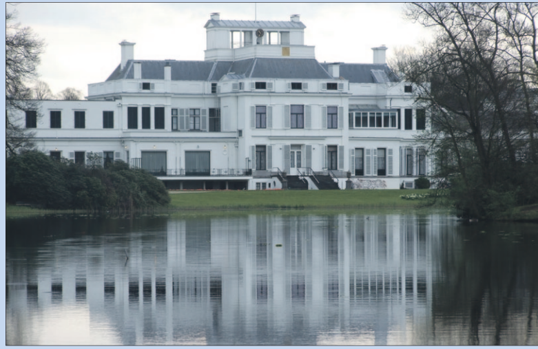
● Zaterdag: Prinsjes/prinsesjesweekend Paleis Soestdijk.