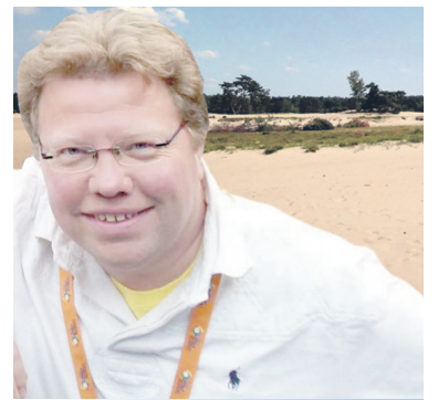
Achter de duinen

Op de laatste dag van het jaar kijk ik graag vooruit. Naar 2014. Dat doe ik met oog voor de wereld en hart voor Soest. Twee evenementen springen eruit. Het WK voetbal in Brazilië en de gemeenteraadsverkiezingen in maart. Sport en politiek lijken elkaar maar moeilijk te verdragen. Toch hebben ze meer met elkaar gemeen dan gedacht. Welke politieke partij zal het nu aandurven om de stekker uit één van de vier Soester voetbalclubs te trekken? Beide werelden staan bol van het opportunisme.