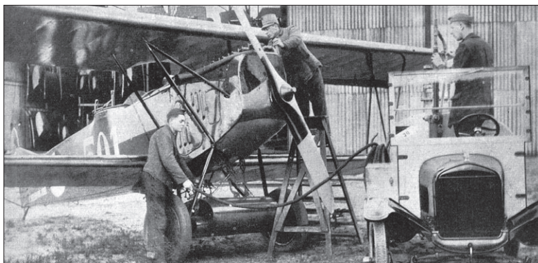
• Een oude opname op Soesterberg; werk aan de C 1 verkenners, bouwjaar 1919, in dienst van de militaire Luchtvaartafdeling (LVA).