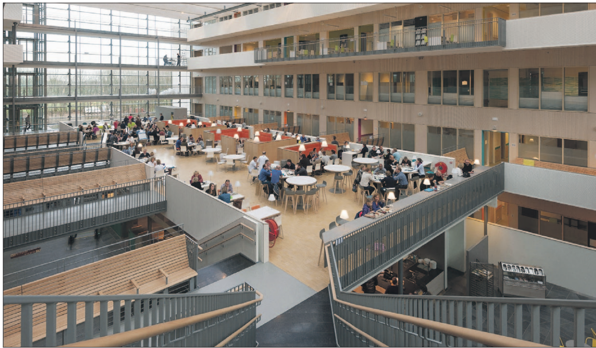
● De Brink met poliklinieken en restaurant van het nieuwe Meander Medisch Centrum in Amersfoort. De zaal zit vol bezoekers, werknemers en andere aanwezigen.

De patiënten zijn per ambulance overgebracht naar de nieuwe locatie. Meijers: 'Tijdens de verhuizing stonden het medisch welzijn, veiligheid en comfort van patiënten voorop. Er zijn 114 patiënten verhuisd vanaf de oude locatie Lichtenberg en 27 patiënten vanaf locatie Elisabeth. In het nieuwe Meander stonden me-