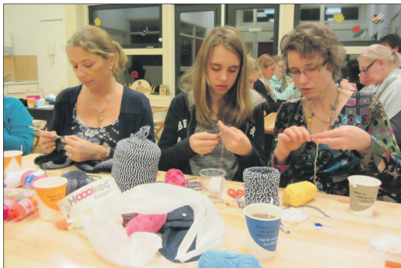
• Haken, zoals op de foto, is sinds kort een nieuw initiatief van de knutselclub Soesterberg.

Naast het knutselen organiseren de vrijwilligers, afwisselend met medewerking van de gemeente, het Dorpsbeheerteam, de IJs Vereniging Soesterberg, het Oranjefonds en Hypsos onder meer ook Burendag, een hoogtepunt, en een eindejaarsknutselbijeenkomst voor de vrijwilligers. Zij zijn verheugd dat na twee jaar kinderknutselen de vonk ook is overgeslagen naar de oudere jeugd en volwassenen om creatief bezig te zijn. Er zijn nu 199 (gezinnen) vrienden van de Facebook-pagina 'knutselen in Soesterberg.' Alle informatie verloopt via deze pagina en aan de bezoekersaantallen te zien is het een succes.