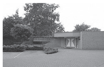
De Engenhof Alb. Cuyplaan

De "CHRISTELIJKE VERENIGING" Een betrouwbare partner in droeve dagen!