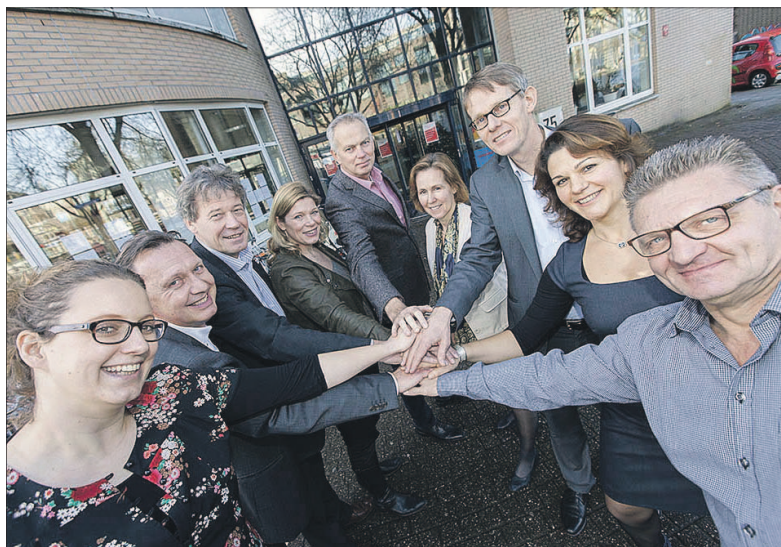
• Het 'Road Movie' team wil jonggehandicapten aan betaald werk helpen.

Daarna is het de bedoeling dat ReconnAct zorg draagt voor de werving en opleiding van vrijwillige Jobmaatjes die de jongeren individueel naar werk begeleiden. ReconnAct zorgt ook voor de verbinding tussen werkgevers in de regio Amersfoort, het Realisten Promoteam en het werkgeversservicepunt. Tot slot richten de organisaties zich op de begeleiding van de jonggehandicapten door een collega op het werk. Werkgevers die openstaan voor dit project en mensen die een Jobmaatje willen kunnen meer info vinden op www.reconnact.nl . Jonggehandicapten kunnen bellen met het UWV: tel. 033-4695656.