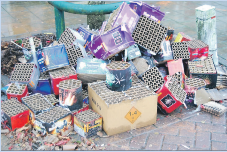
● Donderdag, vrijdag en zaterdag: Inzamelactie vuurwerkafval.