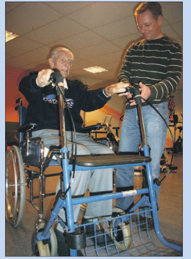
● Maandag: Rollatorspreekuur.