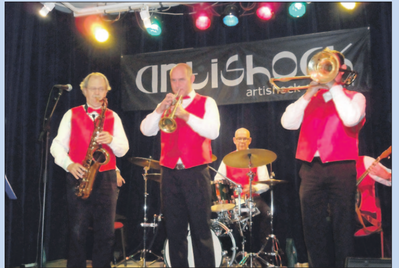
● Zondag: Optreden Hammerfield Stompers.