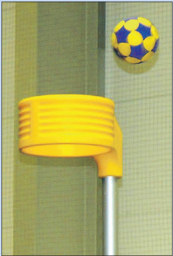
● Woensdag: Korfbaltraining.