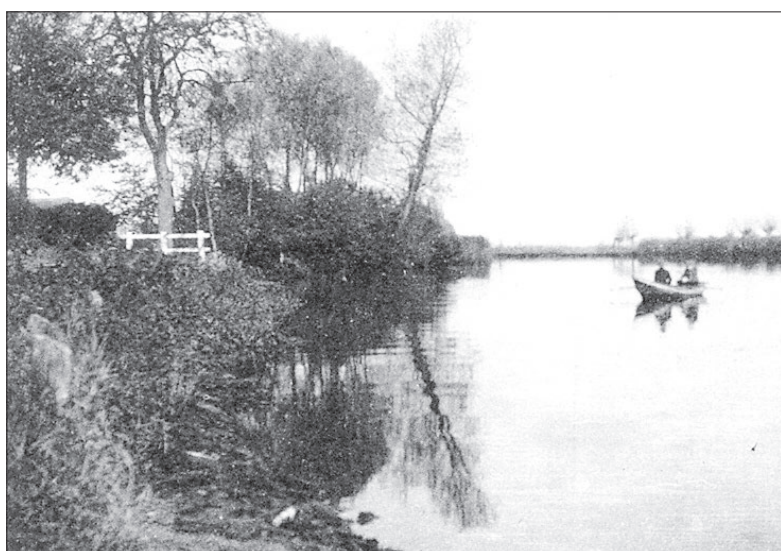
● Een roeibootje op de Eem, straks ook met vertrekpunt het Nieuwe Veerhuis?