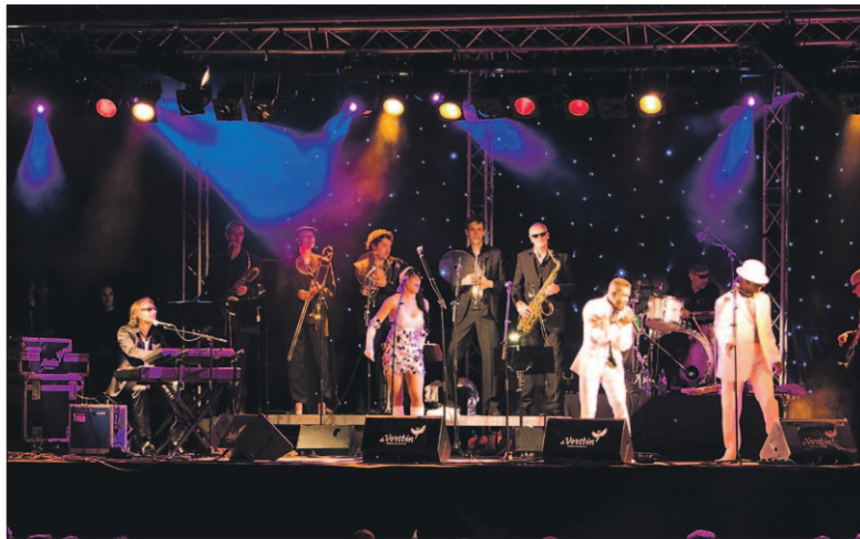
• Foto boven: Motownhead. Foto onder: Figurentheater Ennadien Blink.

Het jubileumfeest '75 jaar Cabrio' vindt zaterdag 31 augustus van 16:00 tot circa 23:00 uur plaats.