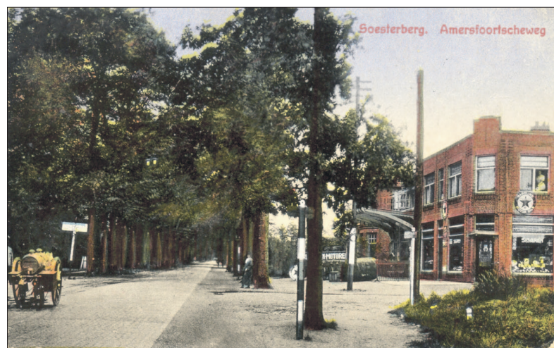
• Kaarsrecht liep de Wegh der Weegen tussen Utrecht en Amersfoort, hier in Soesterberg nog als Amersfoortseweg. Het gebouw rechts stond op de hoek van de Kampweg waar nu het monument De Vleugel staat.