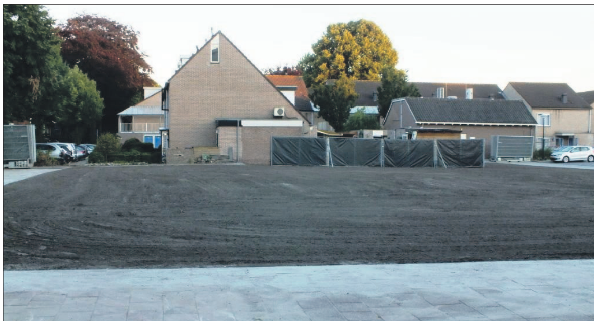
• Een kale vlakte herinnert aan de plek waar het dorps huis Burgstede aan het Dorpsplein in Soesterberg heeft gestaan.