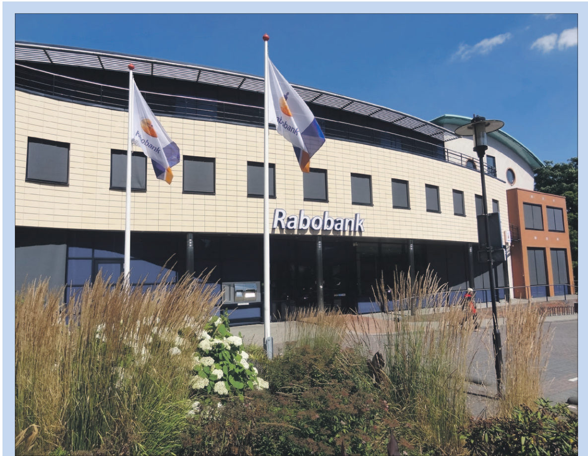
Het hoofdkantoor van Rabobank Soest Baarn Eemnes aan het Kerkplein. Eind dit jaar wordt het intern verbouwd. Op de begane grond komen extra spreekkamers en bij de balie voorzienin-

Kors: 'Wat we belangrijk vinden is dat we op lokaal niveau blijven acteren, zodat we niet een bank op afstand worden. We willen naar het model van een Community Bank. Ondanks dat je groter bent, blijf je nauw betrokken bij de lokale samenleving. Sponsoring, het Stimuleringsfonds, vrijwilligerswerk van onze medewerkers en de ondersteuning van vrijwilligersprojecten, die moeten zeker behouden blijven.'