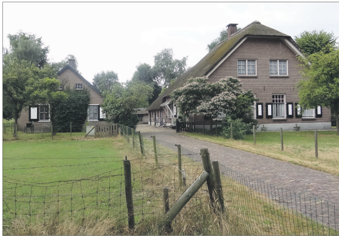
● De boerderij aan de Birkstraat 110 is sinds kort ook eigendom van De Paardenkamp.

De Prins Bernhardlaan is van 12 tot en met 23 augustus voor alle verkeer afgesloten. Het gaat om het gedeelte tussen de Van Weestedestraat en de Beatrixlaan. Dat krijgt dezelfde bestemming als de winkelstraat. Het betreft de laatste fase van de herinrichting van het winkelgebied, die op 14 september feestelijk wordt afgerond. Treinstation Soestdijk, en daarmee dus ook de Spoorstraat, blijven vanaf de andere kant bereikbaar.