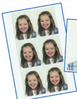
FOTO SWAGER UW VAKFOTOGRAAF IN PASFOTO'S