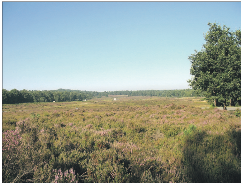
● Het militair terrein de Vlasakkers wordt zondag bezocht door de gidsen van IVN-Eemland en deelnemers.

Het gebied Vlasakkers staat bekend om haar eikenstrubbenbossen. Daarnaast is in het gebied ook de wilde kamperfoelie te vinden. Naast de eiken komen ook veel berken voor. Af en toe kunnen wandelaars ook een beuk, een tamme kastanje of een grove den tegen het lijf lopen. Dalkruid, bosbessenstruiken, hengel en vossenbes komen op het terrein voor. Niet alleen planten en bomen zijn te vinden in het gebied. Ook dieren komen er veelvuldig voor. Reeën, konijnen, vossen en de zandhagedis