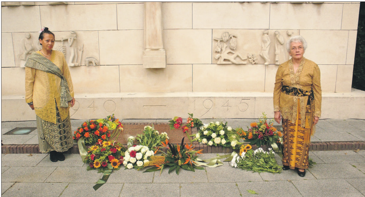
nument aan de Ir. Menkoloan. Bij het verzetsmonument is een gedenk-

In samenwerking met de Stichting Comité 4 en 5 mei Soest-Soesterberg organiseert de Vereniging Woongemeenschap van Ouderen 'Insulinde' jaarlijks de herdenking bij het mo-