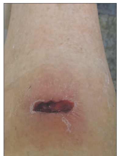
• De wond die een vrouw in haar onderbeen opliep nadat zij was gebeten door een hond.

Met mevrouw Haverkamp gaat het in ieder geval de goede kant op. Zij kan, als zij dat wenst, de eigenaar van de hond aansprakelijk stellen. 'En de dokterskosten op haar ver-