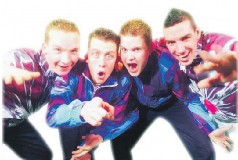
• De zaterdagavond: jaren '90 muziekfeest met o.a. Party Animals