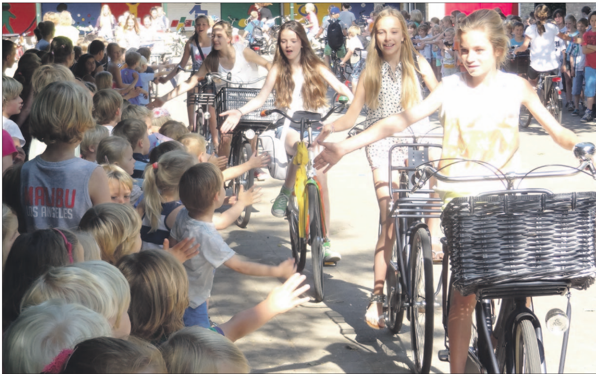
• Uitgezwaaid door hun jongere schoolgenoten fietsen leerlingen van groep 8 van De Werveling voor de laatste keer van het schoolplein aan de Oude Utrechtseweg af. Zomervakantie!