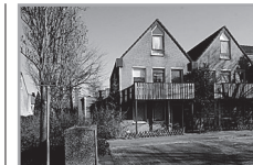
Energie label: C Klarinet 34

Reactienummer : 211329005 Wijk : Overhees Woningtype : Bovenwoning Aantal kamers : 3 Opp. woonkamer : 20m 2 Opp. sl. kamers : 8m 2 , 16m 2 Etage : 1e etage Beschikbaar per : woensdag 14 augustus 2013 ov