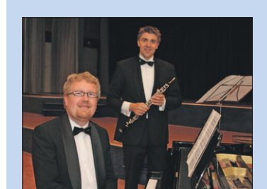
● Zondag: Bach in Oude Kerk.

14:00 Sportactiviteiten voor kinderen 6-11 jaar door Sport Event Soest, evenemententerrein De Eng.