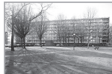
Energie label: D Varenstraat 338

Reactienummer : 211329004 Wijk : Smitsveen Woningtype : Flat met lift Aantal kamers : 4 Opp. woonkamer : 26m 2 Opp. sl. kamers : 12m 2 , 9m 2 , 6m 2 Etage : 4e etage Beschikbaar per : donderdag 15 augustus 2013 ov