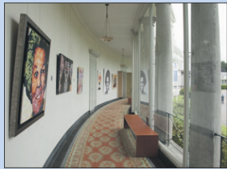
Beeld van Beatrix in de ‘Soester’ vleugel van Soestdijk.