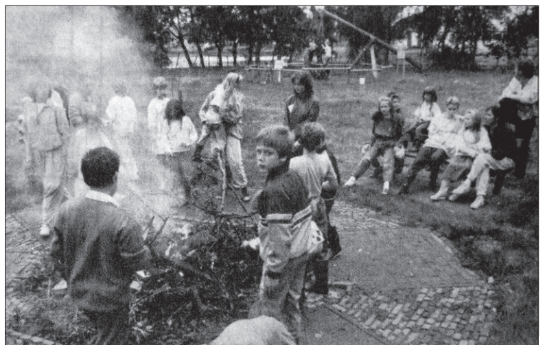
● Een zeskamp, knutselen, een kampvuur, schminken, spelletjes en natuurlijk de Bonte Avond. Op kinderboerderij De Vrije Teugel is het eerste zomerkamp van start gegaan. Van maandag tot en met zaterdag verblijven de kinderen van 4 tot en met 12 jaar op het terrein aan het Vedelaarpad. Ze slapen in tenten. Begin augustus is het tweede zomerkamp, daarna is er een kampweek voor jongeren uit allerlei landen. Zij zullen helpen de nieuwe afrastering van De Vrije Teugel te plaatsen en gaan ook andere werkzaamheden uitvoeren.

(Uit de Soester Courant van 20 juli 1988)