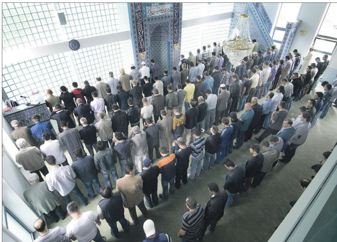
● Vrijdagmiddaggebed in de nieuwe Fatih-moskee op de hoek van de Koningsweg en de Vrijheidsweg.

Er werd een werkgroep samengesteld, bestaande uit belanghebbenden. Daarnaast richtten buurtbewoners het Comité Groenstrook Moet