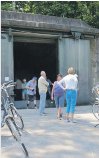
● Op de fiets kennismaken met de rol van de vliegbasis tijdens de Tweede Wereldoorlog en de Koude Oorlog.

Op de fiets langs historische objecten of over militair erfgoed. Het kan zaterdag 20 juli op de voormalige vliegbasis. Het Utrechts Landschap heeft twee fietsexcursies georganiseerd. Om 12:00 uur gaat een rit van start langs historische objecten en kunstinstallaties waarvan de makers zich lieten inspireren door de Koude Oorlog. Ze hebben ook een relatie tot het gebruik van de vliegbasis. Wie wil meefietsen kan zich tussen 11:30 en 12:00 uur melden bij de ingang aan de Batenburgweg in Soesterberg. Daarna gaat het toegang dicht. Om 13:30 uur is er zaterdag nog een excursie. Die wordt voorafgegaan door een inleiding in het informatiecentrum van Hart van de Heuvelrug. Daarna fietsen de deelnemers over de start- en landingsbaan en langs onder meer shelters, bunkers, het voormalige munitiepark en een kerosineopslagplaats. Het Utrechts Landschap laat de fietsers zo kennismaken met de rol van de basis tijdens de Tweede Wereldoorlog en de Koude Oorlog. Wie deze fietsexcursie wil meemaken, kan zich tussen 13:00 en 13:30 uur melden bij het toegangshek aan de Batenburgweg. Beide excursies nemen ongeveer twee uur in beslag. De organisatie verzoekt belangstellenden zich aan te melden via de website www.utrechtslandschap.nl/reserveren