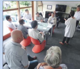
• Uitleg in de woonkamer.

► De ruimten die warmte nodig hebben, worden voorzien van grote, isolerende ramen en gericht op het zuiden.