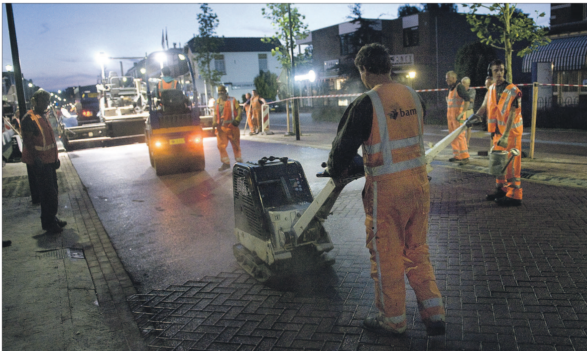
• Het was de afgelopen twee dagen nachtwerk in de Van Weestraat. Ook komende nacht rijden er asfalteringswagens en freemachines door de straat. Vrijdag is alles weer 'normaal'. Op enkele afrondende werkzaamheden, in de loop van augustus, na. De tijdelijke verkeersmaatregelen zijn vanaf 19 juli passé.