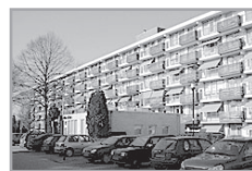
Dorpsplein 54 ★★

Reactienummer : 211327011 Wijk : Soesterberg Woningtype : Seniorenflat met lift Aantal kamers : 2 Opp. woonkamer : 25 m 2 Opp. sl. kamers : 12 m 2 Etage : 2e etage Beschikbaar per : donderdag 1 augustus 2013