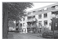
Burg. Grothestr. 82-316 ★★

Reactienummer : 211327012 Wijk : Soestdijk Woningtype : Seniorenflat met lift Aantal kamers : 2 Opp. woonkamer : 26 m 2 Opp. sl. kamers : 12 m 2 Etage : 3e etage Beschikbaar per : donderdag 1 augustus 2013