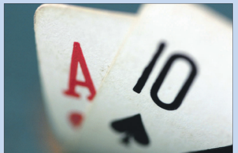
● Donderdag en maandag: gratis zomerbridge voor paren.