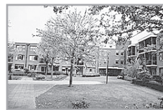
Energie label: D Klarinet 259 ★★

Reactienummer : 211327007 Wijk : Overhees Woningtype : Seniorenflat met lift Aantal kamers : 2 Opp. woonkamer : 27 m 2 Opp. sl. kamers : 11 m 2 Etage : 1e etage Beschikbaar per : donderdag 1 augustus 2013 ov