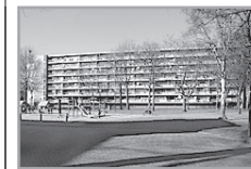
Energie label: E Smitsweg 101

Reactienummer : 211327013 Wijk : Smitsveen Woningtype : Flat met lift Aantal kamers : 4 Opp. woonkamer : 26 m 2 Opp. sl. kamers : 12 m 2 , 9 m 2 , 6 m 2 Etage : 4e etage Beschikbaar per : vrijdag 2 augustus 2013