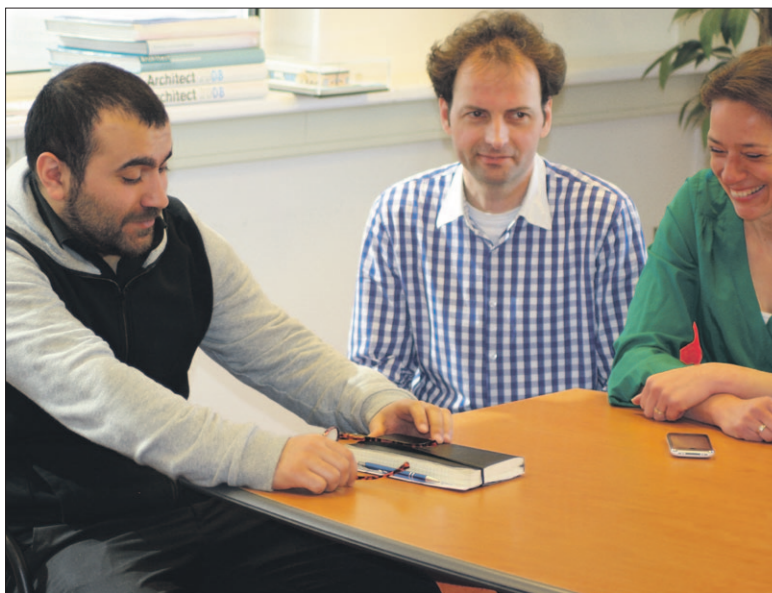
● De Soester Maatjes helpen mensen op verschillende terreinen zoals op het gebied van sport of het opzetten van een eigen onderneming.

Een ZZP-maatje heeft ervaring als (ex-) ondernemer en weet, speciaal voor ZZP'ers, een antwoord op veel gestelde vragen, tools en praktische informatie en een netwerk opbouwen. Mensen die het leuk vinden om af en toe bij een al-