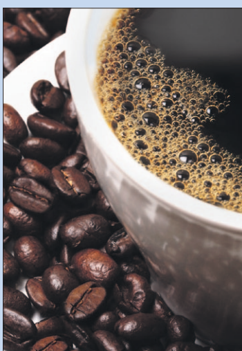
● Donderdag: Koffie in De Plantage.