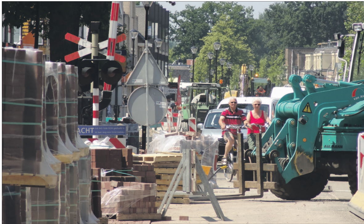
De laatste loodjes wegen het zwaarst. Dat geldt ook in de Van Weedestraat. De herinrichting nadert de voltooiing, maar er moet de komende week nog veel werk worden verzet. Lees verder op pagina 3.