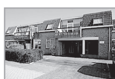
Energie label: D Boekweitland 99 ★★

Reactienummer : 211327010 Wijk : De Engh Woningtype : Seniorenflat met lift Aantal kamers : 2 Opp. woonkamer : 25 m 2 Opp. sl. kamers : 13 m 2 Etage : 1e etage Beschikbaar per : dinsdag 16 juli 2013 ov