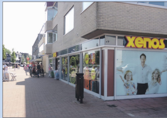
Burgemeester Grothestraat: Xenos.