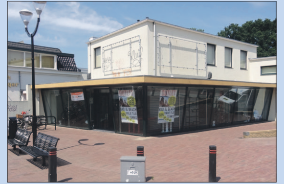
Van Weede-straat: voormalig Van Dam Sports.