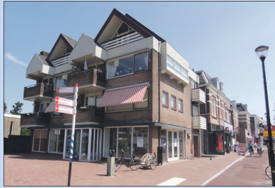
Van Weede-straat: voormalig reisbureau Gerth.

Het ging om de voormalige locatie van Van Dam Sports (hoek van de Van Weede-straat en de Stadhouderslaan), het tegenoverliggende pand waarin voorheen Reisbureau Gerth was gevestigd, het huidige Xenos-