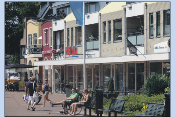
Burg. Grothestraat: gevels dicht op rijbaan.

pand (hoek van de Burgemeester Grothestraat-Anna Paulownalaan) en de gevelrij van Hulleman Optiek t/m Bob's Bloemen. Die zou mogen worden uitgebreid in de richting van de rijbaan. GGS vindt dat te ver gaan. Op de plek van Xenos vrees GGS zelfs voor een 'torenflat',