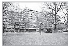
Energie label: B W. Beckmanstraat 215 ★★

Reactienummer : 211327005 Wijk : Klarwater Woningtype : Seniorenflat met lift Aantal kamers : 2 Opp. woonkamer : 25 m 2 Opp. sl. kamers : 17 m 2 Etage : 3e etage Beschikbaar per : donderdag 1 augustus 2013 ov