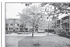
Energie label: D Klarinet 287 ★★

Reactienummer : 211327008 Wijk : Overhees Woningtype : Seniorenflat met lift Aantal kamers : 2 Opp. woonkamer : 27 m 2 Opp. sl. kamers : 11 m 2 Etage : 1e etage Beschikbaar per : donderdag 1 augustus 2013 ov