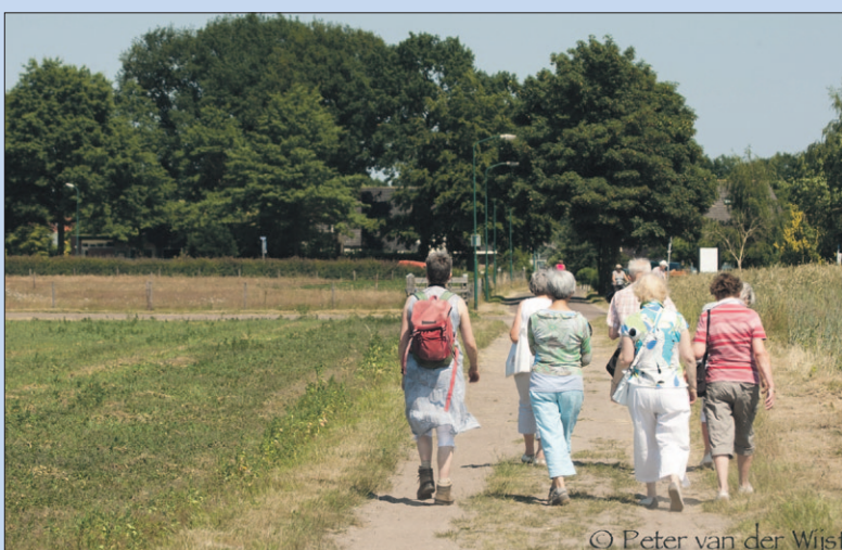
● Zondag: Wandeling IVN Eemland.