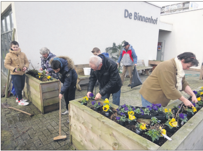
● Middelbare scholieren en andere vrijwilligers knappen eendrachtig het terras bij de King Arthur Groep op.

Opknappen is op veel locaties het overwoord. Bij diverse scoutingclubs, maar ook bij scholen en andere instellingen gebeurt er van alles. Bij De Fakkeldraagsters bijvoorbeeld wordt het clubgebouw geïsoleerd. Mulder is onder de indruk. 'Vrijwilligers zijn sowieso altijd al in de weer. NLdoet is kennelijk een extra stimulans om nog eens extra werk te verrichten. Er is zoveel meer gebeurd dan ik had verwacht.'