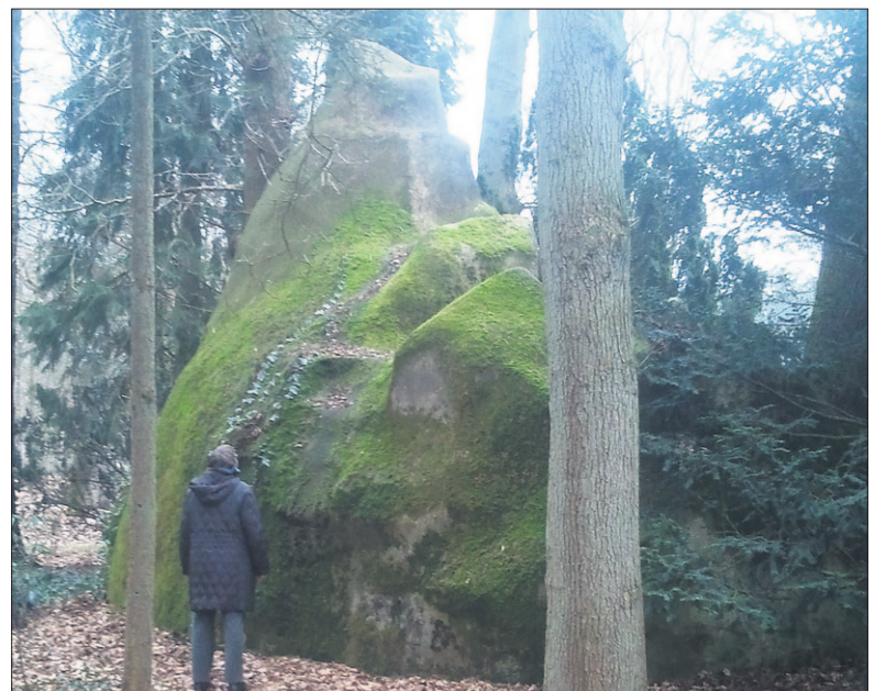
• Door de bezoeker van de Lourdesgrot krijgt men een indruk van de omvang van het bouwwerk.

De werkgroep wil de oude situatie terugbrengen, want 'er zijn in het verleden in en rond Soesterberg helaas veel zaken verdwenen die getuigen van de geschiedenis van het dorp en die behoorden tot het cultureel erfgoed van de dorpsgemeenschap.'