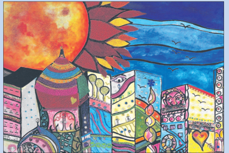
● Zaterdag en Zondag: Kunstlint in de Lente.