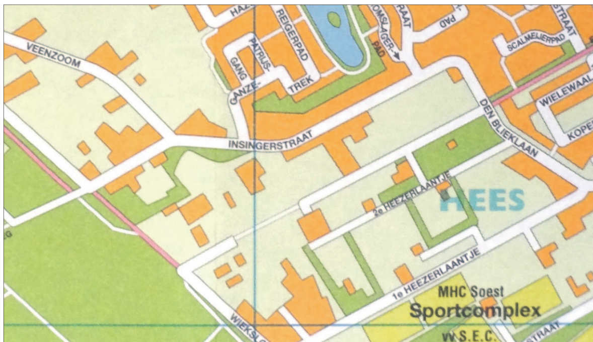
• Het gebied tussen de Insingerstraat en het 2e Heeserlaantje is in de picture voor woningbouwplannen.

dat woningbouw niet mogelijk was. 'We zijn nieuwsgierig naar de toelichting van de wethouder en zijn altijd bereid mee te denken over mogelijkheden. Over haalbaarheid kunnen we echt nog niets zeggen. Daarvoor moeten we eerst meer details weten,' aldus de woordvoerder. Het bestemmingsplan Landelijk Gebied wordt in december van dit jaar vastgesteld. Witte verwacht niet dat eventuele afspraken over het benoemde terrein dan al zijn afgerond.