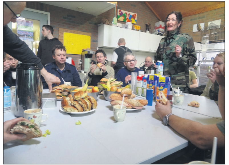
● Voor de meeste vrijwilligers wordt ook goed gezorgd. Soep en broodjes staan klaar voor de stafofficieren die de vijver van Vogelopvang Soest uitbaggeren.