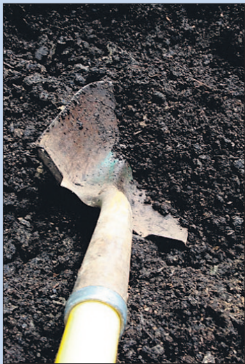
● Zaterdag: Compost scheppen.