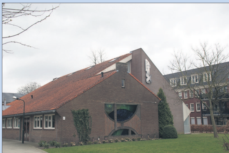
● Maandag, dinsdag en woensdag: Vesperavonden in de Schuilplaats.