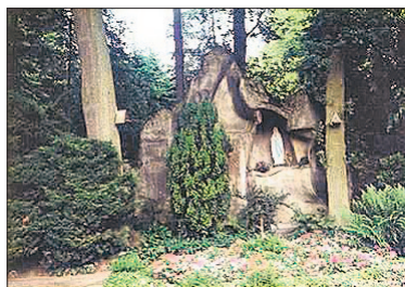
• Vooraanzicht van de Lourdesgrot met daarin nog het later gestolen Mariabeeld.

de vergunning op 11 maart hebben afgegeven, precies een week na het verzoek van de Historische Vereniging tot behoud van de grot. 'Voor de beoordeling van deze aanvraag is uitsluitend van belang of het beschermde dorpsgezicht door het verwijderen van het bouwwerk wordt aangetast. In de omschrijving van het beschermde dorpsgezicht worden enige architectuurhistorische waardevolle delen van het Cenakel en het Kontakt der Kontinenten en een aantal lanenstelsels van de oude buitenplaats genoemd, maar niet de Lourdesgrot. De opvatting dat de grot een essentieel onderdeel uitmaakt van het dorpsgezicht kunnen b. en w., mede gelet op het bouwjaar (1959), niet volgen. In het advies