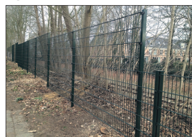
● Bewoners van de Jac. van Looylaan hebben het gevoel in de bajes te zitten dankzij het hekwerk, geplaatst door ProRail.

'Er is ons beloofd dat het groene karakter van de straat behouden zou blijven. Wij pleiten er bij de gemeente dan ook voor dat zij ons als bewo-