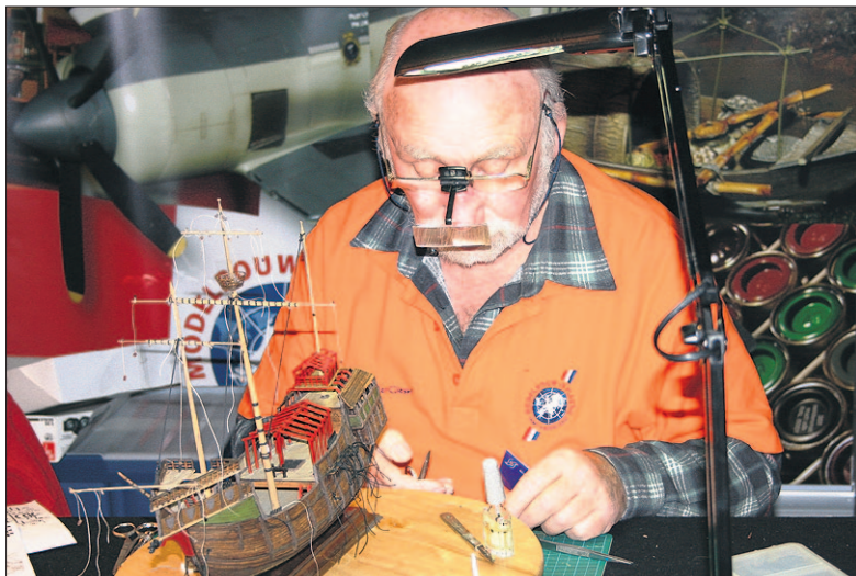
● Modelbouwen is een serieuze bezigheid die van jong en oud veel geduld vereist.

Voor de kleine 'ingenieurs' is Lego aanwezig, waarmee ze de mooiste modellen kunnen bouwen. Tijdens de Nationale Modelbouwmanifestatie is het gehele museum geopend en zijn ook de F-16- en zweefvliegtuigsimulator operationeel. Openingstijden Militaire Luchtvaart Museum tijdens de Nationale Modelbouw Manifestatie 2013 zijn op zondag 28 april van 12:00 uur tot 16:30 uur; maandag 29 april van 10:00 tot 16:30 uur, en woensdag 1 mei tot en met vrijdag 3 mei van 10:00 tot en met 16:30 uur.