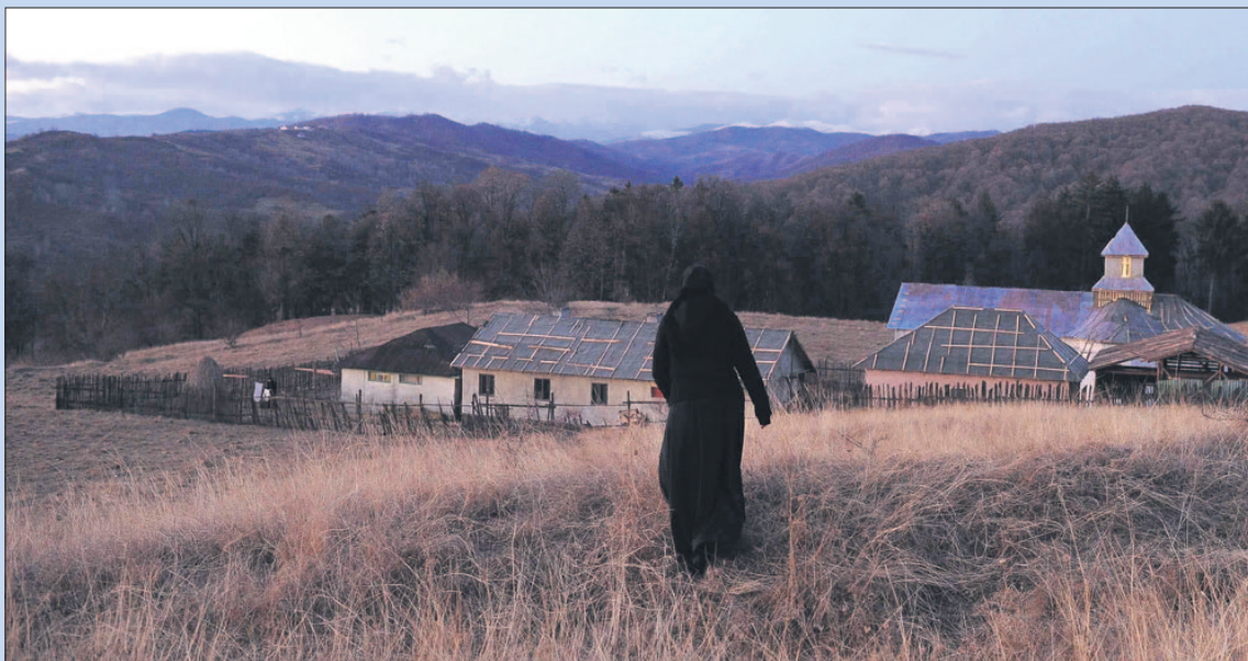
● Maandag en woensdag: Film 'Beyond the hills' in Artishock.

re Activiteiten Soest ontmoet auteur Thomas Rosenboom, Theater Idea, Willaertstraat 49, € 10,00/7,50.