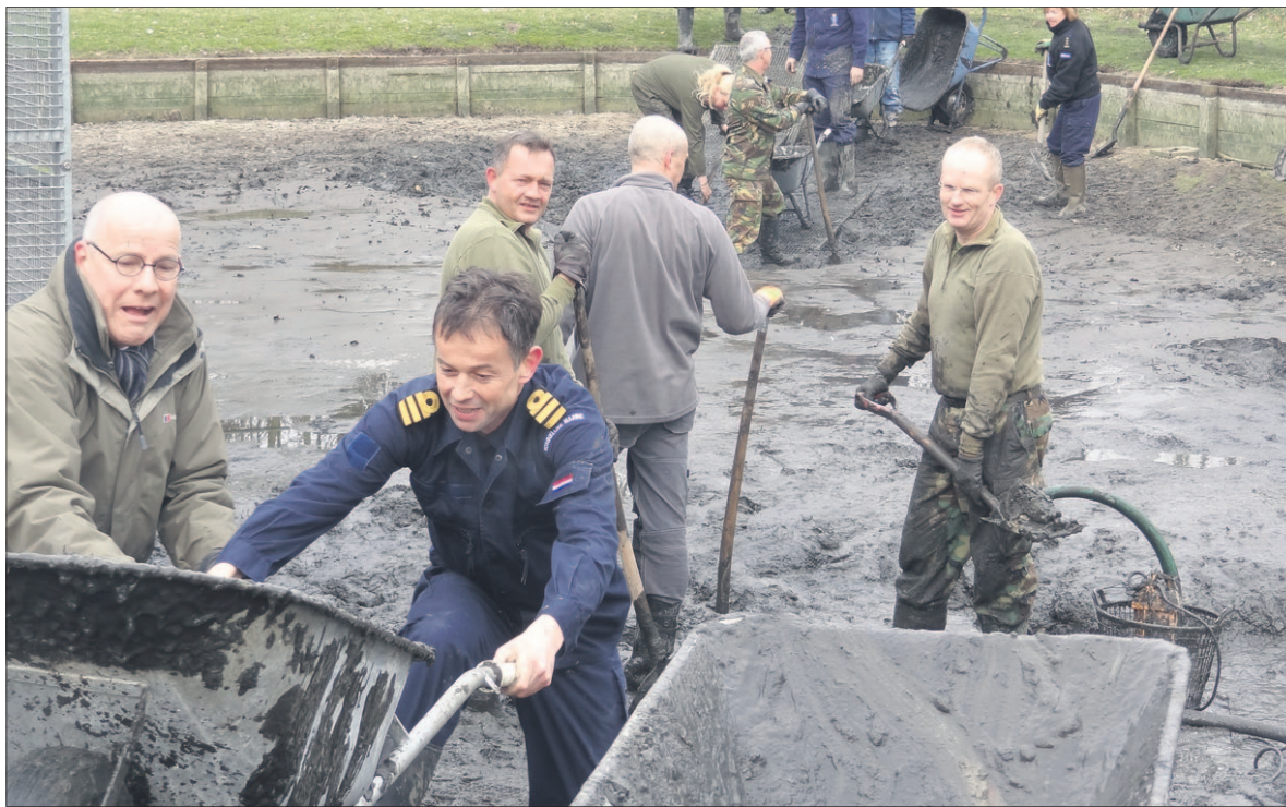
● Ongeveer 350 mensen staken vrijdag of zaterdag de handen uit de mouwen. In het kader van NLdoet deden ze dienst als vrijwilliger. Zoals deze stafofficieren die de vijver van Vogelopvang Soest uitbaggerden. Lees verder op pagina 5.