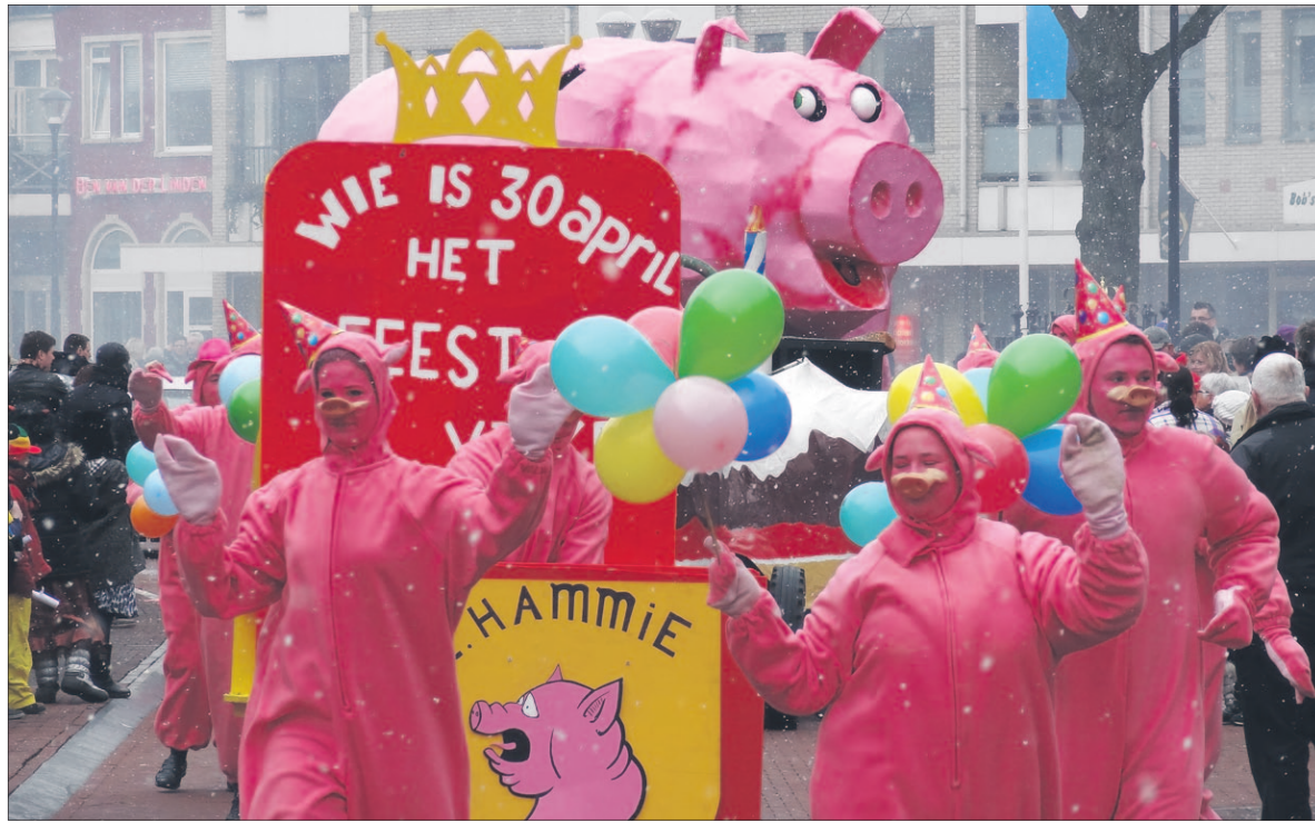
● Feestvarkens trokken zaterdag door de straten van Soest. De carnavalsoptocht slingerde zich tussen een serie van feestavonden door. Op deze foto CC Hammie. Op pagina 10 nog veel meer foto's.