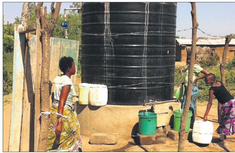
● Eén van de waterputten waar inwoners van het dorpje Mtakuja naartoe moeten om water te halen.

De Rotaryclub zal binnenkort weer diverse activiteiten houden om geld in te zamelen voor het project. Zo is er onder andere nog een extra waterpomp nodig.