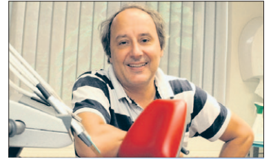
Spoelt u maar

selijk niveau gaan spelen. Volgens Soest2002 heerst er onder zorgaanbieders onrust en maken ze zich ernstig zorgen over de toekomst. Marianne Krom stelt dat haar fractie zich ook ernstig zorgen maakt over de opvang van deze kwetsbare groep en spoort het college aan om, zo dat niet al is gebeurd, te beginnen met het overleg. Soest2002 wil dat er snel een plan van aanpak op tafel ligt.