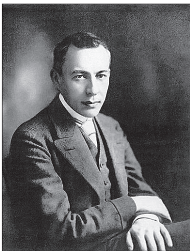
bracht op het Russische platteland, op het landgoed Ivanovka. Bijna al