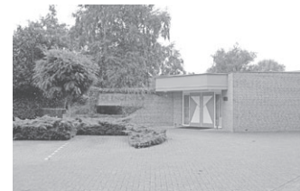
De Engenhof Alb. Cuyplaan