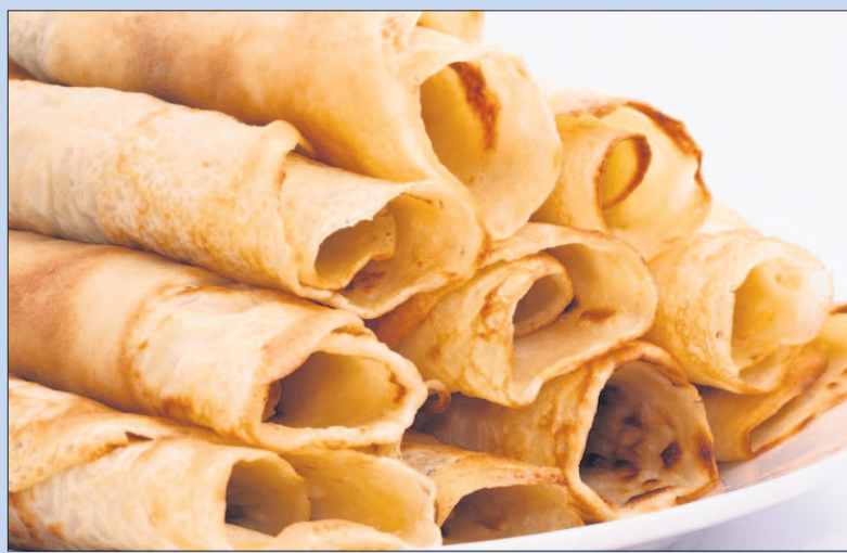
● Vrijdag: pannenkoekeninloop bij de SWOS.