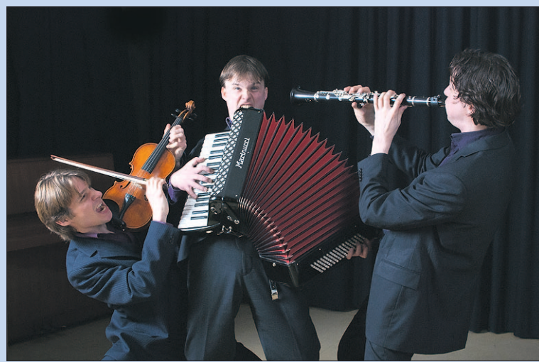
● Zondag: Optreden band Trio C tot de Derde in Artishock.