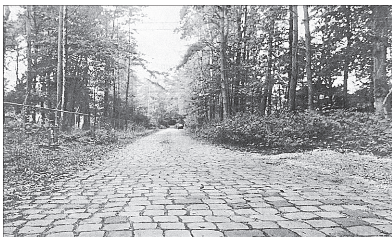
● De 'kinderhoofdjes' van het Heezerspoor, een stukje 'hel van het noorden' in Soestduinen.

Het gebruik van de route door tanks is inmiddels verleden tijd. Als gevolg van de reorganisatie bij defensie zal de Cavallerieschool op de Bernhardkazerne nog dit jaar na een zestigjarig bestaan worden opgeheven. Alle tanks zijn immers door het kabinet wegbezuinigd. Daarmee heeft het Heezerspoor z'n oorspronkelijke functie verloren. Het bijzondere kasseienwegdek herinnert echter nog steeds aan die periode die ongeveer tot de zestiger jaren duurde. Sindsdien is het Heezerspoor bij de fietsers die er frequent gebruik van maken bekend als 'de hel van het noorden', verwijzend naar de wieslklassieker Parijs-Roubaix met talrijke kasseienwegen. Alleen al daarom moet dit stukje geschiedenis koste wat kost in stand worden gehouden. Al zou het alleen maar zijn om fietsers die de route voor het eerst gereden hebben de vraag te kunnen stellen.