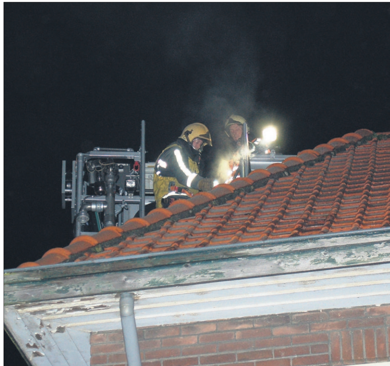
• De brandweer moest twee keer in een korte tijd uitrukken voor een schoorsteenbrand. Eerder betrof het een woning aan de Beatrixlaan. Vorige week ging het om een pand aan de Laanstraat.

tankautospuit en de hoogwerker en begon met het zoeken van de warmtebron door het gebruik van de warmtebeeldcamera. Omdat de Laanstraat door de hoogwerker werd geblokkeerd, werd het gedeelte tussen het Weteringpad en de Albert Hahnweg afgesloten. De brandweer maakte het schoorsteenkanaal schoon, een flinke klus door de aanslag die het stoken in de allesbrander had veroorzaakt. Na bijna twee uur was de klus geklaard.