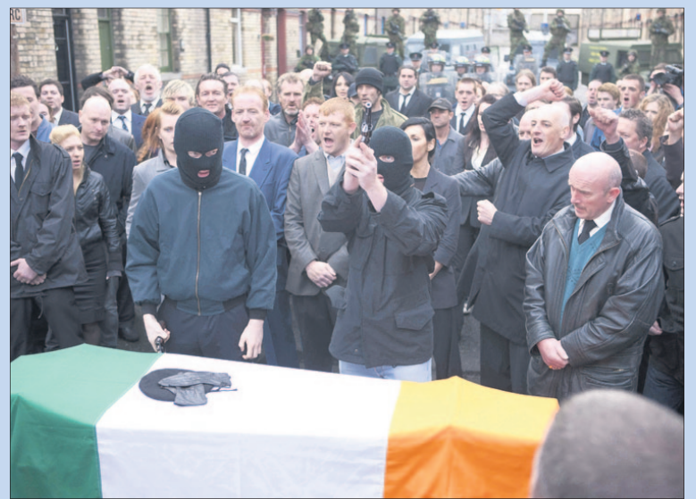
● Maan- en woensdag: Film 'Shadow dancer' in Filmhuis Artishock.