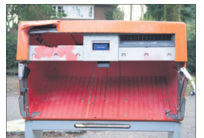
● Een brievenbus werd op oudjaarsdag opgeblazen.

woners namen hierover ook contact op met deze krant. 'De buurt is erg geschokken. Het gaf echt een gigantische knal. Een terreurdaad. Om zo'n brievenbus op te blazen is er echt een bom nodig,' weten ze te vertellen. Bij de gemeente is nog niet bekend hoe groot de schade aan het straatmeubilair dit jaar is. 'We zijn op dit moment nog aan het inventariseren. De serviceteams bekijken waar en welke vernielingen er zijn aangericht. De jaarwisseling in Soest lijkt vooralsnog rustig te zijn verlopen, maar we kunnen meer zeggen als we de schadecijfers hebben,' laat een woordvoerder van de gemeente Soest weten. Wanneer de gemeente Soest de cij-