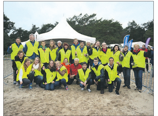
• Ook de Soester fotograaf Jaap van den Broek was op oudejaarsdag aanwezig om foto's te maken van het evenement.