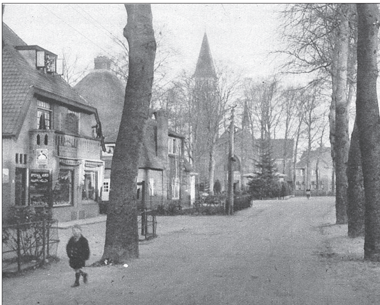
● In 1928 vond het gemeentebestuur dat er een teveel aan winkels was in Soest, ook aan de Koninginnelaan.

particulieren autobusdienst Utrecht-Amersfoort via Soesterberg, waarvan de onderneming te Soesterberg is gevestigd. In den loop van 1928 is door de gemeente een wegenplan ontworpen, hetwelk in 1929 is tot stand gekomen en spoedig een begin van uitvoering zal verkrijgen, terwijl aan verbetering van wegen steeds aandacht wordt geschonken.' Niet alleen de gemeente, ook de middenstand had het moeilijk. 'Veel nieuwe zaken werden wederom in 1928 opgericht. Het te veel aan winkels doet zich in iedere branche duchtig gevoelen. Voor oude bestaande is het moeilijk hun omzetcijfers van voorheen op peil te houden, laat staan te verbeteren.' Wat de vestiging van industrie betreft, daarvan was in Soest pas in de jaren dertig voor het eerst sprake.