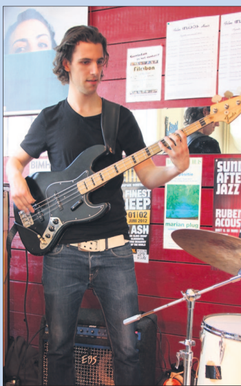
● Zaterdag: JAzzClub.