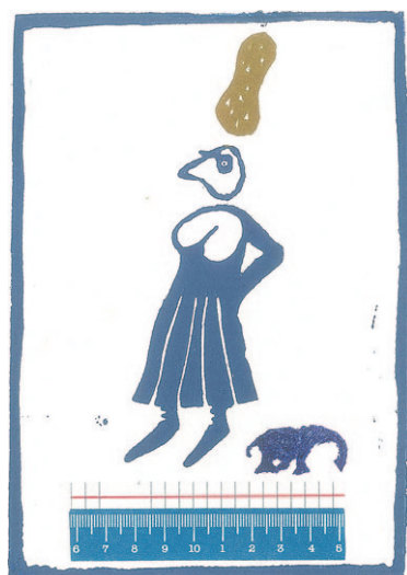
• Werk van Tamar Rubinstein.

Te zien zijn etsen, gravures, druk-sels, litho's, houtsneden en lino's, maar ook andere werken in oplage zoals keramiek, foto's, sieraden en kleinplastiek.