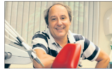
Spoelt u maar

In Smitsveen maakten ze er gisteren een gezellige boel van. Met wafels, een vuurkorf en andere lekkernijen. Een aantal kinderen uit de wijk was erg enthousiast en leverde ruim twintig vuilniszakken met vuurwerk in.