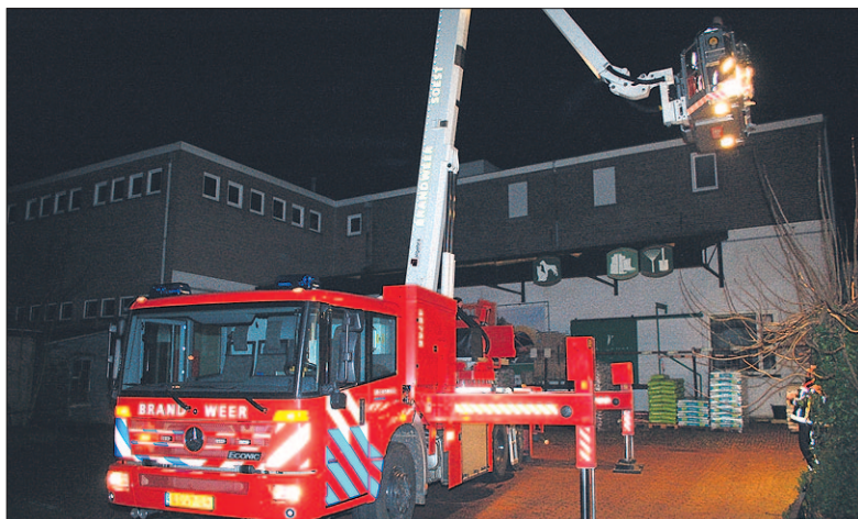
• Politie en brandweer zochten naar een mogelijke inbreker op het dak van de Welkoop.

in de directe omgeving werd gezocht. Dit leverde evenmin resultaat op. Even later kwam er een melding dat er een verdachte situatie was in achtertuinen van de huizen aan de Olijkeweg. De politie verplaatste de zoekactie daarheen, maar ook daar werd niemand aangetroffen. Na drie kwartier werd de zoekactie zonder resultaat afgesloten.