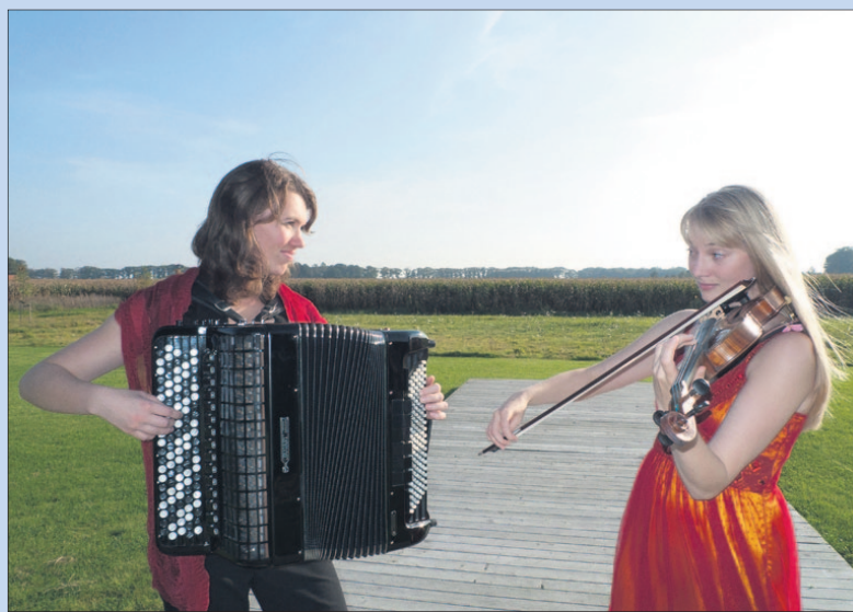
● Zondag: Ensemble De Thuiskomst in de Molenaarskamer.