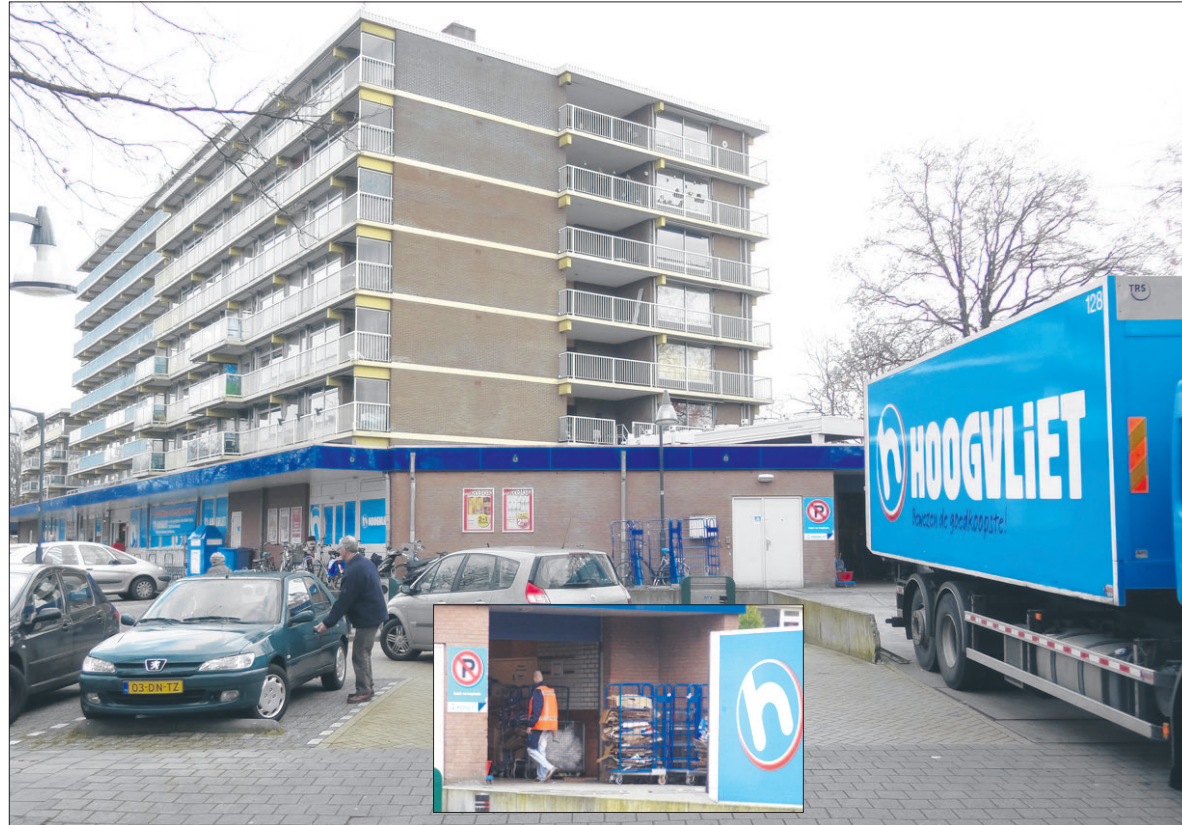
De laad- en losplek bij Hoogvliet. De rolcontainers (inzetje) zijn een bron van overlast.