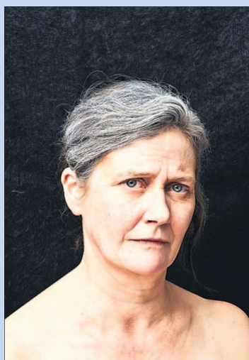
● Zaterdag: 'U bent mijn moeder'.