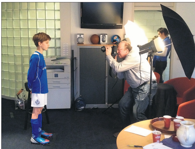
● Fotograaf Peter Huizinga van Foto Astra legt meer dan 750 jeugdvoetballers van SO Soest vast op de foto.

Vanaf het voorjaar zijn mapjes met voetbalplaatjes verkrijgbaar bij Hoogvliet. Tenminste, als je er boodschappen doet. En ze netjes bij de kassa afrekent.