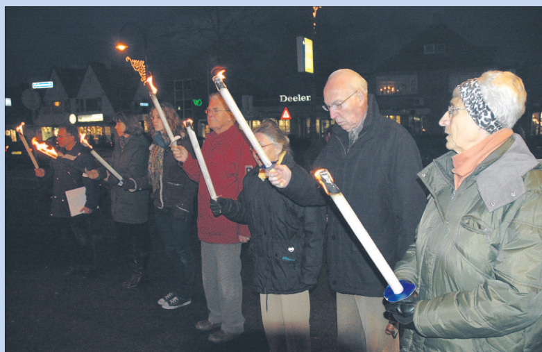
● Maandag: Jaarlijkse Fakkeltwake Amnesty International Soest.