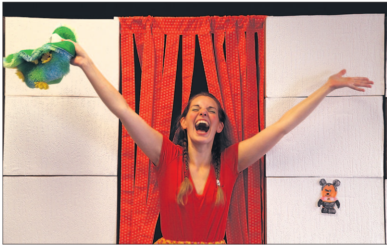
• In de energieke, muzikale en fantasierijke voorstelling VlaFlip worden superhelden ontrafeld.

Een hilarische muziektheatervoorstelling voor kinderen vanaf vier jaar en stevige rockmuziek van een band uit Brabant staan op het programma bij Theater Idea.