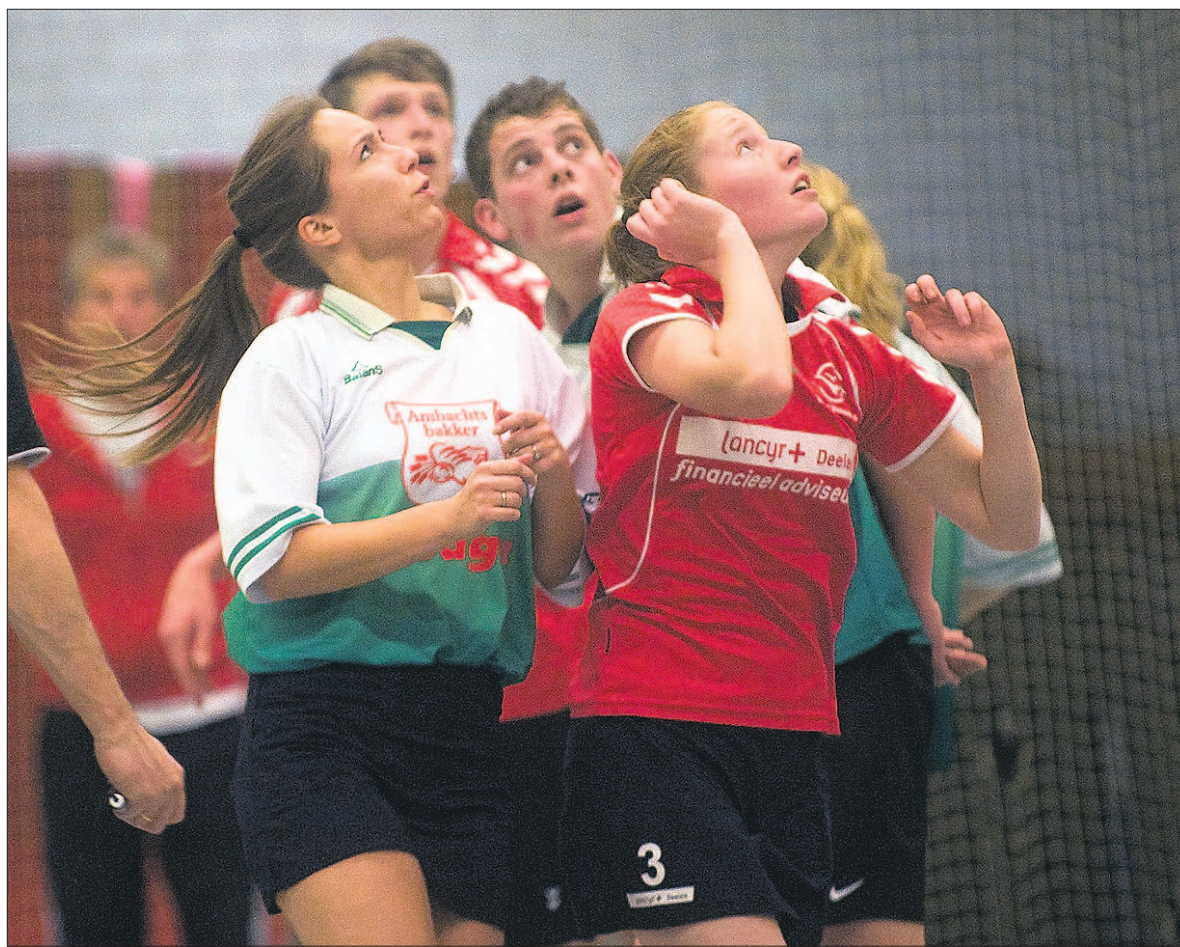
• Stand in de mand en de bal is voor.....