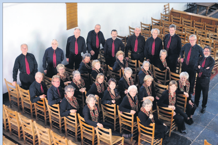
● Woensdag: Optreden van Slavisch Koor Byzantium.