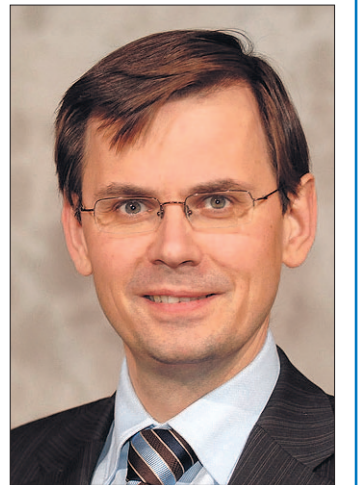
• André Rouvoet verzorgt een toespraak op Prinsjesdag in Soest.

Het ontbijt wordt gehouden in restaurant De Soester Duinen aan de Soesterbergsestraat om 07:00 uur. Aanmelding voor deelname kan via de website: www.gidsnetwerk.nl . Voor deelname vraagt Gids een kostenbijdrage van € 20,00.