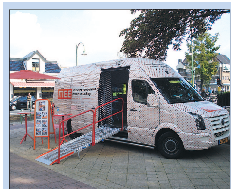
● Dinsdag: De MEE-bus staat weer in de Van Weestraat.

18:00 Gildefeesten: Gildeloop voor jong en oud, verschillende startpunten en afstanden, € 2,00 (t/m 16 jaar) en € 4,00.