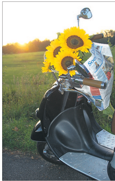
De jury: 'De zonsopgang en de mooie kleuren in de foto geven het totaalplaatje iets extra's.' Jolanda: 'Op weg naar een barbecuefeestje met zomerse bloemen voor de gastvrouw verpakt in de krant om goed te kunnen vervoeren. Onderweg kwamen we de prachtige zonsopgang over de weilanden bij de Wieksloot tegen.'

(Geen prijs voor 'n eervolle vermelding)