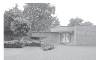
De Engenhof Alb. Cuyplaan

C.V.U.S. Christelijke Vereniging voor Uitvaartverzorging - Soest