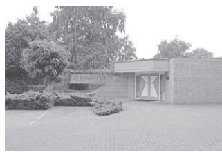
De Engenhof Alb. Cuyplaan

De crematieplechtigheid vindt in besloten kring plaats.