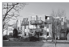
De Gouden Ploeg 6