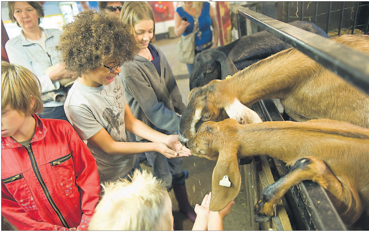
• Uit het vuistje. Dieren voeren, verzorgen, naar buiten brengen en weer terug naar binnen. Het kon allemaal zondag op kinderboerderij De Veenweide. Veel mensen kwamen een handje helpen aan het Vedelaarpad.