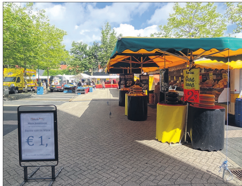
● De weekmarkt is nu nog elke donderdagmorgen te vinden op het parkeerterrein op de hoek van de Smitsweg en de Weegbreestraat. Voor bewoners van het Smitsveen, Overhees en Boerenstreek is de markt straks wat verder weg.