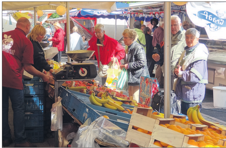
● Jaren is er over gesproken, maar over ruim twee maanden verplaatst de weekmarkt zich naar de heringerichte Van Weedestraat.

Toen de verplaatsing jaren geleden voor het eerst werd geopperd, was er aanvankelijk 'koudwatervrees', onder zowel marktkooplui als winkeliers. De laatste groep vreesde dat