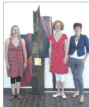
● Fluittrio Djinja.

Het zondagmiddagconcert in De Open Hof is gratis toegankelijk. Na afloop van het optreden aan het Vedelaarpad wordt er wel gecolleceteerd, ter bestrijding van de onkosten. Er kan ook een donatie worden gedaan op bankrekeningnummer 7805836 t.n.v. zondagmiddagconcerten DOH Soest.