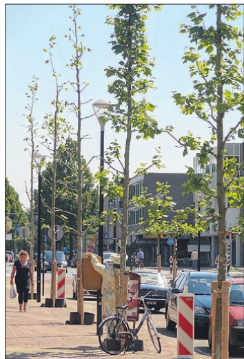
● Platanen zijn een goede keus, vindt Herman Blom.