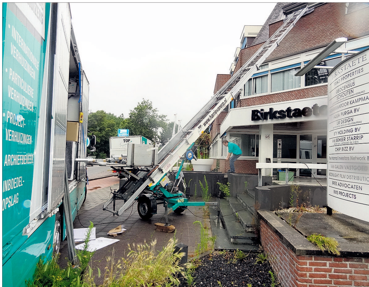
● Eén bedrijf heeft reeds eieren voor zijn geld gekozen en de verhuishwagen besteld. Het was al de bedoeling om elders onderdak te vinden, maar door de problemen in Birkstaete is het vertrek aanzienlijk versneld.

De huurders betaalden maandelijks hun verhuurder. Naast de verschul-