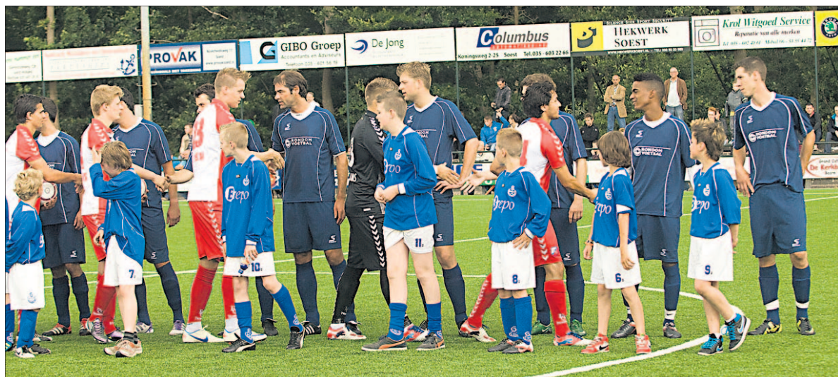
Foto links: Handje schudden voor de wedstrijd op de Bosstraat-Oost.