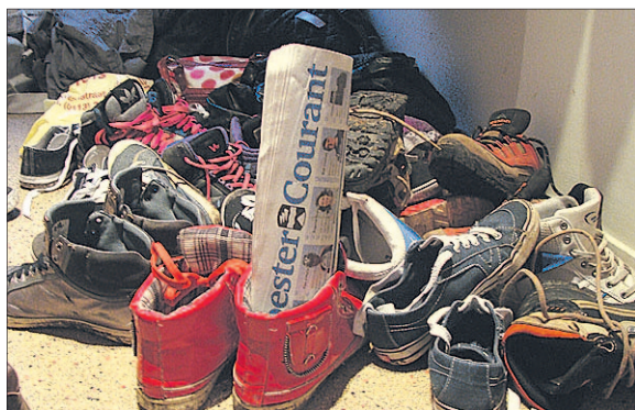
De jury: 'De sfeer van na één dagje te zijn weggeweest (lekker schoenen uitgooien).' Clairie zelf: 'Bij het zien van al deze schoenen in de gang, kreeg ik een echt vakantiegevoel. We waren net terug van Levend Stratego met 16 tieners in de duinen. Vandaar die hoop schoenen. En dan lekker uitrusten en natuurlijk de Soester Courant lezen.' (Geen prijs voor een eervolle vermelding)