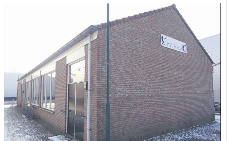
• Het clubgebouw van PV Soest is te vinden aan de Oostergracht, vlak achter het BP-pompstation (achtergrond) aan de Koningsweg. Elke eerste en derde maandagmiddag zijn er seniorenactiviteiten van de SWOS.

Meer informatie over de spelletjesmiddagen is te verkrijgen bij Anja van Vliet, ouderenwerkster van de SWOS, tel. 6010607 of 06-34629205.