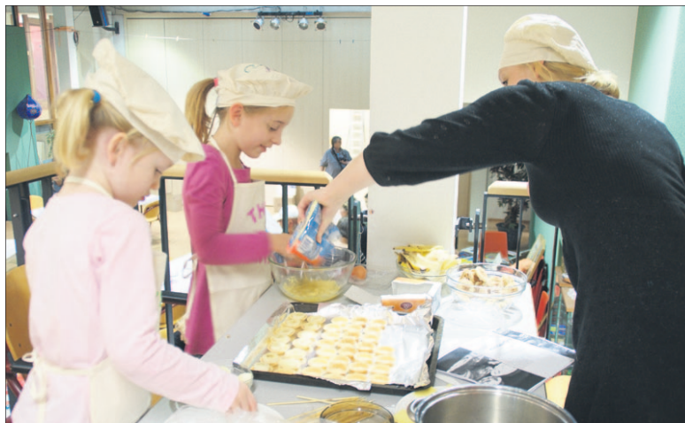
• Twee meisjes en een stagiaire zijn intensief bezig met koken.

zoeken nog naar de juiste formule. Is de herfstvakantie wel het juiste moment voor een dergelijk project of kan het beter op een zondag? Dat zijn zaken waar we over gaan nadenken. Het is in ieder geval leuk om wat met elkaar te doen.' Het project was gratis toegankelijk. Wel konden mensen wat doneren in een collectbus. De gemaakte kunstwerken zijn nog tot en met donderdag 10 november te bewonderen in De Plantage aan de Smitsweg.