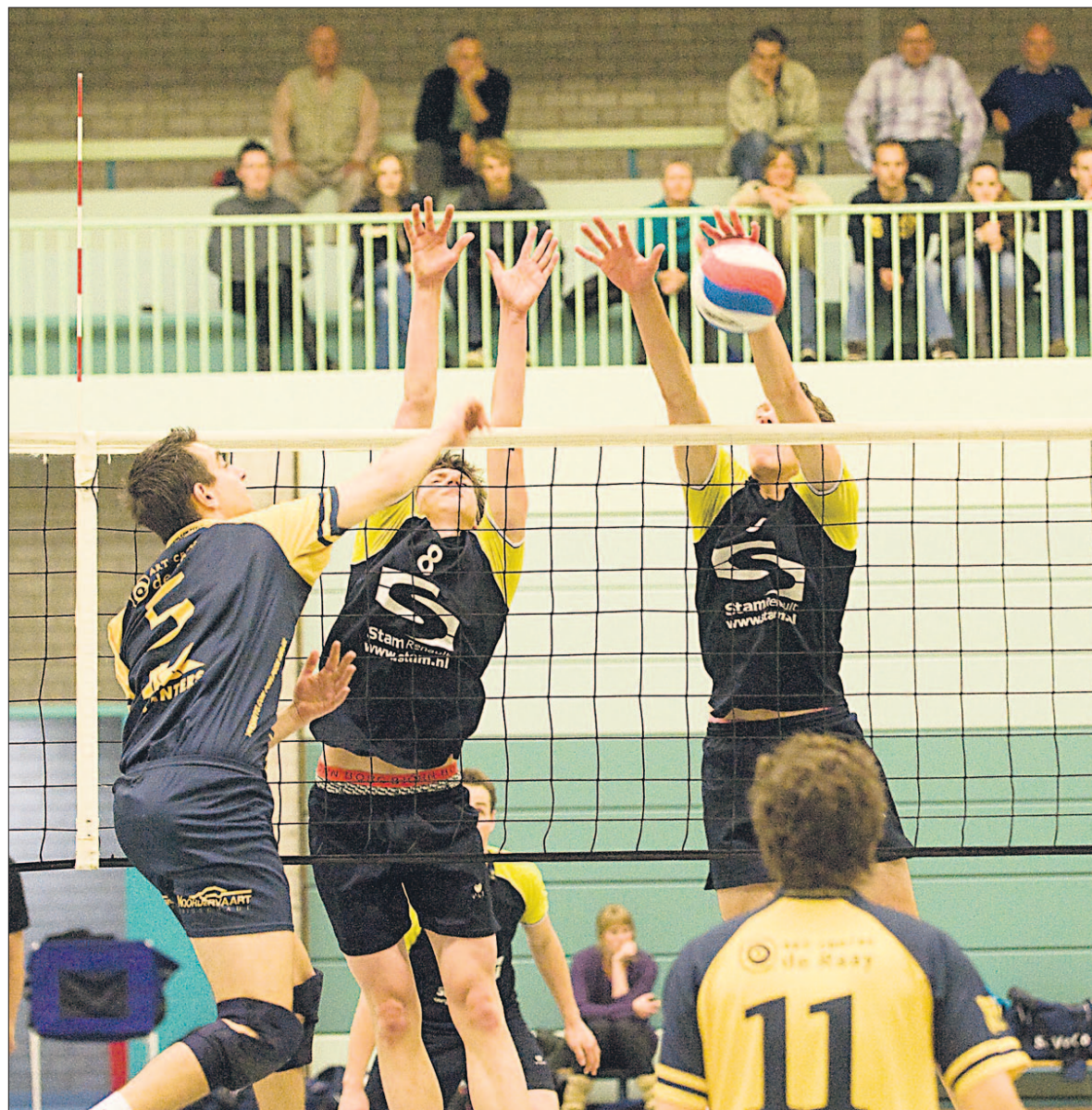
push 2-1 (26-24, 23-25, 15-9), Breda - Sovoco 0-2 (12-25, 24-26).

Uitslagen: Sovoco - Emmen 1-2 (25-17, 25-27, 12-15), Sovoco - Peelpush 2-1 (26-24, 23-25, 15-9), Breda - Sovoco 0-2 (12-25, 24-26).