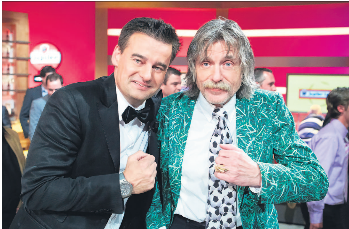
● Wilfred Genee en Johan Derksen (en René van der Gijp) kregen met Voetbal International voor elkaar wat de experts niet voor mogelijk hadden gehouden. De talkshow won de Gouden Televizier Ring.