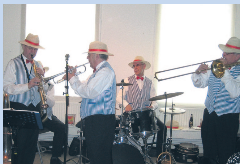
● Zondag: Hammerfield Stompers in Artishock.