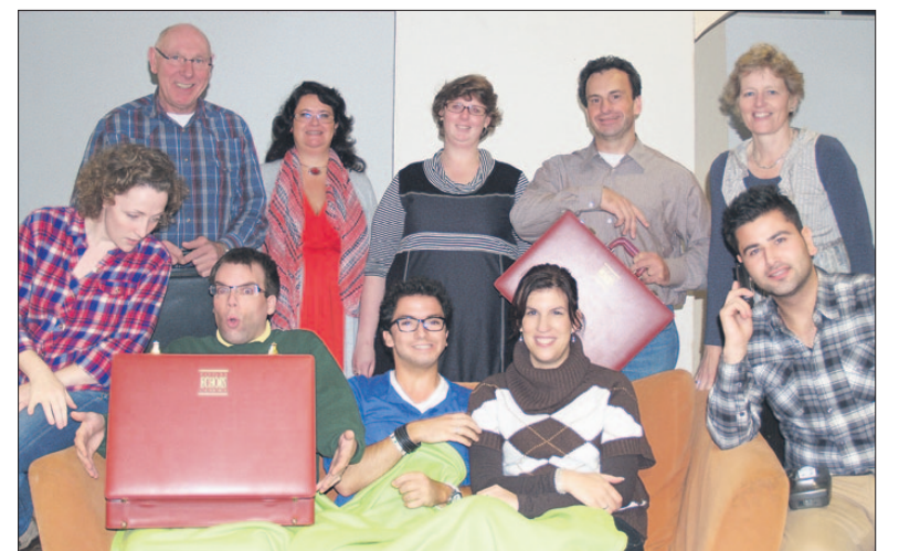
● De toneelvereniging De Rietpluim is druk bezig met repeteren voor de voorstelling die zij binnenkort geeft.

tomaat zit er € 2.755.000 euro in zijn koffertje. Een paar whisky's, het geld geteld en een strijdplan verder gaat hij vol goede moed huiswaarts. Zal hij zijn verjaardag vieren met een bevriend stel of als de wiede-weerga richting Schiphol vertrekken met bestemming onbekend? Als even later de vermeende eigenaar van het verwisselde koffertje uit het kanaal blijkt te zijn gevist begint de situatie ernstig uit de hand te lopen. De voorstelling begint op beide dagen om 20:00 uur en vindt plaats in De Rank aan de Soesterbergsestraat 18 (nabij de Wilhelminakerk). Kaarten kosten € 7,50 en zijn verkrijgbaar bij Ada Egberts, tel. 06-54255873 en Henk Hagen, tel. 06-34424114.