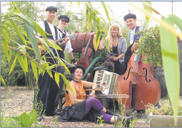
● Woensdag: Theaterdiner in Grand Café De Lindenhof.