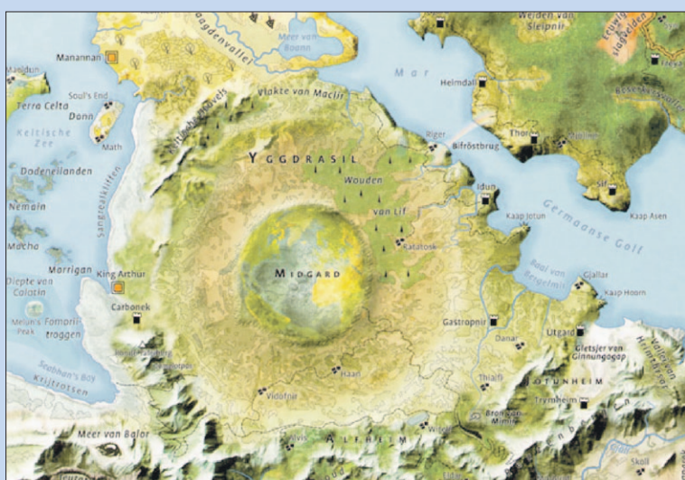
● Zondag: Lezing 'Geïllustreerde Atlas van het Niernamaals.

15:30 Bovenbouwkidz (10-12 jaar) Balans, invulling in onderling overleg, Steunpunt De Eng, Saenredamplantsoen 2b (m.u.v. schoolvakanties).