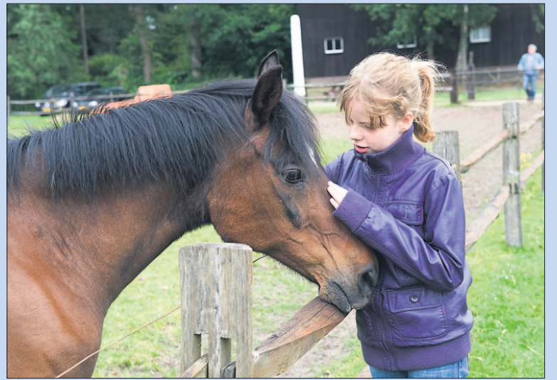
● Zaterdag: Open dag bij De Paardenkamp,