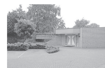
De Engenhof Alb. Cuyplaan

Meld je aan en start je eigen actie op www.geefsam.nl Geef Samen