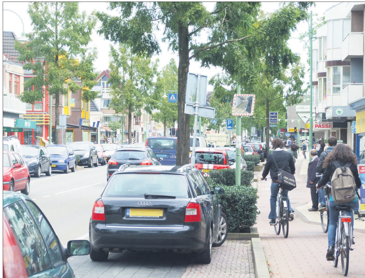
• Minder blik, meer leven in de brouwerij. De Van Weedestraat moet veel meer een verblijfsfunctie krijgen. Daarmee wordt rekening gehouden bij de herinrichtingen. De vraag is hoe vervolgens de ondernemers reageren, zodra de gemeenteraad over twee weken eindelijk een besluit heeft genomen.