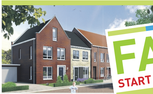
rijwoningen vanaf € 217.500,- v.o.n.