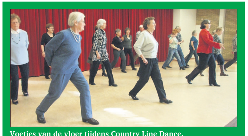
Voetjes van de vloer tijdens Country Line Dance.

Koken voor mannen Mannen bereiden zelf een meergangenmenu en nuttigen die vervolgens gezamenlijk. 8 lessen op dinsdagochtend. Start: nog niet bekend, € 100,00.