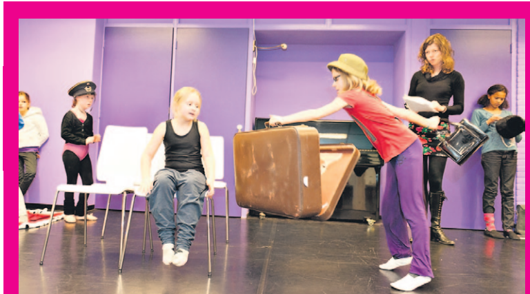
Wegens succes elk jaar opnieuw: Jeugdtheaterschool Idea

Willaertstraat 49 - tel. 6095829 www.ideasoest.nl