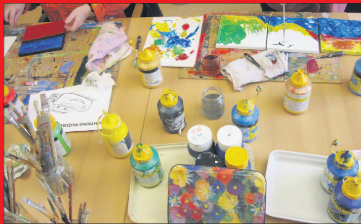
Een resultaat van een creatieve workshop in THHA.

24 december, 21:00 uur: Poëzie en muziek rond Kerst (in Rembrandt-atelier, Rembrandtlaan 11, vrijwillige bijdrage na afloop).