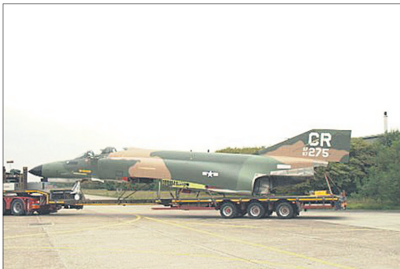
• De romp van de Phantom met aangepaste staartcode en afwijkend kleurenschema komt per dieplader op Soesterberg aan.

De directie van het museum, vorig jaar goed voor 145.000 bezoekers, heeft nog wel enkele wensen voor het uitbreiden van de collectie. Een aantal daarvan wordt gehonoreerd. Er komt via Duitsland een Cessna T-37 en uit Canada waarschijnlijk een Tutor. Uit Delft komt een Alouette III die in Cambodja heeft gevlogen. Ook wil het museum graag een Beech AT-11 lesvliegtuig uit de Tweede Wereldoorlog met een Nederlandse achtergrond. Of dat er komt hangt af van de bereidheid van de eigenaar om het af te staan. Ten slotte zou het museum graag een Lynx-helikopter willen hebben. Kortom, plannen en wensen genoeg die liefst straks in het nieuwe Defensiemuseum geëffectueerd moeten zijn.