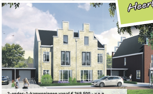
2-onder-1-kapwoningen vanaf € 369.500,- v.o.n.