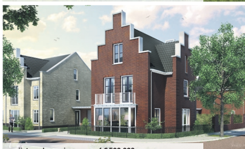
vrijstaande woningen vanaf € 529.000,- v.o.n.

FASE 4 START VERKOOP 15-09-2011 Heerlijk wonen bij het water