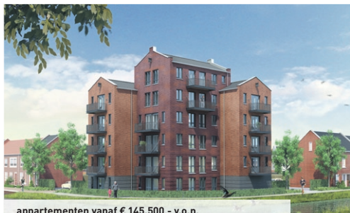
appartementen vanaf € 145.500,- v.o.n.