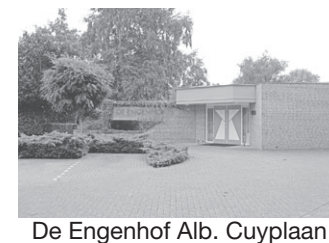
De Engenhof Alb. Cuyplaan