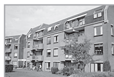
Burg. Grothestr. 78-212