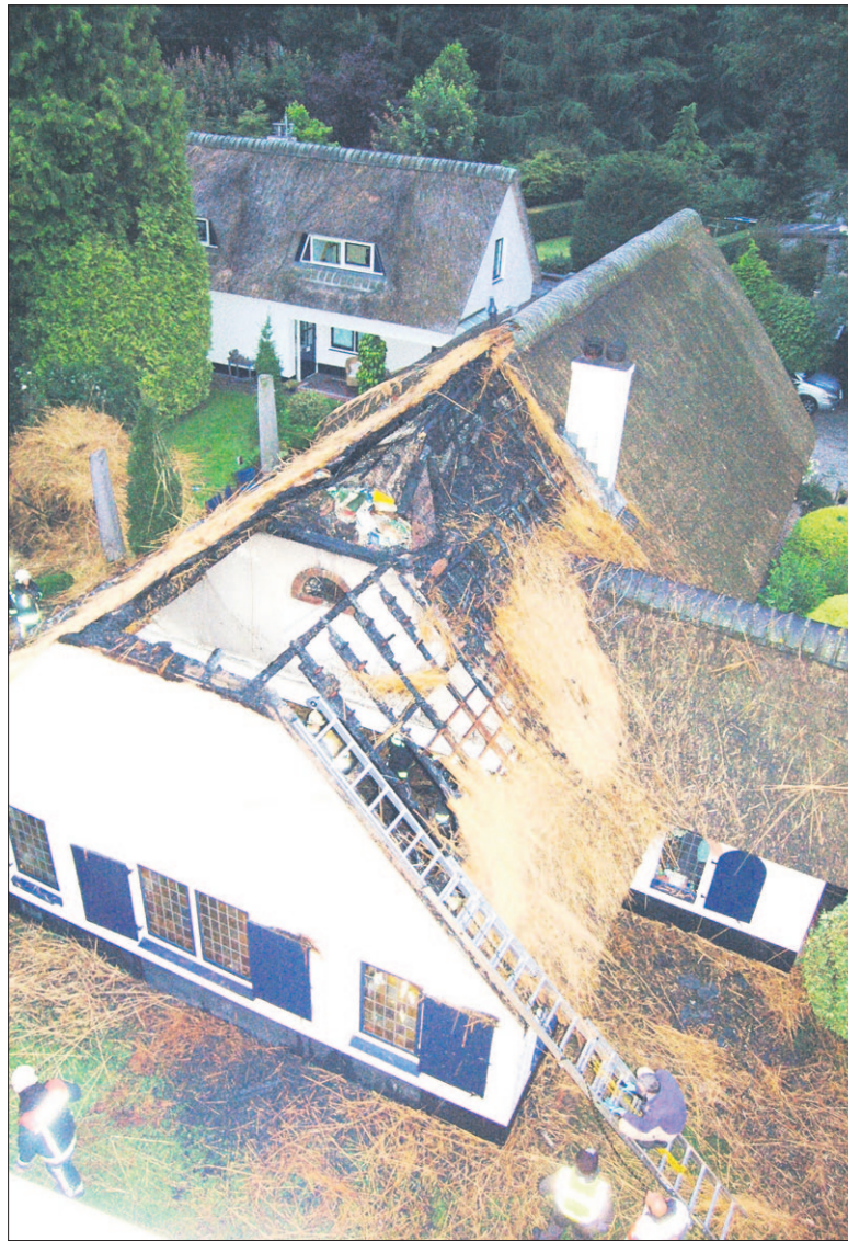
● Een luchtfoto laat zien hoeveel schade is aangericht. Ofschoon de brand betrekkelijk klein van omvang was, is het rieten dak vernield. De zoldervloer stortte in, waardoor in de woning veel schade werd toegebracht, nog afgezien van wat het water en het roet aanrichtten.

De brandweer van Soest werd donderdagmorgen om 3:14 uur gewaarschuwd. In het uur erna werd de hulp ingeschakeld van korpsen uit de hele regio. Niemand raakte gewond. De bewoners vonden in de omgeving onderdak en zijn inmiddels op vakantie gegaan, zoals reeds gepland. De politie werkt koortsachtig door om de dader te vinden. Opsporing Verzocht (AVRO) besteedde gisteravond aandacht aan de serie brandstichtingen.