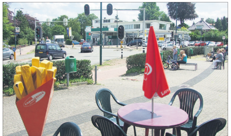
• Het Nieuwerhoekplein schreeuwt om een aanpak.