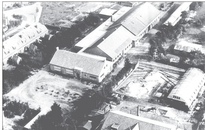
• Luchtfoto met de gebouwen in het midden van Tempo, rechtsonder de garage van Leguit/Speek & Muller.