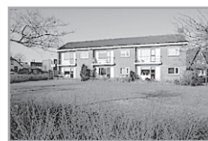
Korte Hartweg 48