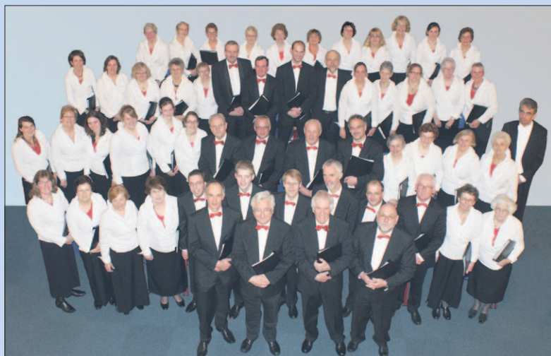
• Zaterdag: Jubileumconcert Christelijk Gemengd Ichtuskoor.