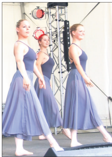
• Twee jaar geleden stond er ook dans op het programma. Het cultuurfestival vond toen plaats rond het gemeentehuis.

Een dag later zal er van alles te beleven zijn rondom de locatie rotonde Dalweg-Kerkplein-Steenhoffstraat. 'We hebben voor een andere naam gekozen, omdat uit onderzoek bleek dat veel jongeren de naam Cultuurfestival wat stoffig vonden. Door de naam te veranderen hopen we meer mensen te trekken.' Daarnaast past de nieuwe naam beter bij het festival aangezien de activi-