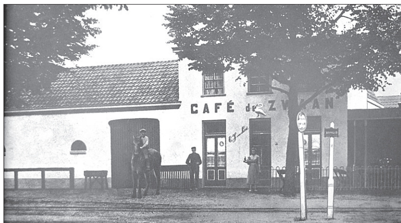
• Dit is een van de eerste foto's van 't Zwaantje (De Zwaan) als uitspanning, in bruikleen aan het Groeimuseum in Soesterberg afgestaan door Jan van Steendelaar van Eempers.

zijn veel verhalen verbonden. Die zijn nog bekend bij de oudere inwoners van het dorp of bij hen die ze van overlevering uit familiekring hebben. Stichting Balans en het Cultuurpunt-Soest gaan deze verhalen in beeld en geluid in het museum onderbrengen. Door het groeimuseum te openen wil Stichting Balans met het Cultuurpunt-Soest en inwoners door een gemeenschappelijk verleden inwoners met elkaar en het dorp verbinden. Alle Soesterbergers worden uitgenodigd om een bijdrage te leveren aan het museum door oude foto's, bijvoorbeeld schoolfoto's, ter beschikking te stellen. Op deze manier zal het museum steeds verder uitgroeien. Naast de mogelijkheid tot een bezoek zullen er ook verschillende activiteiten plaatsvinden, zoals workshops.