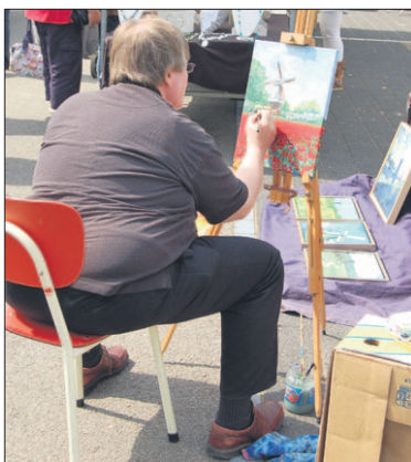
● Ondanks de drukte liet deze kunstschilder zich niet van de wijs brengen.

Ook voor de jeugd was er genoeg te kijken en te doen. Kinderen konden bijvoorbeeld veilig 'bungeejum-