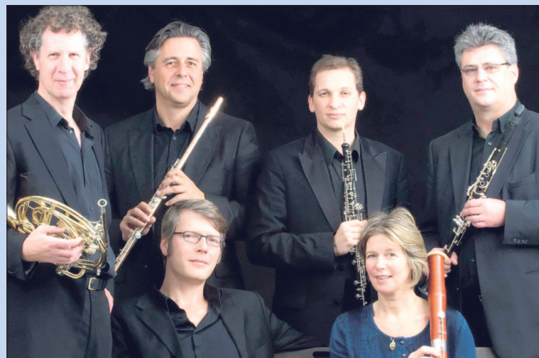
• Zondag: Het Hexagon Ensemble bij Muziekring Eemland.