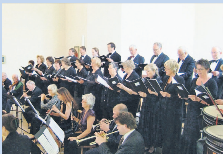
• Zondag: Jaarlijkse voorjaarsconcert Het Colenso Consort.

20:00 Kickboksen voor jongens, 12-18 jaar, Stichting Balans, sportzaal Smitsweg, (€ 15,00 per maand).