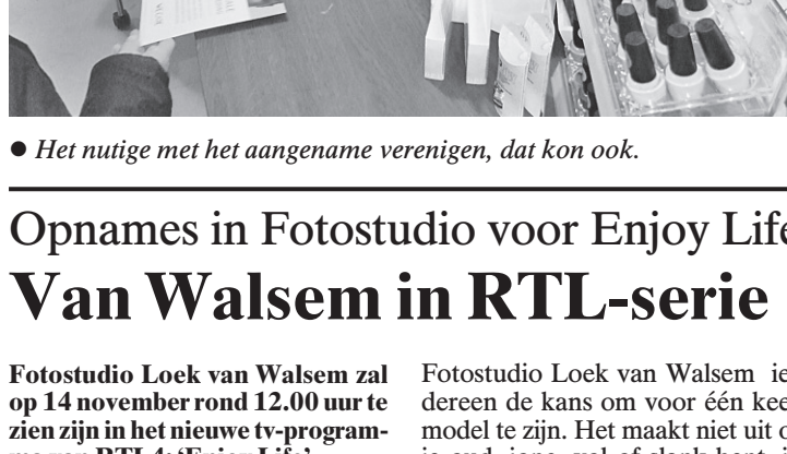
• Het nutige met het aangename verenigen, dat kon ook.

Volgende week gaat hij alweer om de tafel zitten om te evalueren en alvast de blik op volgend jaar te richten. 'Natuurlijk, we gaan hier absoluut mee door. Er is voldoende animo en ik ben dit weekeinde alweer benaderd door verschillende bedrijven die interesse hebben. We hebben al wat spectaculaire dingen bedacht, maar die houden we voor ons. Groter gaan we het Lifestyle Event niet maken. Het is wat ons betreft precies goed zo. Hier en daar gaan we wel puntjes op de i zetten. Een voorbeeld? Volgend jaar zorgen we ervoor dat het verkeer drie dagen lang geregeld wordt. Schrijf maar vast op: eerste weekeinde van november 2011.'