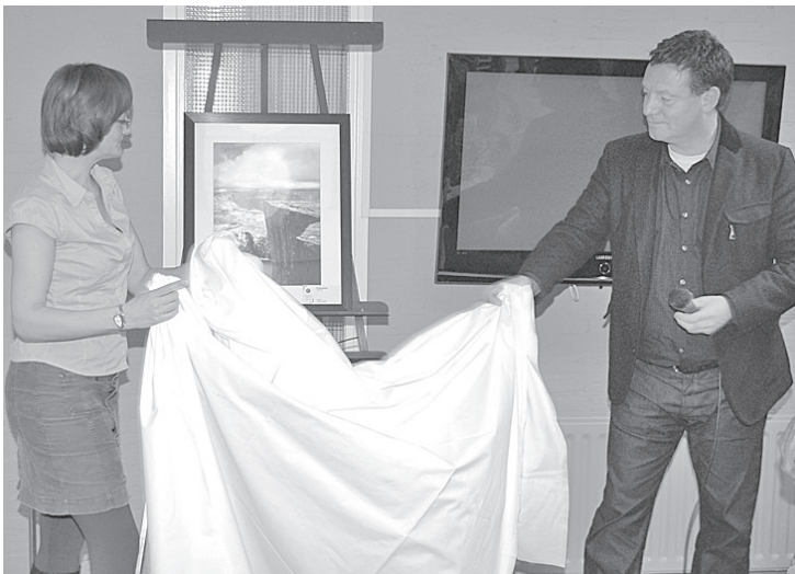
Foto-expositie 'Rond de wereld' in De Heybergh