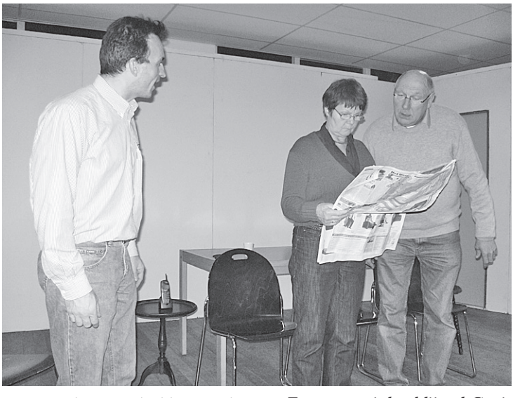
Een scène uit het blijspel Goeie Buren.

Ondanks dat De Rietpluim maar twee voorstellingen per jaar geeft kan de vereniging daar prima van rondkomen. 'We hoeven er niks aan te verdienen, als we de kos-