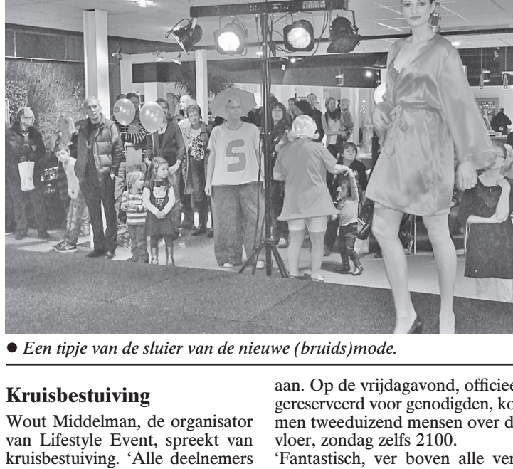
• Een tijp van de sluijer van de nieuwe (bruids)mode.

Ben de Bruin Rijwielspecialist heeft een type fiets meegenomen, dat volgend jaar op de markt verschijnt. Daar is bewust voor gekozen, vertelt de vertegenwoordiger. 'We wilden dit jaar iets nieuws laten zien. Het gaat ons hier niet om de verkoop, al hebben we al enkele fietsen verkocht. Het is vooral je gezicht laten zien, en bovendien is het bijzonder gezellig.'