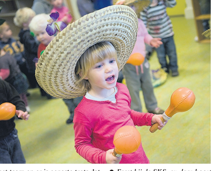
● Feest bij de SKS, en daar hoort muziek bij.

Opvang van kinderen is niet meer weg te denken. In het dure Scandinavië was het al veel langer gebruikelijk dat beide ouders brood op de plank moesten brengen. In Nederland zijn de tweeverdieners inmiddels ook vertrouwd. Toen Tamarinde in 1988 werd gedoopt tot Pipeloentje, was de stichting met zeven peuterspeelzalen al in alle wijken vertegenwoordigd. Omdat steeds meer ouders uit één gezin beiden werkten en/of studeerden, ontstond ook in Nederland de behoefte aan kinderopvang. In 1990 opende de SKS de Dribbel. Twee jaar later betrof de stichting de voormalige huishoudschool aan de Talmalaan (Het Kasteel) waar een tweede dagverblijf werd geopend. Het Kasteel werd tevens de eerste locatie voor buitenschoolse opvang. 'Vanaf de oprichting waaide er met enige regelmaat een politieke wind uit een andere hoek. Het laven tijdens de windrichtingen is de SKS, mede dankzij het enthousiasme en de inzet van vrijwilligers en medewerkers, altijd goed afgegaan', aldus de directie van de stichting die morgen op de dag af veertig jaar bestaat.