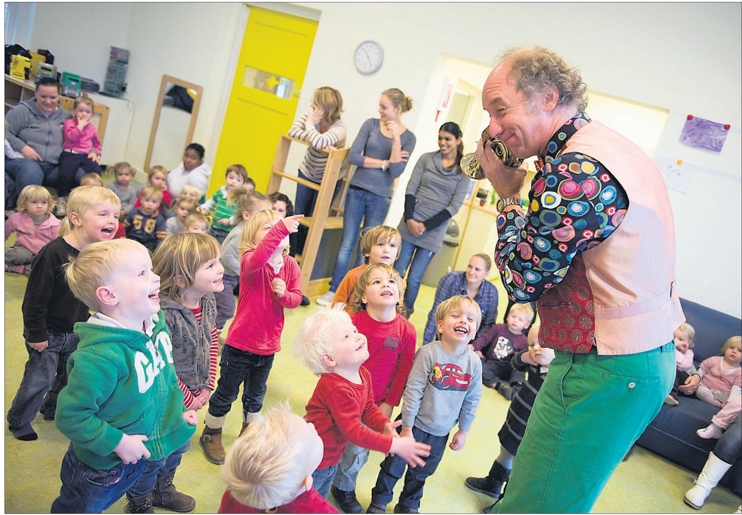
Peuters, kleuters en iets oudere kinderen die 'hun' veertigste verjaardag vieren. Het kan bij de Stichting Kindercentra Soest dat deze leeftijd heeft bereikt en deze week in alle vestigingen feest viert. Twee weken geleden kwam er een 'cadeau' van de gemeente. Als eigenaar van het hoofgebouw aan de Talmalaan (Het Kasteel) stelde de gemeenteraad 700.000 euro beschikbaar voor een grondige modernisering van het gebouw dat tevens veiliger wordt gemaakt. De SKS draagt zelf anderhalve ton euro bij. Lees meer op pagina 3.