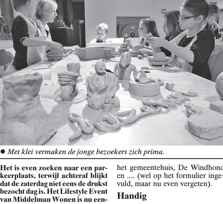
• Met klei vermaken de jonge bezoekers zich prima.

Het is even zoeken naar een parkeerplaats, terwijl achteraf blijkt dat de zaterdag niet eens de drukst bezocht dag is. Het Lifestyle Event van Middelman Wonen is nu eenmaal een publiekstrekker.