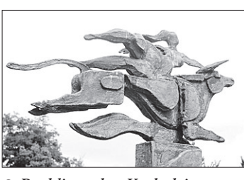
Beeldje op het Kerkplein.