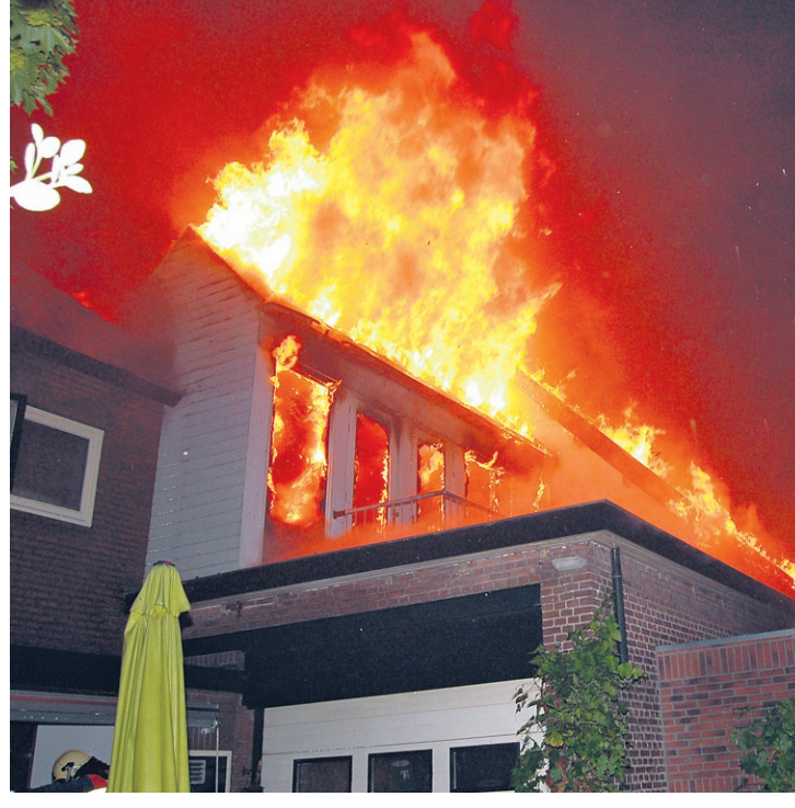
● Toen de brandweer arriveerde, kon de bovenverdieping als verloren worden beschouwd. De vlammen sloegen om zich heen, maar uitbreiding van de brand werd voorkomen.