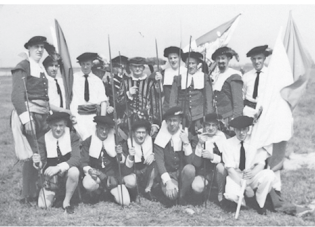
● Het gildekorps bij de oprichting in 1960.

Op zondag 22 augustus zal het 50-jarig bestaan van het gildekorps worden gevierd op het terrein De Blaak met een reünie, een tentoonstelling over 50-jarig korps en vele activiteiten. Naast een optreden van het eigen gildekorps zullen er ook andere gilden en muziekverenigingen demonstraties verzorgen en zorgen voor een attractief programma voor jong en oud. Vanaf 14:00 uur is iedere belangstellende op het gildeterrein welkom.