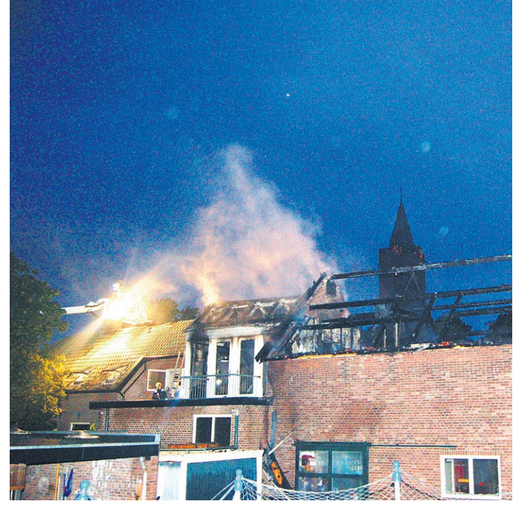
● Bij het ochtendgloren was goed te zien hoeveel schade het vuur had aangericht aan het pand van Garage De Toren aan de Neerweg. Er raakte niemand gewond.

De eigenaar van een garage aan de Neerweg en zijn gezin werden maandagmorgen vroeg opgeschrikt door het brandalarm. Iets na vieren stond de bovenverdieping van Garage De Toren in lichterlaaie.