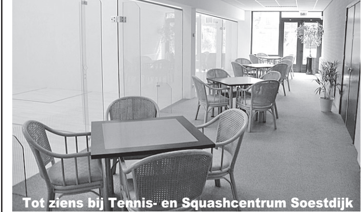
Tot ziens bij Tennis- en Squashcentrum Soestdijk

www.ltcsoestdijk.nl/indoor of bel: 035 - 588 04 64