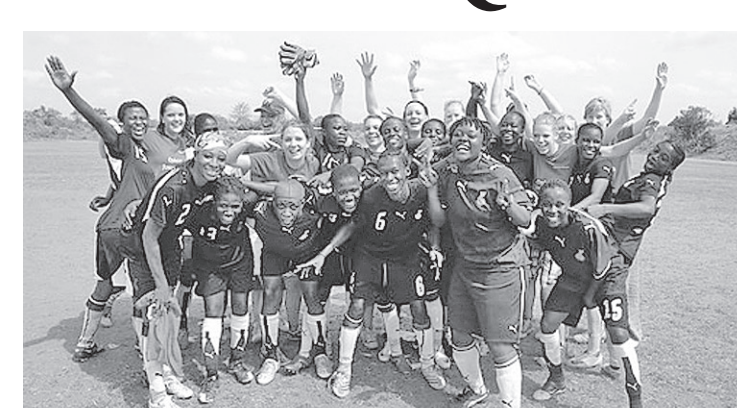
De Ghanese Black Queens omarmen hun Nederlandse tegenstanders na een partijtje voetbal in Accra.

De wereld is in de ban van het WK voetbal. De vraag: 'Wat is er vanavond op televisie?' is nog nooit zo overbodig geweest. Want niet veel mensen weten, is dat een interland voetballen helemaal niet zo moeilijk is. De formule is simpel: elf studentes met een mannelijke student erbij om de boel vast te leggen voor het nageslacht. Een training van de Black Queens, het vrouwenteam van Ghana, vroeg in de ochtend in de hoofdstad Accra. Een en Ghanese erbij om precies uit te kunnen leggen wat we van plan zijn. En vooral om te vertellen dat ze voorzichtig met ons moeten doen. De training gaat er hard aan toe en de meeste studenten hebben nog nooit een voetballes gehad. We hupsen heen en weer voor de warming-up. Niet dat dat nodig is, het is tenslotte om acht uur 's ochtends al een graad of dertig. Maar het hoort erbij en het ziet er wel zo