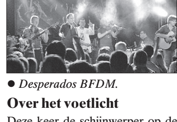
● Desperados BFDM.