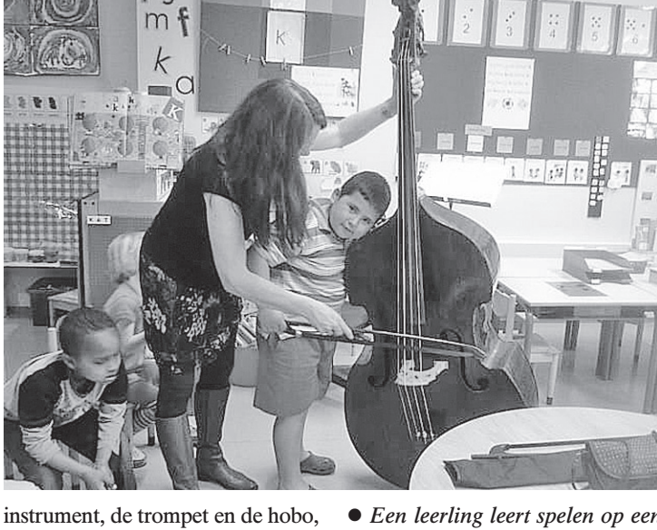
● Een leerling leert spelen op een contrabas tijdens de dag van Bach.

Alle leerlingen van de kunstmagneetschool de Egelantier hebben onlangs genoten van een hele dag met Bach. Deze dag werd al voorbereid in de week ervoor. In de zaal stond een levensgrote stand-up Bach met een koffer. In de koffer zaten verschillende voorwerpen die typerend zijn voor de tijd en de omstandigheden waarin hij leefde en werkte.