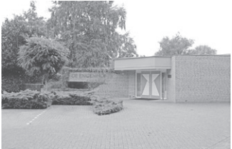
De Engenhof Alb. Cuyplaan