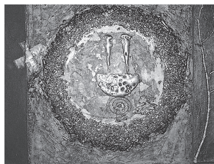
● Beeld van Geert de Bruijn, te zien in de Oude Kerk vanaf 4 juli.

ganiseerd door de Stichting Kerk en Cultuur, zijn er schilderijen en beelden te zien van Geert de Bruijn met als thema: 'Onstoffelijk-Stoffelijk'. De opening vindt plaats op zondag 4 juli om 14:00 uur en maakt deel uit van het eerste zomerconcert. Geert de Bruijn (1956, Amsterdam) volgde zijn opleiding aan Koninklijke Academie voor Kunst en Vormgeving in 's-Hertogenbosch, afdeling ruimtelijke vormgeving. Zijn specialisme: twee- en driedimensionaal werk in brons en andere materialen en wandschilderingen. Tijdens de tentoonstelling van 4 juli tot en met 14 augustus zijn diverse werken te zien zowel twee- als driedimensionaal. Geert laat zich inspireren door de mythologie. Over zijn werk schrijft hij: 'De oerkrnal en de daaruit voortvloeiende dualiteiten zijn de impulsen voor mijn werk, voortgekomen uit de fascinatie voor de allesomvattende moe-