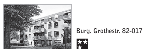
Energielevel: D Burg. Grothestr. 82-017

Voorwaarden : Bijzonderheden : Berging, cv, nabij winkels, scholen en o.v. Huurprijs en huuringsdatum zijn onder voorbehoud. LET OP!! Er vindt een huurverhoging plaats per 1 juli 2010!! Verhuurder : Portaal Eemland