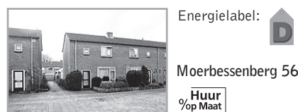
Energielevel: D Moerbessenberg 56

Reactienummer : 211007006 Wijk : Soesterberg Woningtype : Bovenwoning Aantal kamers : 3 Opp.woonkamer : 18 m 2 Opp. sl. kamers : 8 m 2 , 11 m 2 Etage : 1e etage Beschikbaar per : donderdag 29 april 2010 ov Netto huur : 341,07 Bruto huur : 344,77 Subsidiab. huur : 341,07 Servicekosten : 3,70