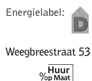
Energielevel: D Weegbreestraat 53

Voorwaarden : Bijzonderheden : Berging, beheerder leefomgeving, nabij winkels, openbaar vervoer en scholen, lift. Let op huurprijs is onder voorbehoud!! Huurverhoging per 1 juli 2010!! Verhuurder : Portaal Eemland