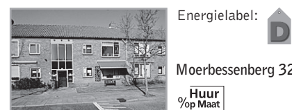
Energielevel: D Moerbessenberg 32

Voorwaarden : Bijzonderheden : Berging, cv, nabij winkels, scholen en o.v. Huurprijs en huuringsdatum zijn onder voorbehoud. Let op er vindt een huurverhoging plaats op 1 juli 2010!! Verhuurder : Portaal Eemland