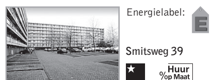
Energielevel: E Smitsweg 39

Voorwaarden : Bijzonderheden : Leeftijd vanaf 60 jaar Lift. Cy, lift, balkon, alarmering, huismeester, recreatiemogelijkheden in verzorgingshuis en zorg op indicatie mogelijk. Woonkamer inclusief open keuken. Uitzicht op binnentuin. Verhuurder : Zorggroep Laak & Eemhoven