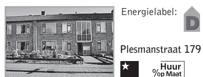
Energielevel: D Plesmanstraat 179

Voorwaarden : Bijzonderheden : Leeftijd vanaf 60 jaar Cy, lift, balkon, alarmering, huismeester, recreatiemogelijkheden in verzorgingshuis en zorg op indicatie mogelijk. Woonk. incl. open keuken. Uitzicht binnentuin. Service. incl. stookk. Verhuurder : Zorggroep Laak & Eemhoven