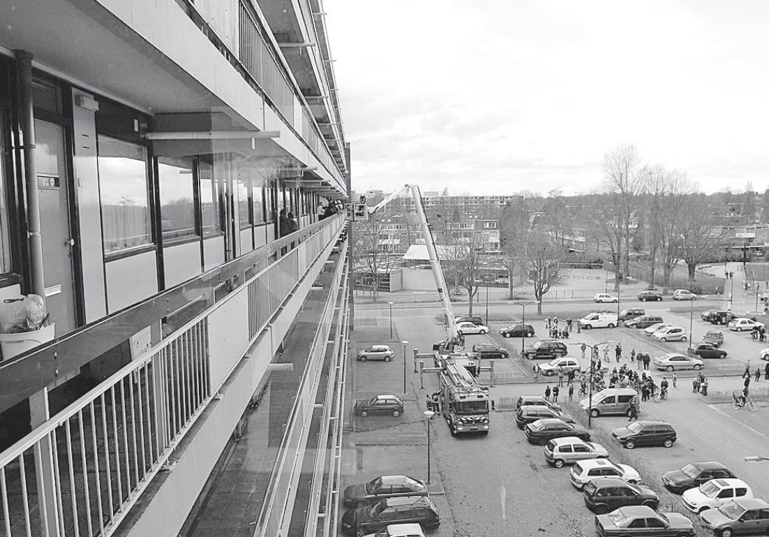
● Het gros van de keukenbrandjes ontstaat doordat de bewoner vergeet het vuur onder een pan uit te draaien. Woensdagmiddag was dat in Soest niet anders. De bewoner van een vijfhoek flat aan de Smitsweg had zijn eten op het vuur gezet en was even de deur uitgegaan, maar had verzuimd onder een van de pannen het vuur te doven. Daardoor kookte het pannetje droog met als gevolg dat de woning onder de rook kwam te staan. Een buurman rook een brandlucht en ging op onderzoek uit. Hij zag vanaf zijn balkon rook uit de flat van zijn buurman komen en waarschuwde de brandweer. Deze rukte uit met twee bluswagens en de hoogwerker. Er hoefde geen water gebruikt te worden, want nadat de brandweer een raam had ingeslagen, volstond het uitdraaien van de gasvlam. De rest van de klus bestond uit het ventileren van de woning, een nacontrole met de warmtebeeldcamera en het opvegen van de glazenerven op de galerij.