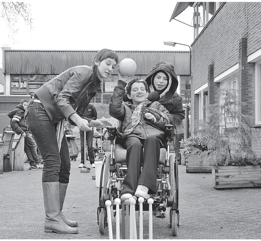
● Leerlingen van groep acht van de Van der Huchtschool-Valeriaan uit Soest bezochten vorige week dagbestedingslocatie Het Leemveld van Amerpoort. Zij ondernamen samen met mensen met een beperking activiteiten. Op die manier wilden Amerpoort en de basisschool de integratie van mensen met een beperking in de samenleving bevorderen. De scholieren en de cliënten maakten onder meer gezamenlijk collages en een lied. Daarnaast draaiden de scholieren mee met de