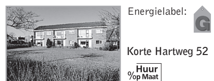
Energielevel: G Korte Hartweg 52

Voorwaarden : Bijzonderheden : Berging, cv, tuin, nabij openbaar vervoer en scholen. Huuringsdatum en huurprijs zijn onder voorbehoud! Er vindt een huurverhoging plaats per 1 juli 2010. Verhuurder : Portaal Eemland