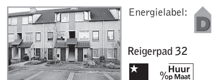
Energielevel: D Reigerpad 32

Voorwaarden : Bijzonderheden : Berging, nabij winkels, scholen en openbaar vervoer. Let op er vindt een huurverhoging plaats per 01 juli 2010. Huuringsdatum en huurprijs onder voorbehoud. Verhuurder : Portaal Eemland