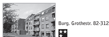
Energielevel: D Burg. Grothestr. 82-312

Voorwaarden : Bijzonderheden : Balkon, berging, beheerder leefomg., nabij o.v., zolder + vlizotrap, cv. Serv.kosten incl. stookk. Huuring.datum en huurprijs o. voorbeh. Let op er vindt een huurverhoging plaats per 01 juli 2010. Verhuurder : Portaal Eemland