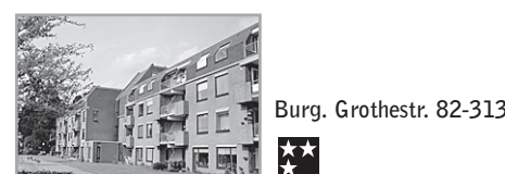
Energielevel: D Burg. Grothestr. 82-313

Voorwaarden : Bijzonderheden : Leeftijd vanaf 60 jaar Cy, lift, balkon, alarmering, huismeester, recreatiemogelijkheden in verzorgingshuis en zorg op indicatie mogelijk. Woonkamer is incl. open keuken. Uitzicht binnentuin. Verhuurder : Zorggroep Laak & Eemhoven