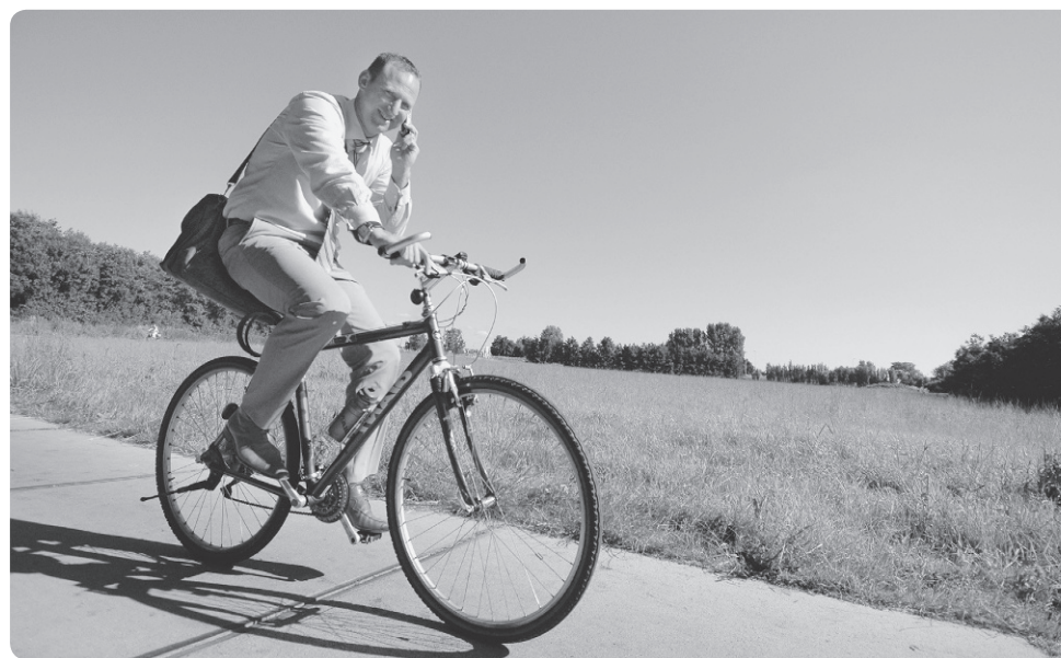
Fiets naar je werk!

'Zeer attent, vriendelijk en altijd een passend advies. Hij weet precies hoeveel strippen er nodig zijn voor