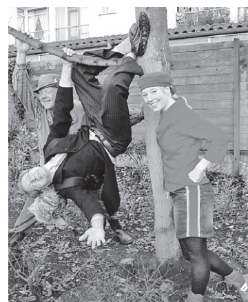
De Peuter- en Kleuterliedjesband.

Op zondag 30 augustus vindt de laatste voorstelling in het Openlucht Theater Amersfoort van dit seizoen plaats. De serie wordt afgesloten met een spetterend optreden van De Peuter- en Kleuterliedjesband voor kinderen vanaf 3 jaar en hun ouders, opa's, oma's en andere belangstellenden.