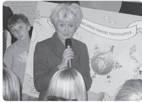
Minister Cramer van milieu neemt de verzamelde voetstappen in ontvangst.

Het Nederlandse openbaar vervoer is onmisbaar, maar nog meer mensen zouden er gebruik van kunnen maken. Op zaterdag 19 september is er in grote delen van Nederland gratis openbaar vervoer en zijn er (kortings-)acties. ROVER pimt verschillende busstations. Wie weet pak jij de bus in een mooi versierde halte, onder het genot van een muziekje of