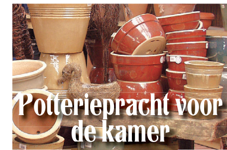
Potteriepracht voor de kamer

Wij danken u voor uw vertrouwen in het afgelopen jaar en wensen u een voorspoedig 2009