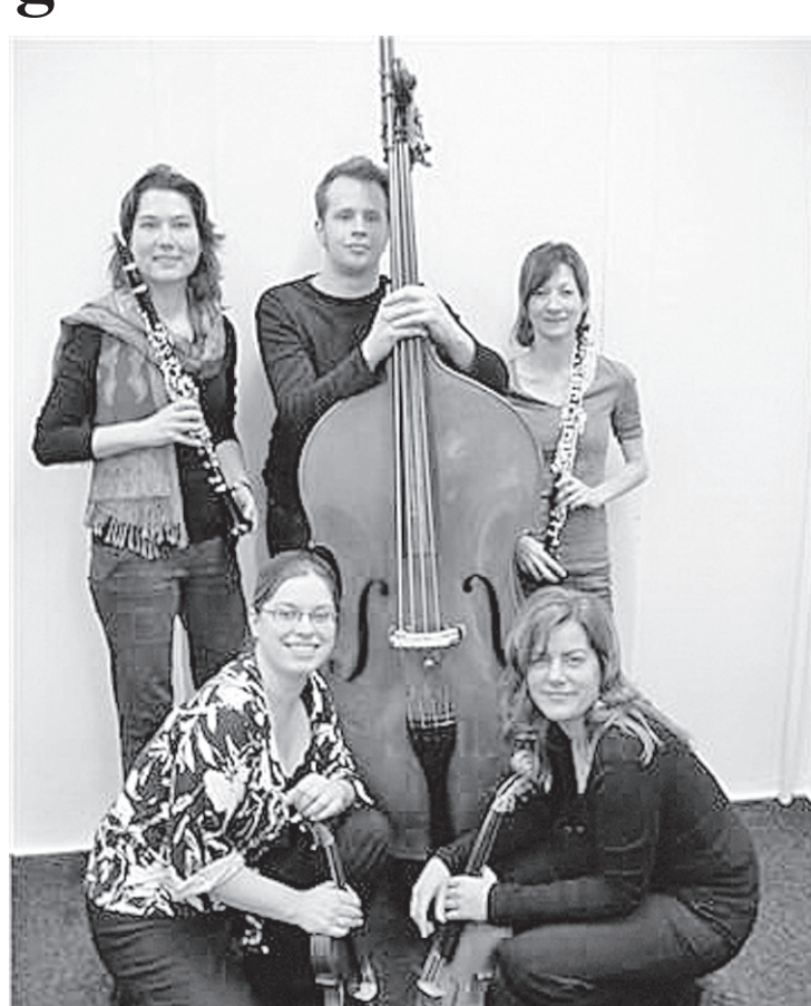
• Vijf van de acht musici die meewerken aan het concert.

Het concert wordt gegeven op zondag 11 januari vanaf 15:00 uur in Hilton Royal Parc, Van Weerden Poelmanweg 4-6, Soestduinen. Toegang (inclusief een glas wijn na afloop) € 18,00; voor Vrienden van Muziekkring Eemland € 12,00. Reserveren: www.muziekkringeemland.nl of 60.37.804.