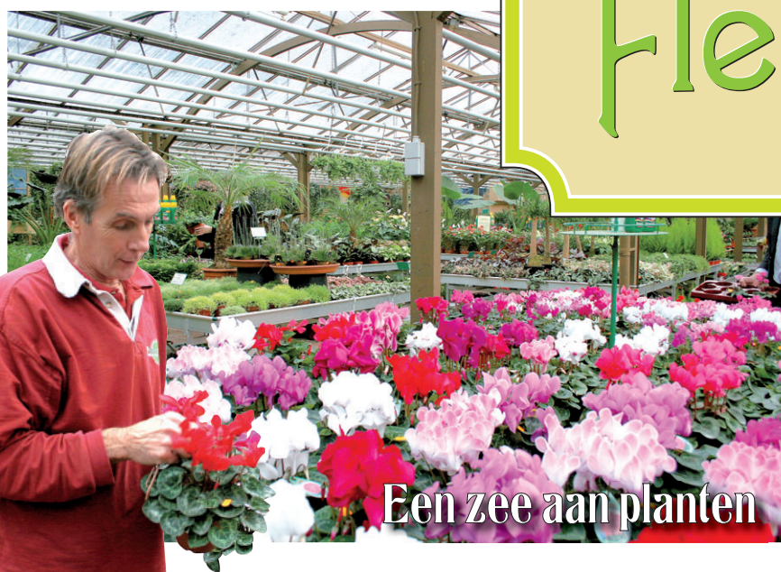
Een zee aan planten