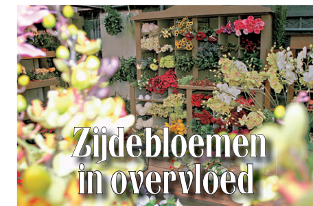
Zijdebloemen in overvloed