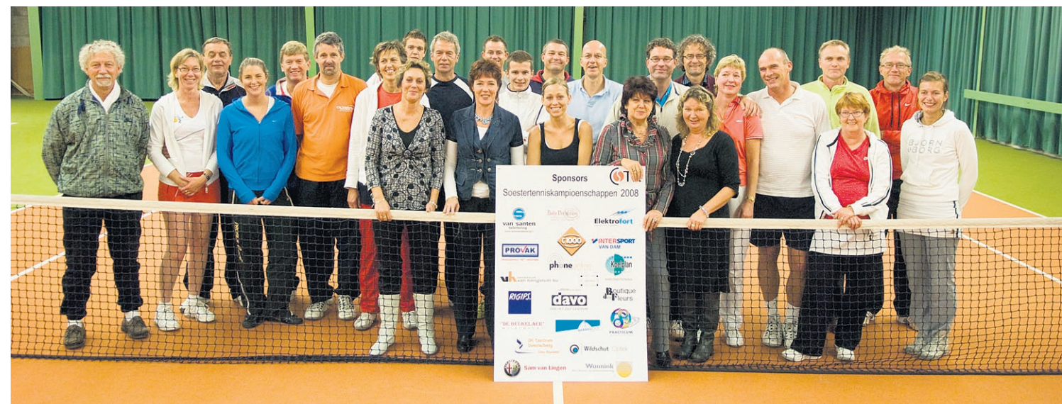
● De Soester Tenniskampioenschappen leveren uiteindelijk winnaars op, maar het gaat er vooral om een week of vijf plezier op en naast de