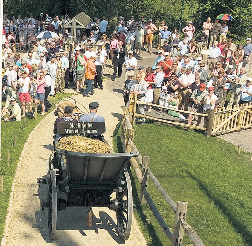
hond, tachtig jaar geleden afgebrand, is 'uit de as' herrezen. Honderden klappen als de eerste meelwagen symbolisch de molen verlaat.