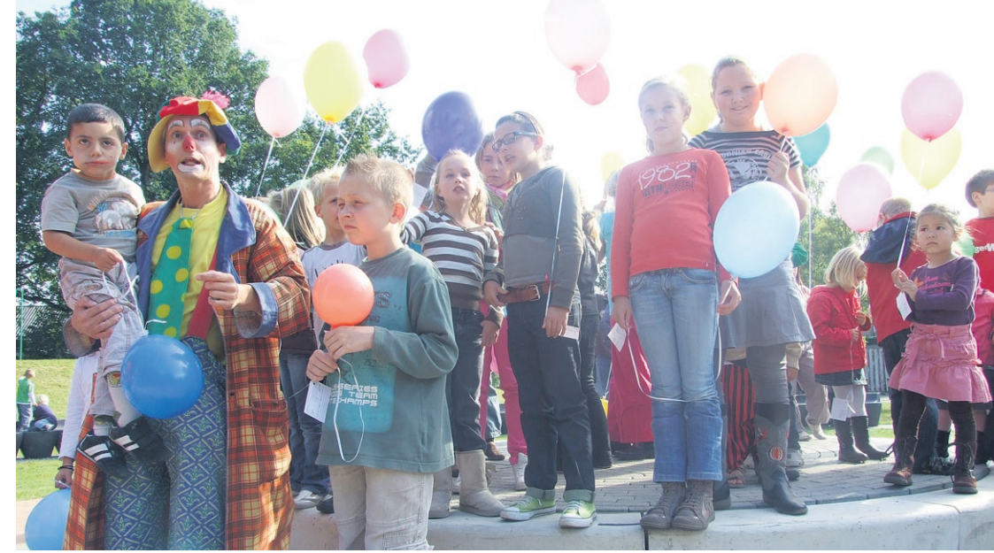
Pannavoetbal, ballonnen, een clown, muziek. Park Honsbergen is heringericht en dat is reden voor een buurtfeest. Ruim 200 bewoners van Klaarwater komen naar het groene hart van de wijk.