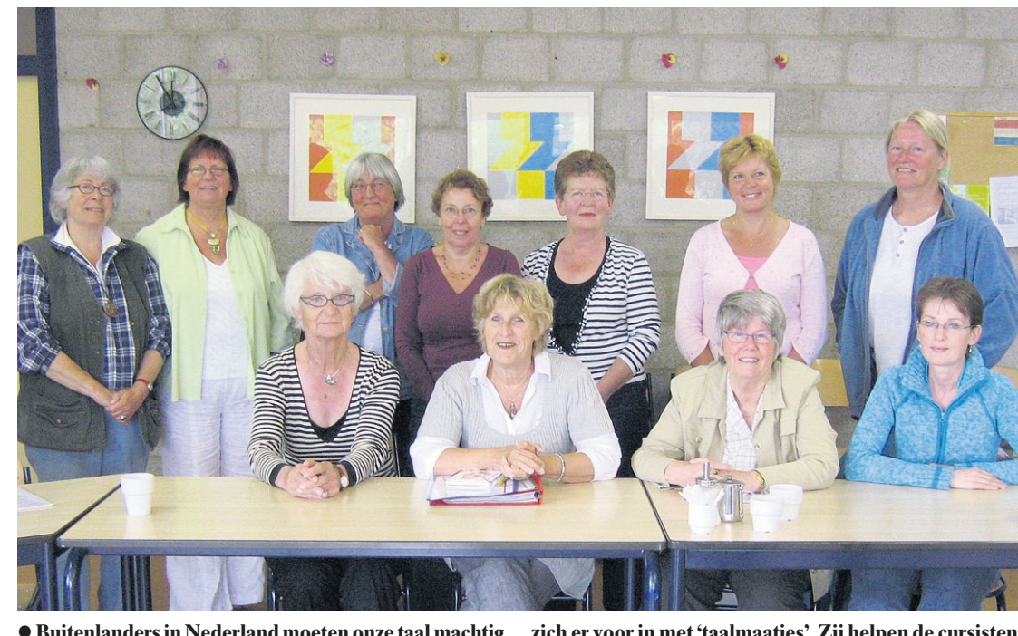
Buitenlanders in Nederland moeten onze taal machtig worden. Maar wie leert ze dat? Vluchtelingenwerk zet zich er voor in met 'taalmaatjes'. Zij helpen de cursisten op weg naar het inburgeringsexamen.

Waarvoor komen Soesters hun deur uit en wat houdt hen tegelijkertijd (figuurlijk dan) van de straat? Het antwoord op die vraag was de invalshoek voor het samenstellen van dit jaaroverzicht. Ditmaal geen moskee, geen herinrichting van de Van Weedestraat, de vliegbasis of het Smitsveen; geen kampioenen, geen politici, geen mensen die vaak het nieuws mede bepalen, er een rol in spelen of op welke wijze dan ook op de voorgrond staan. 'Gewone' mensen die toch 'speciaal' zijn. Voorbeelden te over. Vandaar een willekeurige greep uit de vrijetijdsbesteding van Soesters, in een volgorde die al even willekeurig is. Om nog even achterom te kijken. Voor straks: directie en medewerkers van de Soester Courant wensen u een gezond en gelukkig 2009!