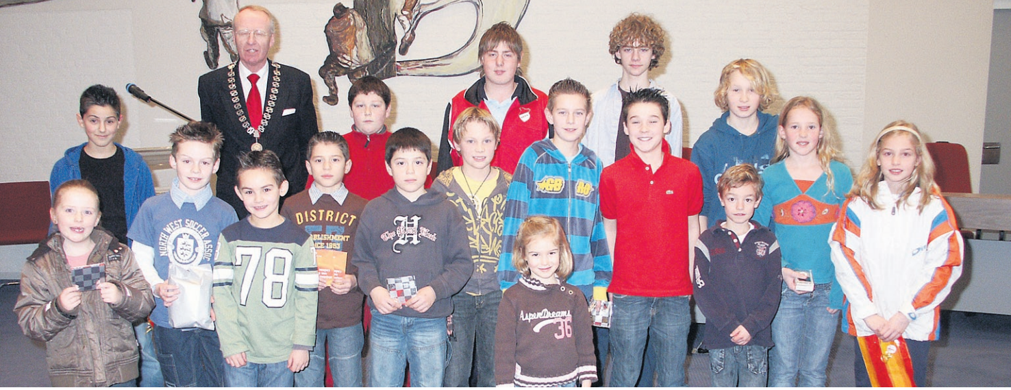
● Twintig kinderen vallen in de prijzen. Samen met anderen verzamelden ze 7800 kilo aan restanten van rotjes, vuurpijlen en ander sier-en