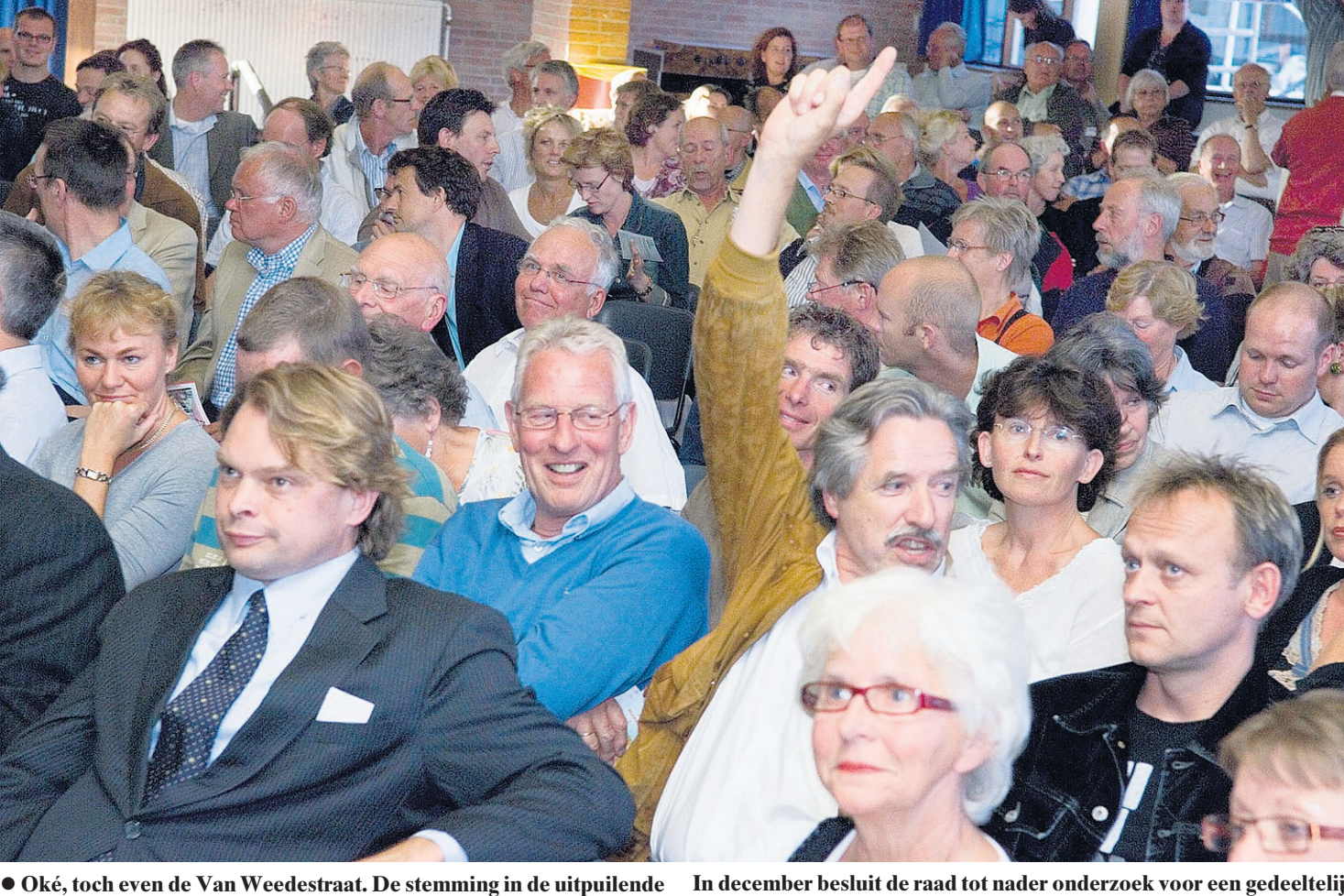
Oké, toch even de Van Weedestraat. De stemming in de uitpuilende aula van het Griffland College lijkt vrolijk, de discussie is bloedserius. In december besluit de raad tot nader onderzoek voor een gedeeltelijk autovrije Van Weedestraat.