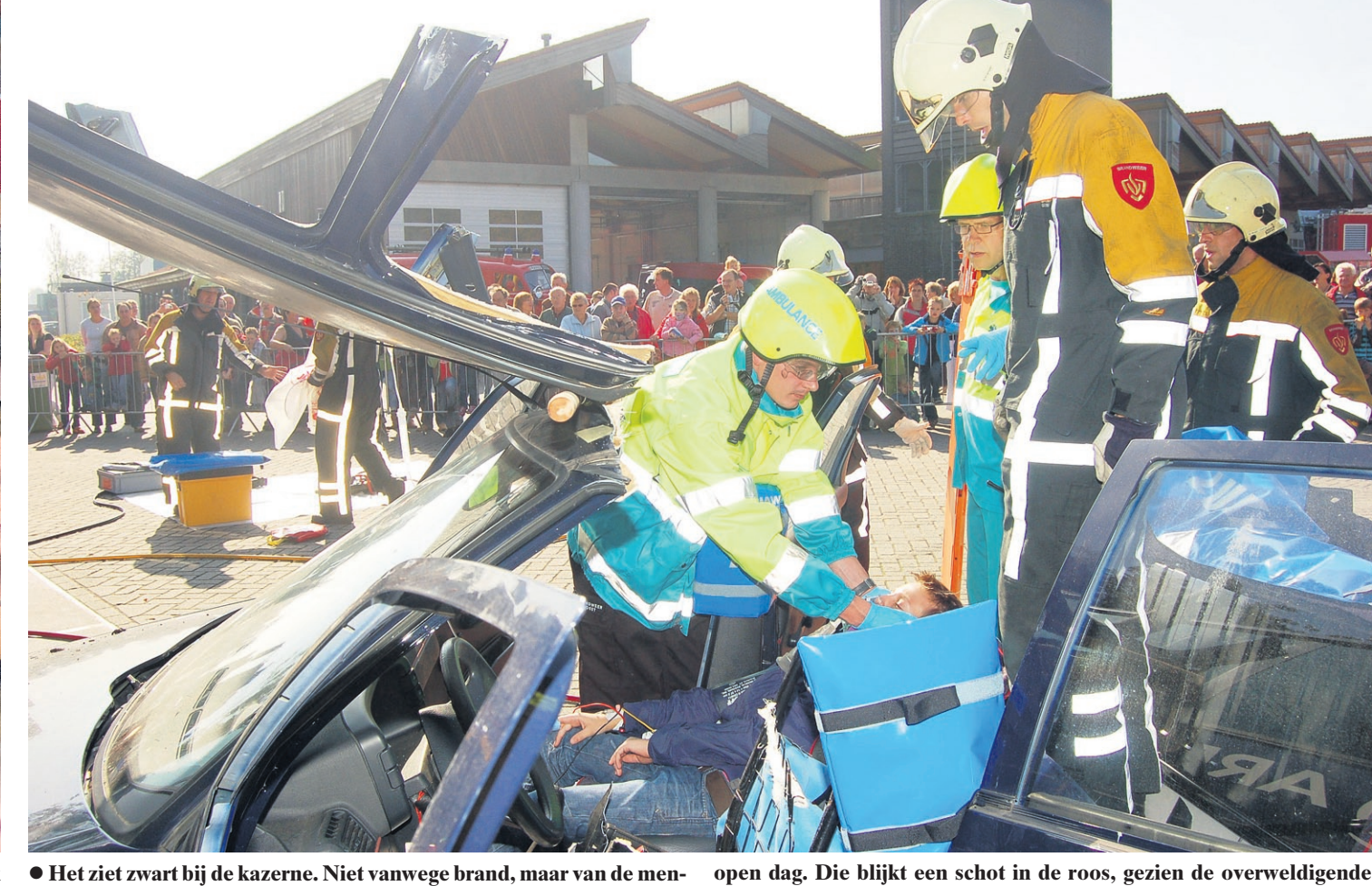
Het ziet zwart bij de kazerne. Niet vanwege brand, maar van de mensen. De 85-jarige Vereniging Vrijwillige Brandweer pakt uit met een open dag. Die blijkt een schot in de roos, gezien de overweldigende belangstelling.