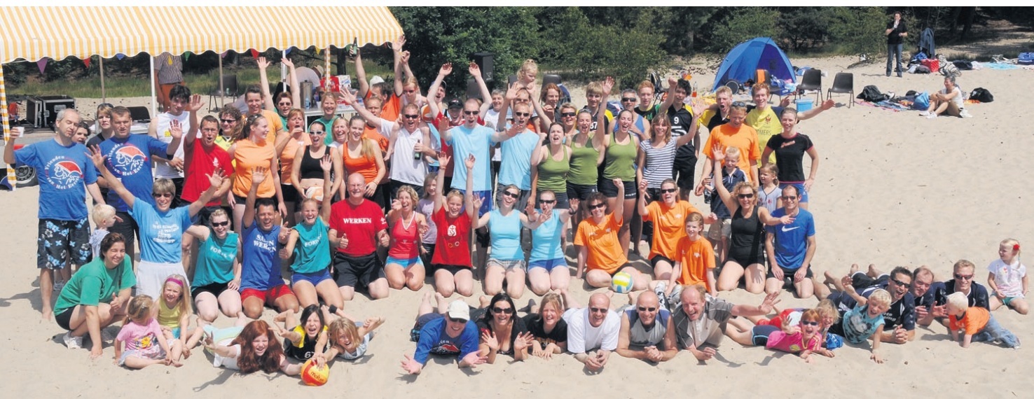
● Geen wedstrijdspanning of stofbijten in de zaal, maar sportief plezier en zandhappen in de Lange Duinen. Dat net en belijning niet zo strak