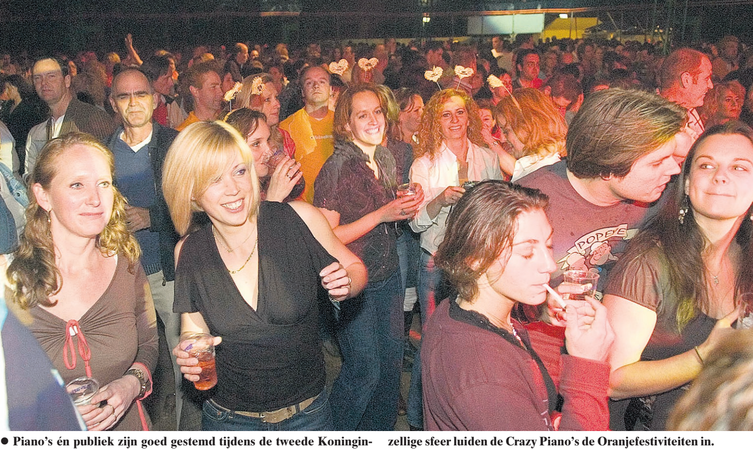
Piano's én publiek zijn goed gestemd tijdens de tweede KoninginneNach van Soest. De tent op de Eng barst uit z'n voegen. In een oergezellige sfeer luiden de Crazy Piano's de Oranjefestiviteiten in.