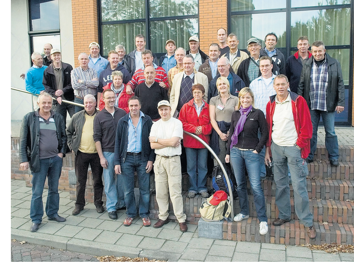
● Een enthousiaste groep van 33 bouwers vertrekt naar Zambia om daar zes huisjes te bouwen. Er wordt