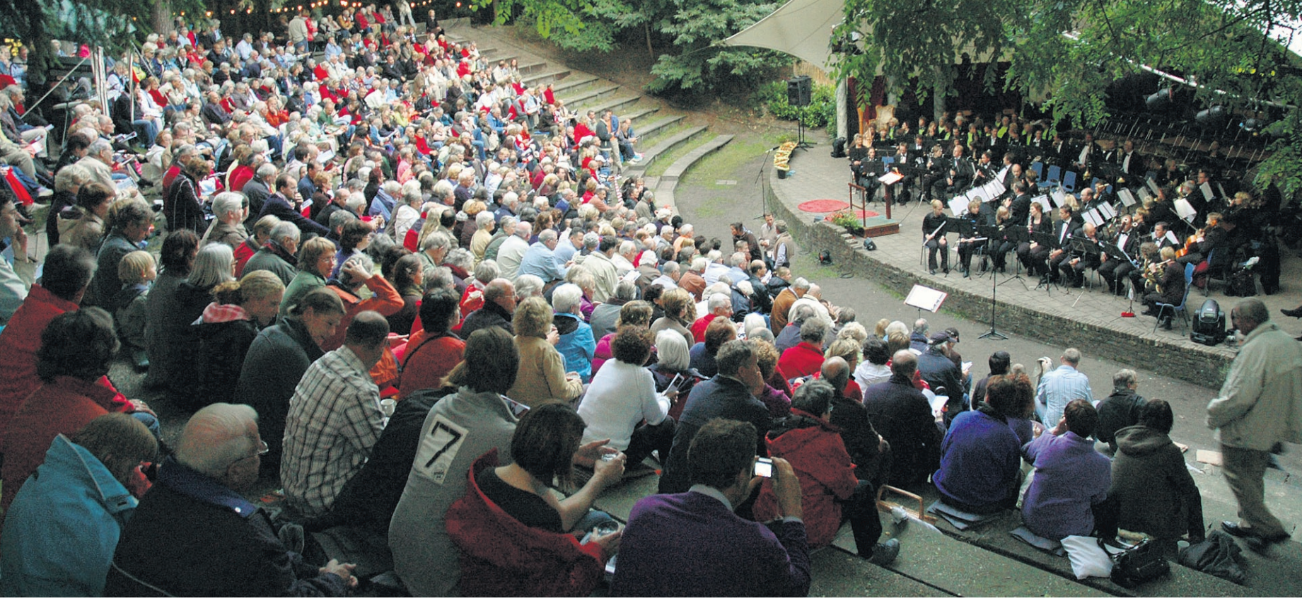
● Koren, orkesten en solisten laten een diepe indruk achter bij de toeschouwers die bijna alle zitplaatsen van Cabrio bezetten. Het openluchttheater bestaat zeventig jaar en krijgt