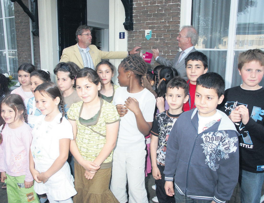
● De Muziekschool Soest heeft heel wat in haar mars. Als een van de eerste in ons land krijgt ze een kwaliteits-