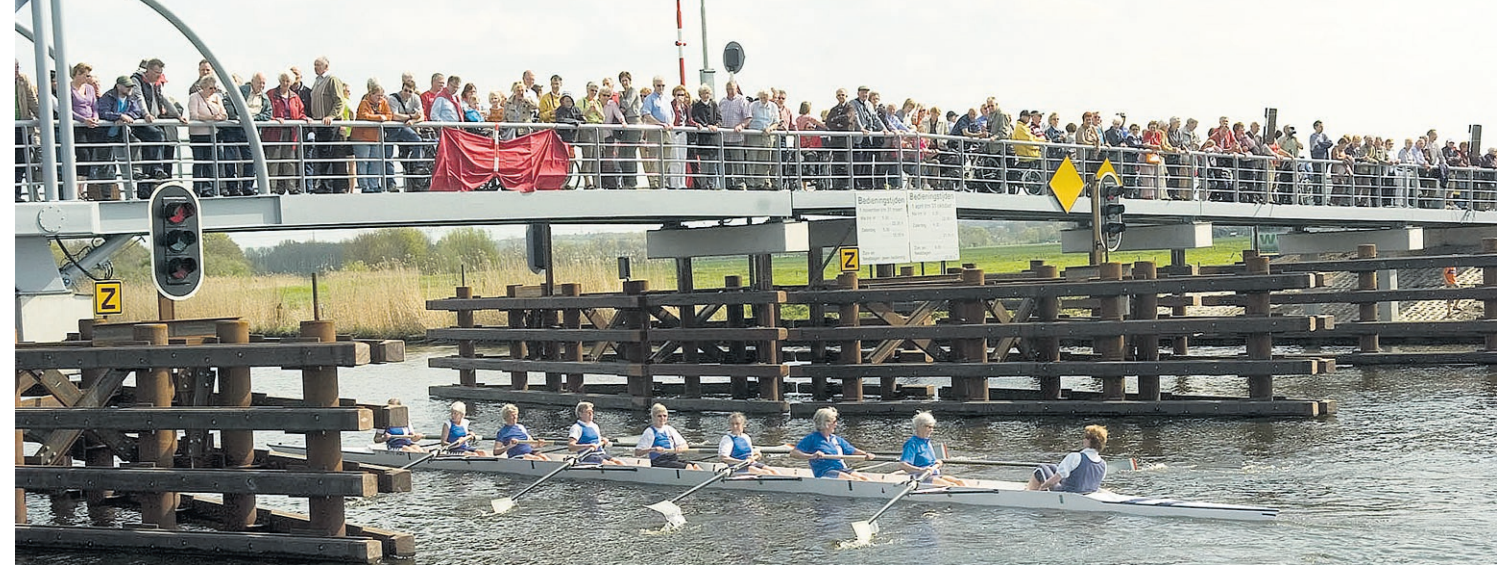
● Vooral fietsliefhebbers strekken de benen om de opening van de Ma-lebrug over de Eem bij te wonen en de vlootshow te aanschouwen.