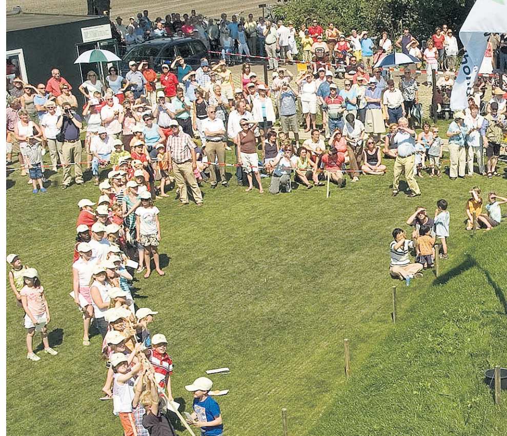
● Decennia lang duurden de voorbereidingen achter de schermen. De laatste jaren ging het, mede dankzij veel sponsors en vrijwilligers ineens snel. Stellingkorenmolen De Wind-