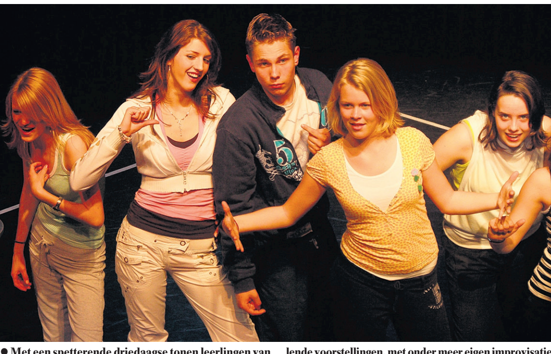
Met een spetterende driedaagse tonen leerlingen van Jeugdtheaterschool Idea wat ze geleerd hebben. Verschillende voorstellingen, met onder meer eigen improvisaties op Shakespeare, passeren de revue.