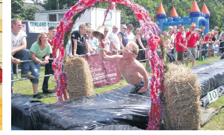
Het buikglijden is het spectaculaire onderdeel van het vijfde Zomerfeest van de Rooms-Katholieke Jongeren Soest. One Two Trio, het luchtkussen, Jacques Herb en veel meer zorgen aan de Birkstraat voor een heel weekend gevarieerde pret voor jong en oud.