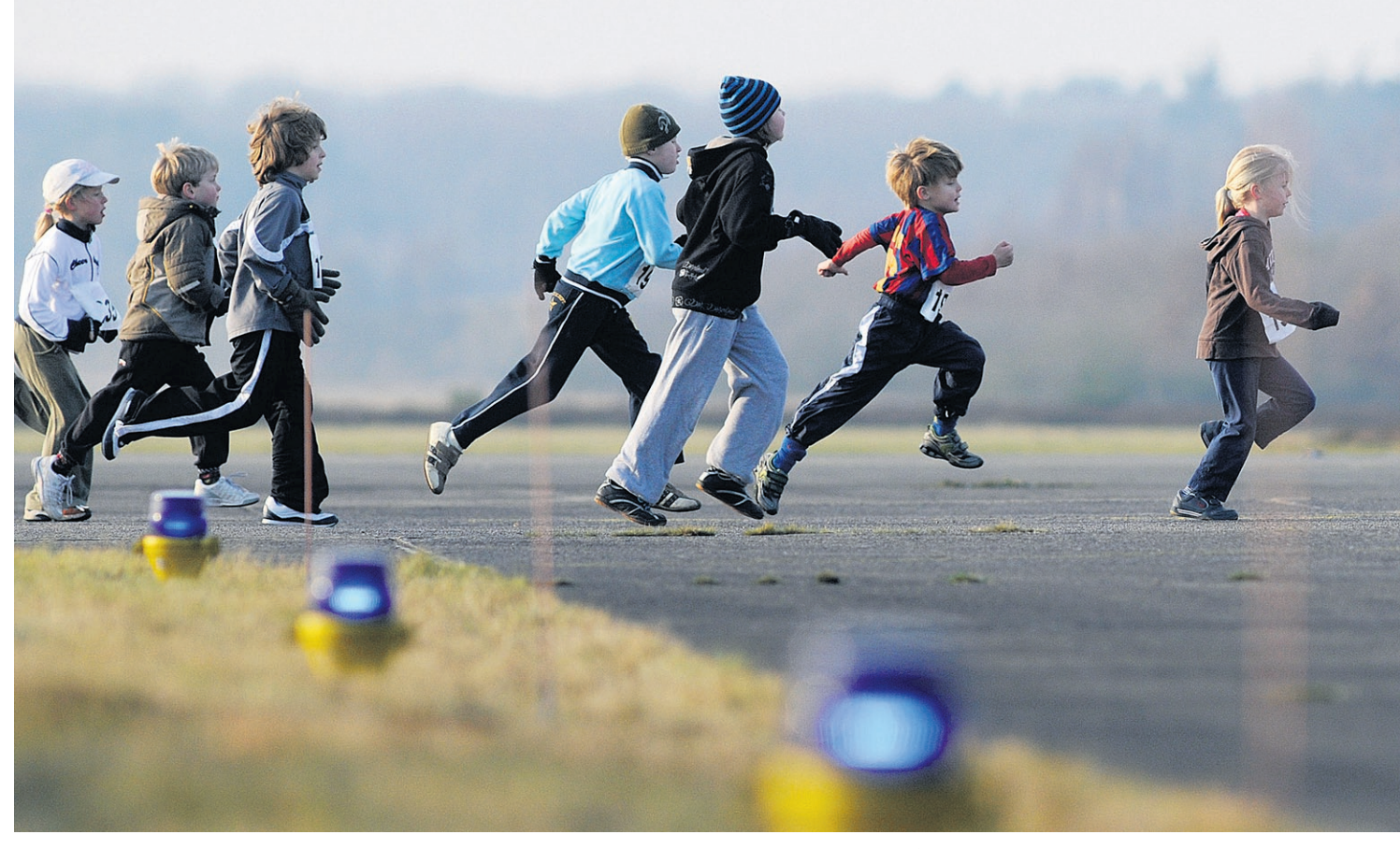
● Vliegenschlagers snellen ruim tweeduizend atleten over de startbaan van de vliegbasis. F-16's en Cougars maken ruim baan voor de deelne-