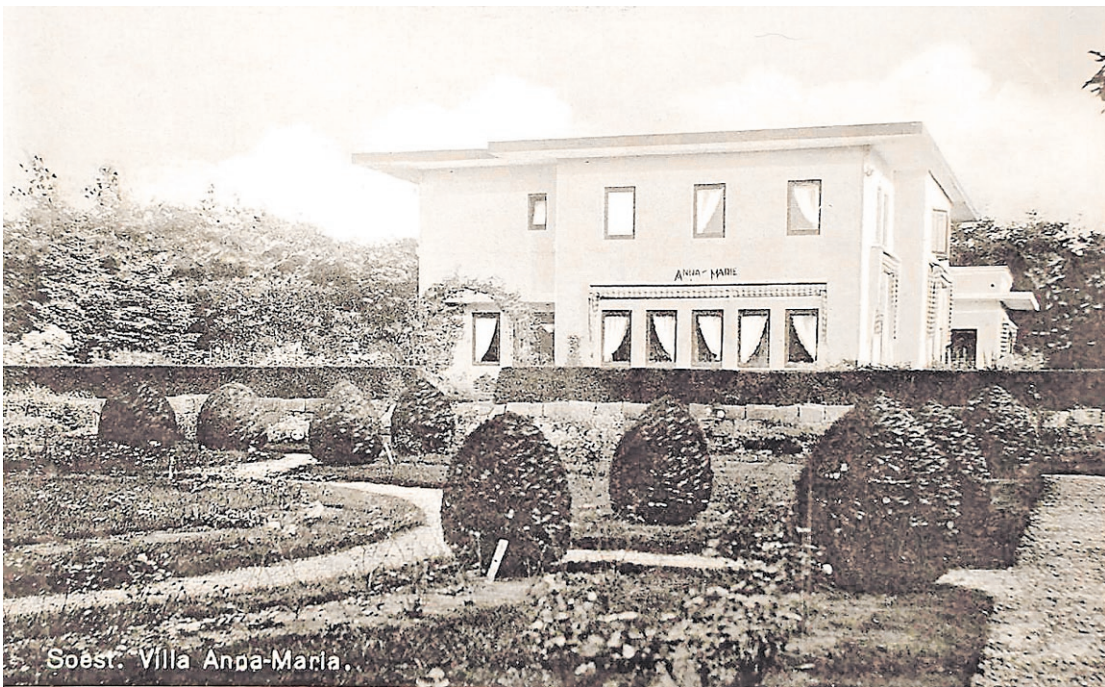
Soest: Villa Anna-Marie.

Kennelijk was het boerendorp Soest van toen nog niet aan zoiets apart, moois en chique toe. De grammofoonplaat was als onderdeel van de