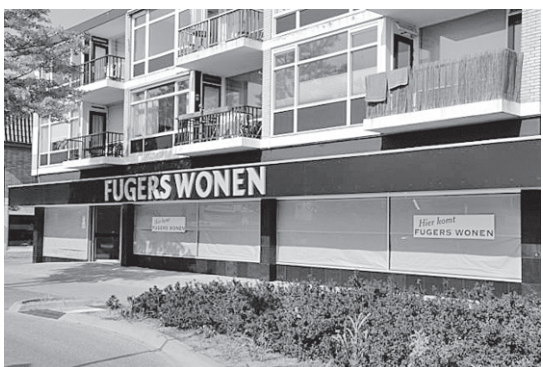
● De nieuwe zaak aan de Soesterbergsestraat.

Na een periode van vijftientig jaar is Fugers Wonen, de bekende meubelzaak aan de Middelwijkstraat 38, verhuisd naar een ander adres. De firma verruult de voormalige 'kaasfabriek' (die van 1904 dateert) voor het vroegere pand van Provak Ceelen aan de Soesterbergsestraat 4. Komende vrijdag (8 augustus) gaat de nieuwe winkel open.