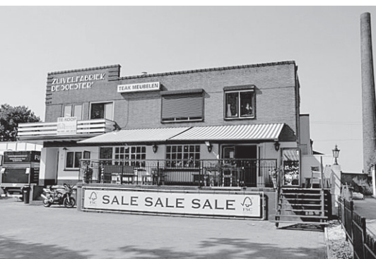
● De oude vestiging aan de Middelwijkstraat.