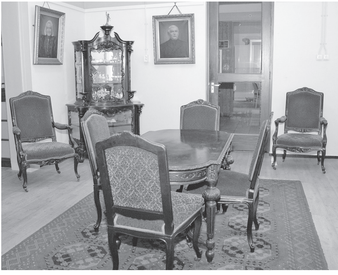
De nieuwe 'antichambre' in Museum Oud Soest.

Ook de Isingskamer heeft weer een metamorfose ondergaan. De gehele expositie van tekeningen en illustraties van de welbekende illustrator is vervangen. De heer Hórst uit Ermelo, die een groot gedeelte van de verzameling van Isings in zijn bezit heeft, is weer enkele dagen druk bezig geweest om een groot aantal (school)platen, boeken en illustraties te vervangen. Vanaf heden is dus weer een prachtige