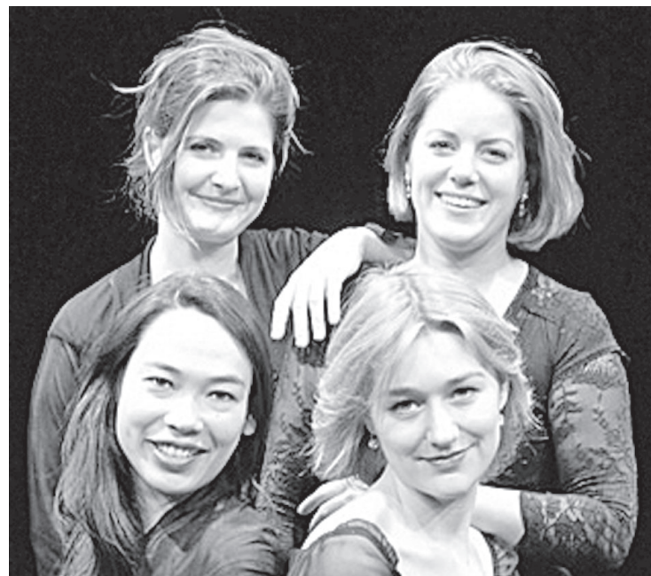
● Het Jenufa Kwartet treedt op zondag 9 november op in Hilton Royal Parc.