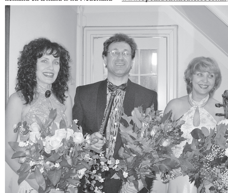
● Het Russische ensemble Trio Sonata.