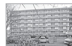
Albert Cuyplaan 12 A

Reactienummer : 210714016 Wijk : De Engh Woningtype : Flat met lift Aantal kamers : 1 Opp.woonkamer : 16m2 Opp. sl. kamers : 7m2 Etage : Begane grond Beschikbaar per: 15 jul 2007 ov