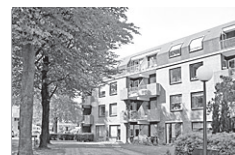
Burg. Grothestr. 82 312

Reactienummer : 210714015 Wijk : Soestdijk Woningtype : Flat met lift Aantal kamers : 2 Opp.woonkamer : 26m2 Opp. sl. kamers : 12m2 Etage : 3e etage Beschikbaar per: 1 jul 2007 ov