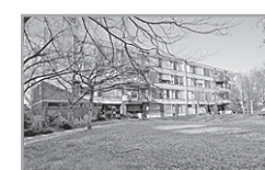
W. Beckmanstraat 82

Reactienummer : 210714004 Wijk : Klaarwater Woningtype : Flat zonder lift Aantal kamers : 3 Opp.woonkamer : 13m2 Opp. sl. kamers : 13m2, 8m2 Etage : Begane grond Beschikbaar per: 31 jul 2007 ov