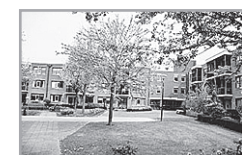
W. Beckmanstraat 349

Reactienummer : 210714009 Wijk : Klaarwater Woningtype : Flat met lift Aantal kamers : 3 Opp.woonkamer : 20m2 Opp. sl. kamers : 15m2, 13m2 Etage : 5e etage Beschikbaar per: 2 jul 2007 ov