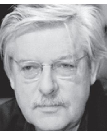
• Jan Siebelink.