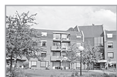
Burg. Grothestr. 78 115

Verhuurder : Zorggroep Laak &amp; Eemhoven