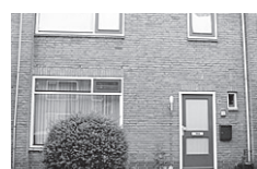
Betje Wollfiaan 30

Reactienummer : 210714002 Wijk : Soest-Zuid Woningtype : Eengezinswoning Aantal kamers : 4 Opp.woonkamer : 22m2 Opp. sl. kamers : 11m2, 7m2, 10m2 Etage : Begane grond Beschikbaar per: 3 sep 2007 ov