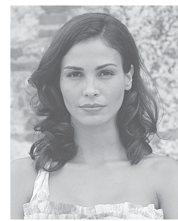
• Scène uit 'The Lost City'.

Een romantische en nostalgische film over Cuba. 'The Lost City' is het regiedebuut van acteur Andy Garcia. Een film waaraan hij zestien jaar werkte en waarin hij een beeld schetst van het precommunistische Cuba. Hij leefde daar destijds zelf en emigreerde met zijn rijke ouders naar Miami Beach in Florida, ten tijde van de communistische revolutie.