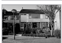
W. Speelmanhof 23

Reactienummer : 0603110 Wijk : Klarwater Woningtype : eengezinswoning Aantal kamers : 5 Opp.woonkamer : 27 Etage : Begane grond Beschikbaar per : 17-02-2006