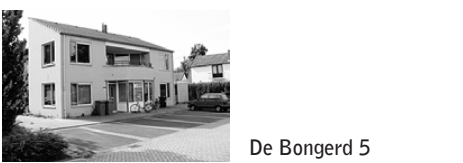
De Bongerd 5

Het gewest Eemland bestaat uit de gemeenten Amersfoort, Baarn, Bunschoten, Eemnes, Leusden, Soest en Woudenberg